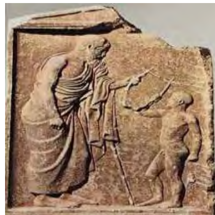
Εικόνα5 : Ο ποιητής Πίνδαρος 49

Οι ποιητές ύμνησαν και αποθανάτισαν το αθλητικό και αγωνιστικό ιδανικό με απaráμιλλες ωδές (Μουρατίδης,2005). Παράλληλα με όλα αυτά, η φήμη και η δόξα του αθλητή περνούσε από γενιά σε γενιά με τους επιπικίους ύμνους, με τις ωδές, δηλαδή που έγραφαν για χάρη του, οι μεγάλοι ποιητές. Ο Πίνδαρος, ο Βακχυλίδης και ο Σιμεωνίδης έψαλλαν με επιπικίες ωδές τα κατορθώματα Ολυμπιονικών, Πυθιονικών, Ισθμιονικών και Νεμεονικών (.Λαζανά, 2001). Ο Πίνδαρος πίστευε ότι με τη νίκη του ο αθλητής δόξαζε όχι μόνο τον εαυτό του, αλλά και την πατρίδα του, την οικογένειά του, τους νεκρούς προγόνους του (Μουρατίδης,2005).