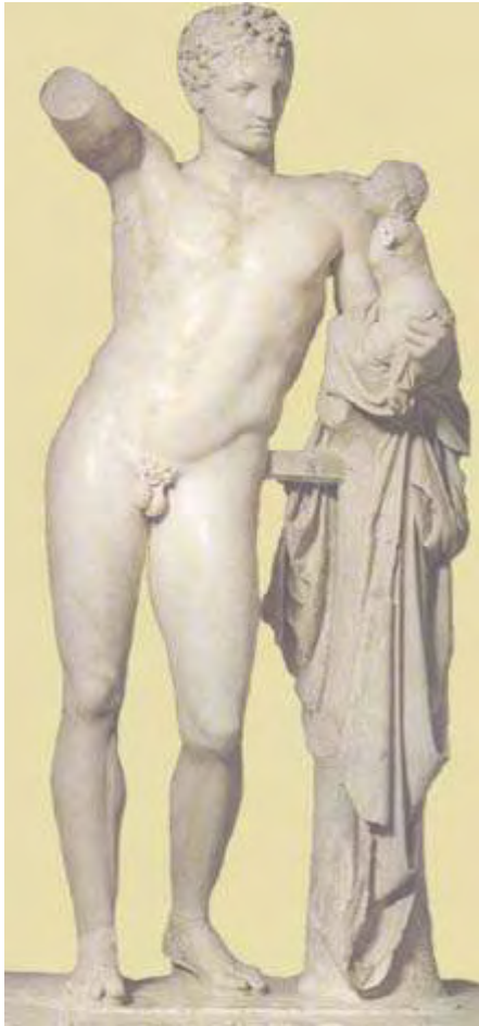
Εικόνα 16: Ο Ερμής του Πραξιτέλη 170