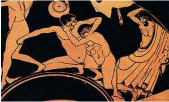
Εικόνα 19: Δύο παγκρατιστές σε λαβή, όπως απεικονίζεται σε ερυθρόμορφη κύλικα του Ε΄ π.Χ. αι. 173