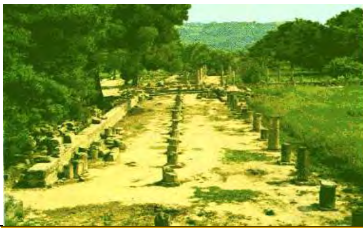
Εικόνα 12: Ο ιππόδρομος της αρχαίας Ολυμπίας