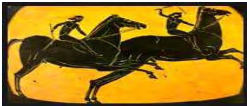
Εικόνα 11: Παράσταση Ιπποδρομίας τέλειων κελήτων από αρχαίο αγγείο

Όταν λοιπόν, διαβάζουμε στα ποιήματα του Πινδάρου τον τίτλο « Ιέρωνι Συρακοσίω κέλητι », αυτό δε σημαίνει ότι τον κέλητα ίππον ίππευσε ο Ιέρων, αλλά ένας άγνωστος τζόκευ. Ακόμη και στις περιπτώσεις, όπου κατ' εξαίρεσιν ο ιδιοκτήτης ο ίδιος ωδήγει το άρμα ή ίππευε, είναι αμφίβολον αν μια τέτοια νίκη του ιδιοκτήτου, του προσύπτε μεγαλύτερη δόξα Ολυμπιονίκου (Φατούρος, 1993).