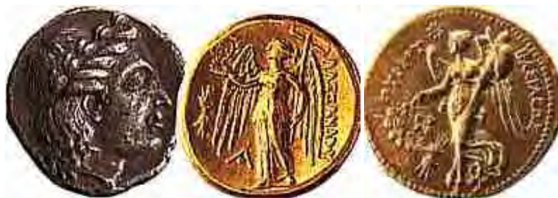
Εικόνα 22: Νομίσματα αρχαϊκής εποχής 176

Απαιτούσε υπέρογκες δαπάνες και γρήγορα αναδείχθηκε σε άθλημα επίδειξης πλούτου και πολιτικής δύναμης. Μάλιστα τη νίκη απολάμβανε ο ιδιοκτήτης και όχι ο ηνίοχος. Η συμμετοχή του Ιέρωνα και του Διονυσίου, τύραννων των Συρακουσών, όπως και άλλων επιφανών ανδρών από την αριστοκρατική τάξη, προκάλεσε αποδοκimasίες. Κατηγορήθηκε ως αριστοκρατικό αγώνισμα, αφού για λόγους οικονομικούς εκπροσωπείτο μόνο από την ανώτερη τάξη. Χαρακτηριστικός είναι ο Ολυμπιακός λόγος του Λυσία κατά του τυράννου των Συρακουσών Διονυσίου που εκφωνήθηκε στην 98η Ολυμπιάδα, 388 π.Χ., προκαλώντας ταραχές.