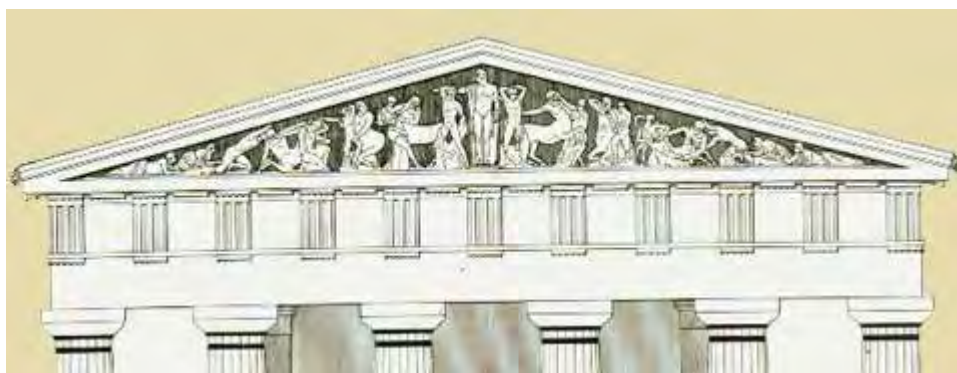
Εικόνα 26: Αναπαράσταση του δυτικού αετώματος του ναού του Διός στην Ολυμπία. 180