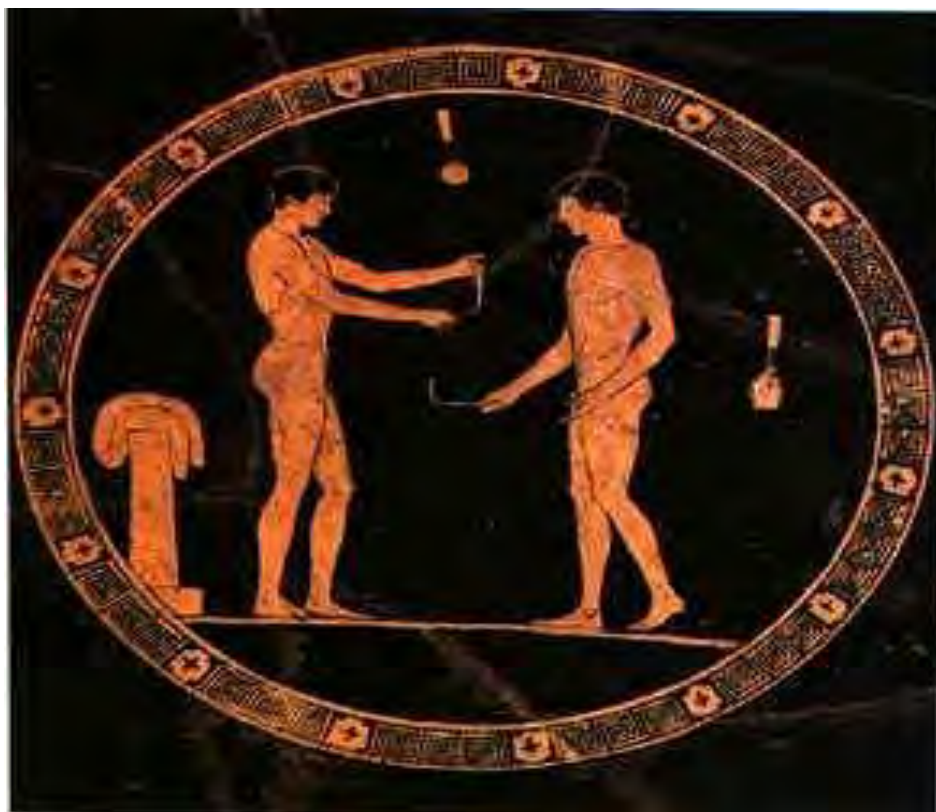
Εικόνα 27: Απεικονίζεται το τέλος των αγώνων