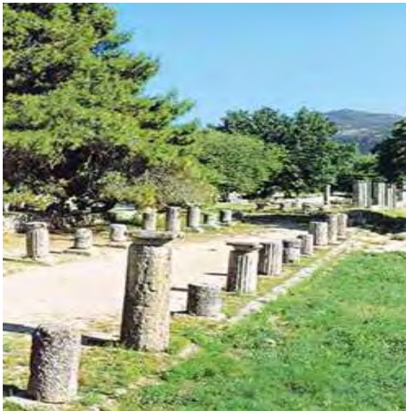
Εικόνα 18: Το Γυμνάσιο της Ολυμπίας που χτίστηκε τον 2ο αι. π.Χ. 172