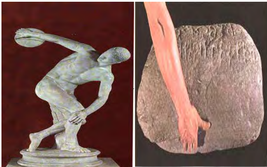
Εικόνα 2: Ο Δισκοβόλος του Μύωνα

Αν και το άγαλμα αποδίδει ατομικά χαρακτηριστικά, ενσαρκώνει κυρίως το ιδανικό το «καλού καγαθού». Αυτά τα ωραία κορμιά των αθλητών, με την ευγένεια και την αρμονία που αποπνέουν, είναι δημιούργημα της παιδείας, συστατικά της οποίας ήταν και το αθλητικό ιδεώδες. 19 Και γνωρίζουμε ότι πολλοί γλύπτες κάνουν έργο της ζωής τους, την απόδοση αυτού του αθλητικού ιδεώδες. Τέτοια έργα είναι π.χ. ο Ηνίοχος των Δελφών, που αφιέρωσε στους Δελφούς εκ Σικελίας Πολύζηλος για τη νίκη του το 478π.Χ., ο Δισκοβόλος του Μύρωνος, ο Δορυφόρος του Πολυκλείτου.