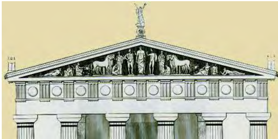
Εικόνα 25: Αναπαράσταση του ανατολικού αετώματος του ναού του Διός στην Ολυμπία. 179