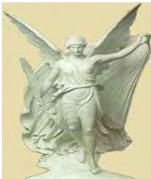
Εικόνα 7: Αναπαράσταση της Νίκης του Παιώνιου

Ο Φίλιππος, γιος του Βουτακίδη, γεννημένος στο Κρότωνα, ήταν Ολυμπιονίκης και ο ωραιότερος Έλληνα της εποχής του. Εξαιτίας των επιδόσεών του και της εξαιρετικής ομορφιάς του, δέχτηκε από το λαό της Έγεστας τη μοναδική τιμή να χτιστεί πάνω στο τάφο του ο βωμός του ήρωα, προς τιμήν του οποίου γίνονταν θρησκευτικές τελετές. 54