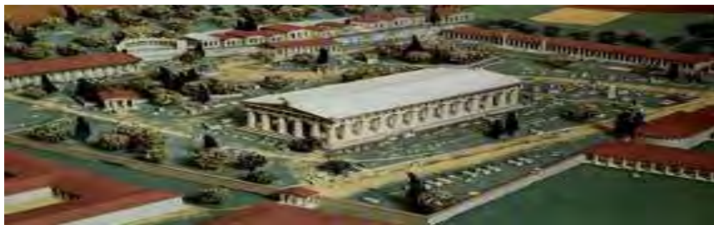
Εικόνα 1: Ιερά Άλτης