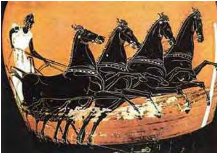
Εικόνα 20: Παράσταση με φάση αρματοδρομίας τεθρίππου 174

Ολυμπίας, αλλά και τον μεγαλύτερο πλούτο σε πληροφορίες γύρω από τους Αγώνες. Γράφει τα «Ηλιακά» το 173 μ.Χ. και πρέπει να επισκέφθηκε την περιοχή μεταξύ 160 και 173 μ.Χ. που αρχίζει τη συγγραφή. Σε λιγότερα από 12 κεφάλαια περιγράφει ολόκληρη την Ηλεία, ενώ για την Ολυμπία και τους τελούμενους εκεί Αγώνες αφιερώνει σχεδόν 42 κεφάλαια.