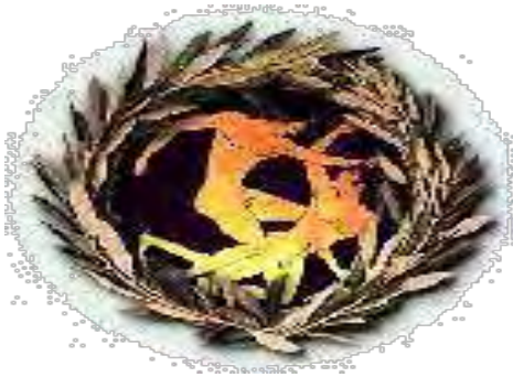
Εικόνα 4: Το έπαθλο των αγώνων, ο κότινος

Ο Πλάτωνας αναφέρει, πως για να βοηθά ο αθλητικός ανταγωνισμός στην στρατιωτική εκπαίδευση, πρέπει να εφαρμοστεί και να καθιερωθούν βραβεία για τους νικητές. 47