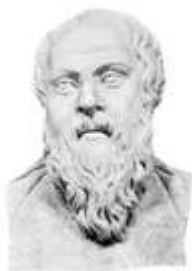
Εικόνα 15: Ο αρχαίος φιλόσοφος Σωκράτης 169

1.Χάλκινο άγαλμα Έλληνα πυγμάχου 2.Χάλκινο άγαλμα Ρωμαίου πυγμάχου Τέλεια εναρμόνιση ψυχικού και (Παρίσι, Μουσείο Λούβρου) σωματικού κάλλους. (Museo Nazionale Romano)