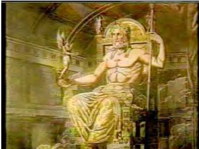
Εικόνα 3: Αναπαράσταση του χρυσελεφάντινου αγάλματος του Διός στην Ολυμπία.