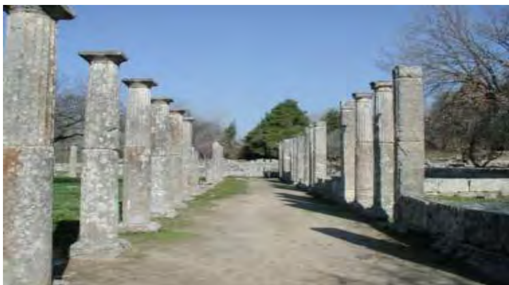
Εικόνα 13: Ότι έχει απομείνει από το ναό του Δία στην Αρχαία Ολυμπία