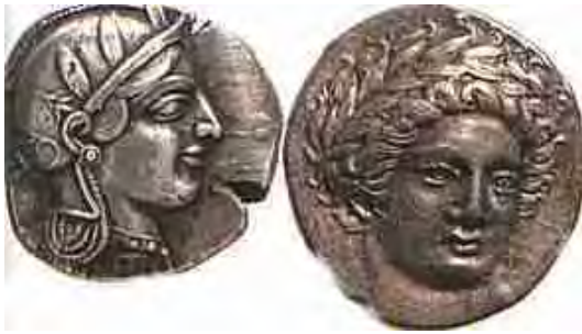
Εικόνα 23: Νομίσματα αρχαϊκής εποχής 177