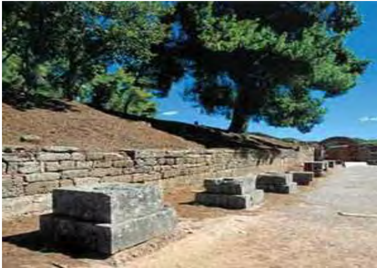
Εικόνα 17: Ολυμπία. Ο δρόμος που οδηγούσε από την Άλτη στο στάδιο, με την είσοδο, την «Κρύπτη», στο βάθος. 171