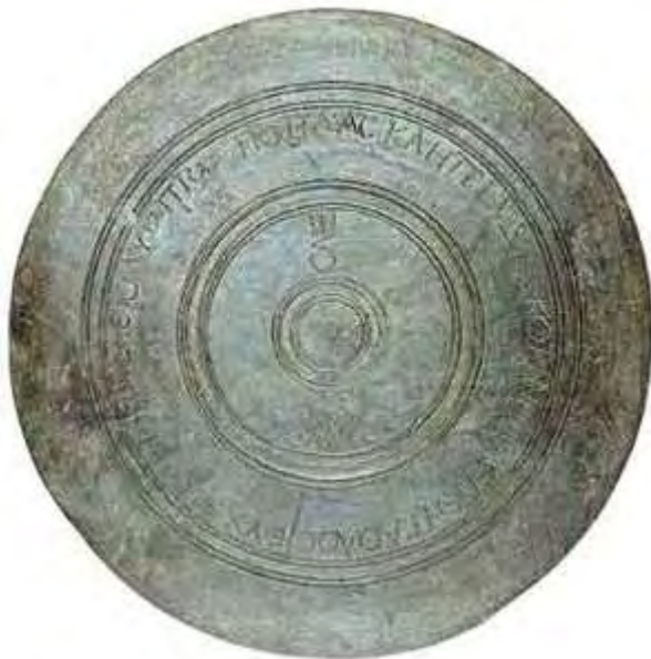
Εικόνα 21: Ο χάλκινος ενεπίγραφος εγχάρακτος δίσκος του Ολυμπιονίκη Πόπλιου Ασκληπιάδη 175