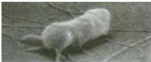
Εικόνα 1. Ηλεκτρονική μικροφωτογραφία S. typhi (Λεοναρδόπουλος & Κούρτη, 1999).

Με βιοχημικές δοκιμασίες, είναι δυνατό να διακριθούν ορισμένα είδη μεταξύ τους ( S. cholerae-suis , S. typhi , S. enteritidis ). Σαφέστερος διαχωρισμός τους είναι δυνατός με βάση την αντιγονική σύσταση (Λεοναρδόπουλος & Κούρτη, 1999).