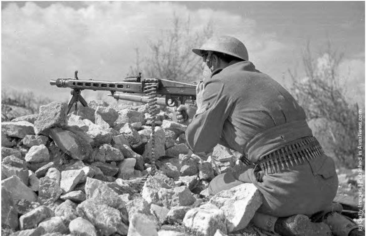
« Εικόνα 16 » Δεκανέας του ΕΕΣ με Γερμανικό πολυβόλο MG42, σε πρόχειρη θέση μάχης (Photo by Bert Hardy/Picture Post/Getty Images). 22nd May 1948

http://avaxnews.com/educative/Greek_Civil_War.html , την 10 Ιουν 12