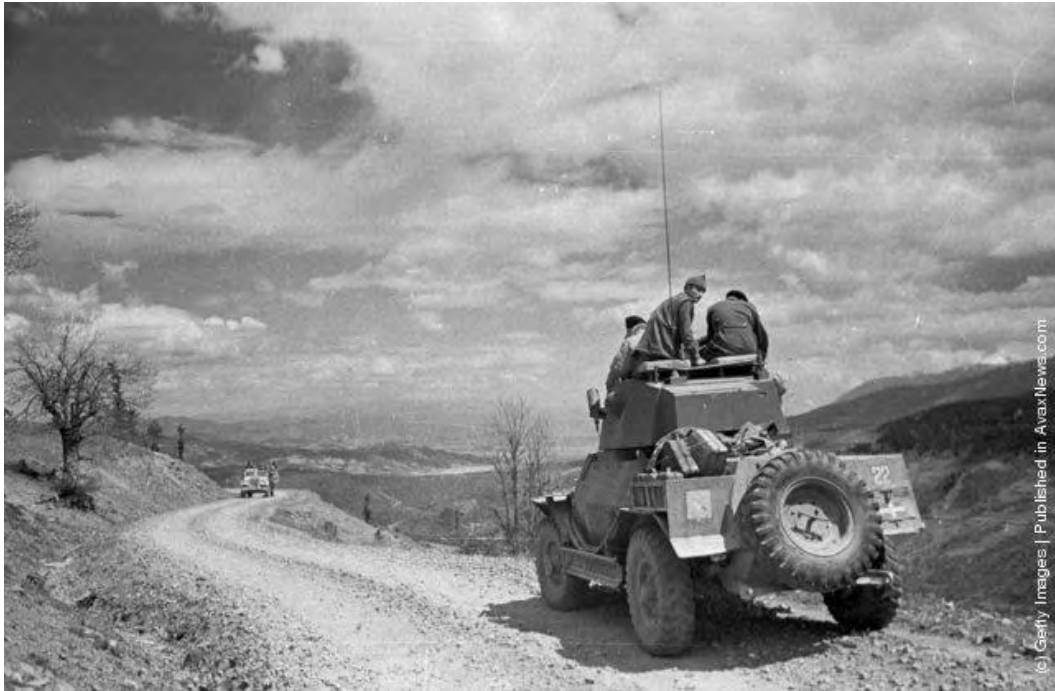
« Εικόνα 17 » Πλήρωμα Βρετανικού τροχοφόρου αναγνωριστικού οχήματος τύπου Marmion – Herrington σε κάποιο ορεινό πέρασμα, ενώ στο βάθος διακρίνεται όχημα τύπου Bedford που μεταφέρει προσωπικό να έρχεται από την αντίθετη κατεύθυνση. (Photo by Bert Hardy/Picture Post/Getty Images). 22nd May 1948 http://avaxnews.com/educative/Greek_Civil_War.html , την 10 Ιουν 12