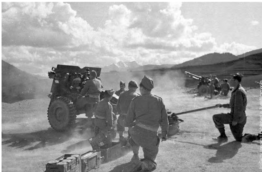
« Εικόνα 10 » Βολή πυροβολικού του ΕΕΣ, με Αγγλικά πυροβόλα 25rdr. Προσέξτε την απουσία οποιασδήποτε προφύλαξης ή προσπάθειας παραλλαγής των πυροβόλων. Αυτό σημαίνει είτε απουσία οποιασδήποτε απειλής από την πλευρά του ΔΣΕ (βολές αντιπυροβολικού ή καταδρομικών τμημάτων), ή πρόκειται για εκπαιδευτική βολή ή για στημένη φωτογράφιση (Photo by Bert Hardy/Picture Post/Getty Images). 22nd May 1948 http://avaxnews.com/educative/Greek_Civil_War.html , την 10 Ιουν 12