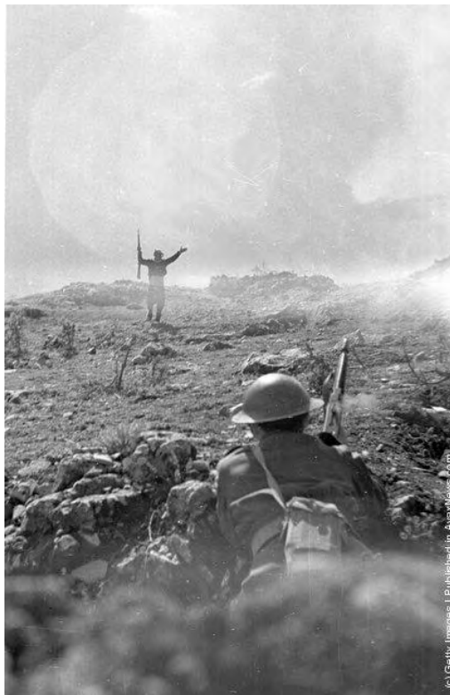
« Εικόνα 18 » Παράδοση αντάρτη του ΔΣΕ στις κυβερνητικές δυνάμεις. Από την στάση και ένδυση του «αντάρτη», όσο και από του στρατιώτη, εκτιμάται ότι πρόκειται για στημένη φωτογραφία για προπαγανδιστικούς σκοπούς. (Photo by Bert Hardy/Getty Images). 1948 http://avaxnews.com/educative/Greek_Civil_War.html , την 10 Ιουν 12