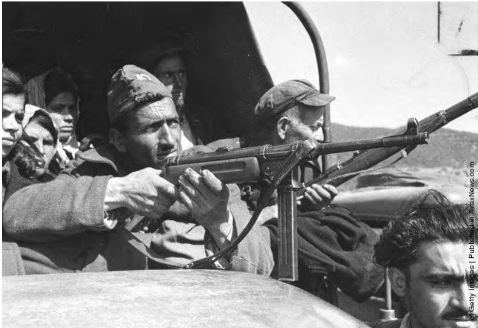
« Εικόνα 8 » Άνδρες της Εθνοφυλακής μεταφέρουν υπόπλους από περιοχές ελεγχόμενες από τις δυνάμεις του ΔΣΕ στη Δράμα. Άξιο προσοχής είναι η έλλειψη ομοιομορφίας στη στολή, ενώ ο άνδρας σε πρώτο πλάνο φέρει Γερμανικό υποπολυβόλο τύπου MP 38 (Smeischer). Από τη στάση τους μάλλον πρόκειται για στιγμή φωτογράφιση (Photo by Bert Hardy/Picture Post/Getty Images). 22nd May 1948

http://avaxnews.com/educative/Greek_Civil_War.html , την 10 Ιουν 12