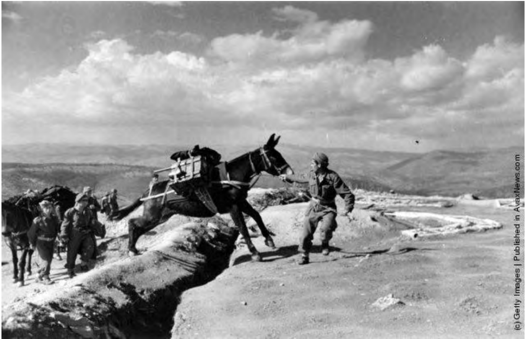
« Εικόνα 5 » Εφοδιοπομπή πυρομαχικών του ΕΕΣ με μουλάρια, κοντά στους Παπάδες Ευβοίας. (Photo by Bert Hardy/Getty Images). 1948 http://avaxnews.com/educative/Greek_Civil_War.html , την 10 Ιουν 12