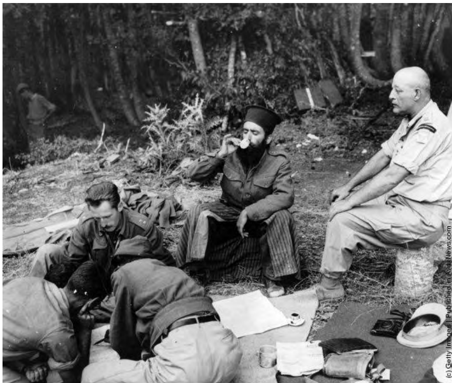
« Εικόνα 6 » Αξιωματικοί του ΕΕΣ σχεδιάζουν επιχειρήσεις στο χάρτη κατά τη διάρκεια της επίθεσης στην κορυφή Κιάφα του Γράμμου, ενώ ένας στρατιωτικός ιερέας πίνει καφέ. Κάθε Ταξιαρχία διέθετε έναν στρατιωτικό ιερέα, ο οποίος την ακολουθούσε παντού. Ο κύριος στα δεξιά της φωτογραφίας φέρει στολή και διακριτικά «Πολεμικού Ανταποκριτή», ενώ από τα ανθρωπομορφικά χαρακτηριστικά του μοιάζει για αλλοδαπός (Photo by Federico Patellani/Getty Images). 1947 http://avaxnews.com/educative/Greek_Civil_War.html , την 10 Ιουν 12