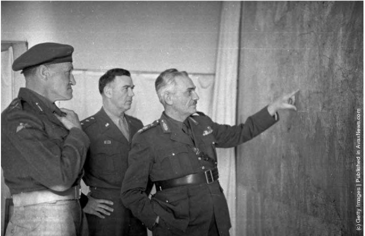
« Εικόνα 15 » Ο Αρχηγός του ΓΕΣ, Αντιστράτηγος Δημήτριος Γιαντζής κατά τη διάρκεια σύσκεψης με τον Αμερικανό αντιστράτηγο James Van Fleet (κέντρο) και τον Βρετανό Υποστράτηγο Down (αριστερά). (Photo by Bert Hardy/Picture Post/Getty Images). 22nd May 1948

http://avaxnews.com/educative/Greek_Civil_War.html , την 10 Ιουν 12