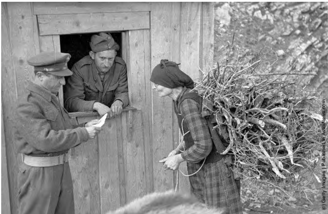
« Εικόνα 14 » Χωρική σε κυβερνητικό φυλάκιο ελέγχου πριν την επιβολή της νυχτερινής απαγόρευσης κυκλοφορίας. Προσέξτε ότι ο Αξκός της φωτογραφίας έχει αφαιρέσει τα διακριτικά από τις επωμίδες του για να μη δίνει στόχο στους ελεύθερους σκοπευτές του εχθρού. (Photo by Bert Hardy/Picture Post/Getty Images). 22nd May 1948 http://avaxnews.com/educative/Greek_Civil_War.html , την 10 Ιουν 12