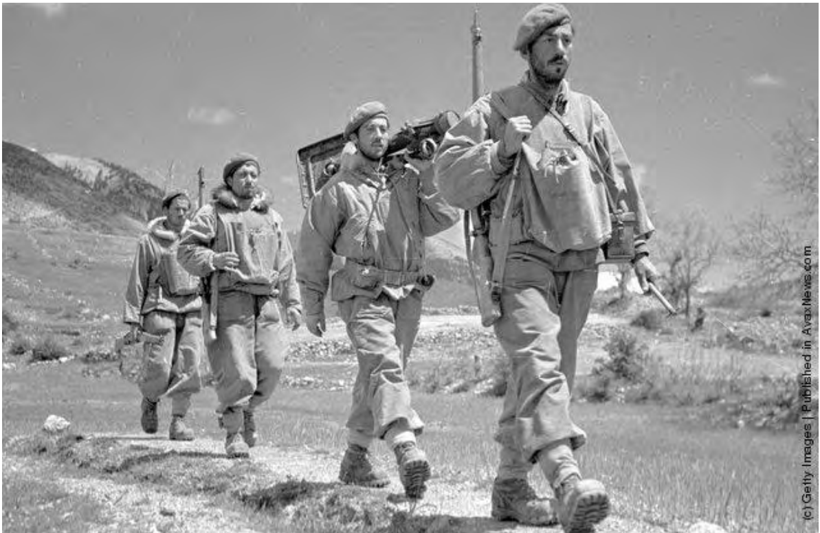
« Εικόνα 13 » Στοιχείο όλμου 60χιλ. των ΛΟΚ. Φέρουν συνδυασμό Αγγλικού και Αμερικανικού εξοπλισμού. (Photo by Bert Hardy/Picture Post/Getty Images). 1948 http://avaxnews.com/educative/Greek_Civil_War.html , την 10 Ιουν 12