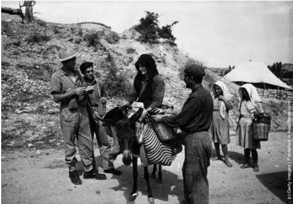
« Εικόνα 7 » Στρατιώτες σε φυλάκιο ελέγχου του ΕΕΣ ερευνούν χωρικό και τη σύζυγό του για την παράνομη μεταφορά οπλισμού – υλικών στους αντάρτες του ΔΣΕ. Οι στρατιώτες φέρουν εξοπλισμό Βρετανικού τύπου (Photo by Haywood Magee/Picture Post/Getty Images). October 1947

http://avaxnews.com/educative/Greek_Civil_War.html , την 10 Ιουν 12