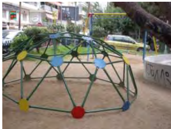
Υπαίθριος χώρος παιχνιδιού 2