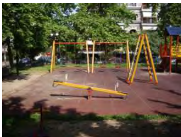
Υπαίθριος χώρος παιχνιδιού 8