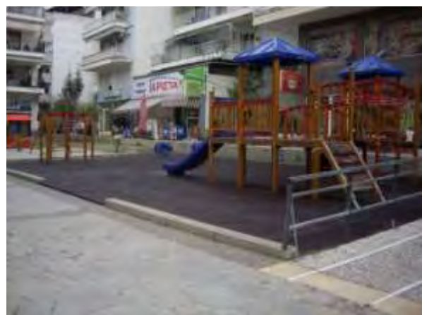
Υπαίθριος χώρος παιχνιδιού 7