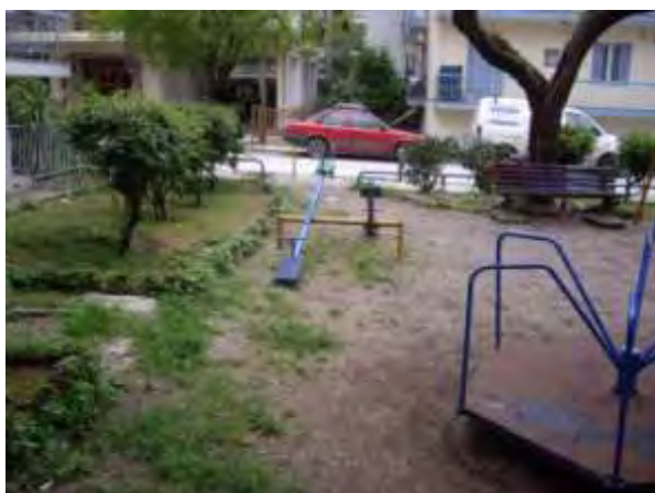
Υπαίθριος χώρος παιχνιδιού 3