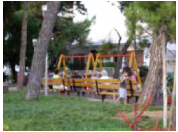
Υπαίθριος χώρος παιχνιδιού 13