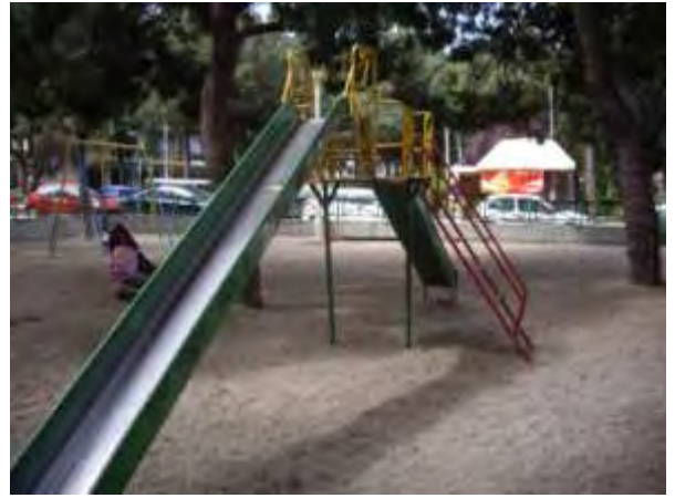
Υπαίθριος χώρος παιχνιδιού 9