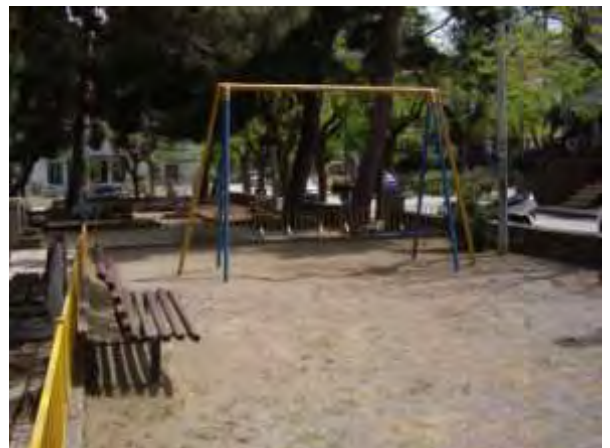
Υπαίθριος χώρος παιχνιδιού 11