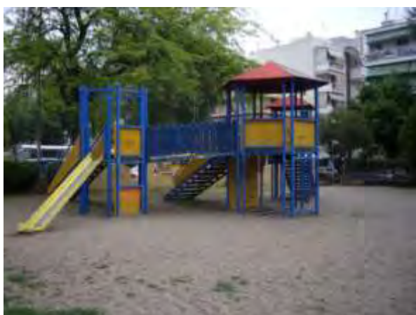
Υπαίθριος χώρος παιχνιδιού 4