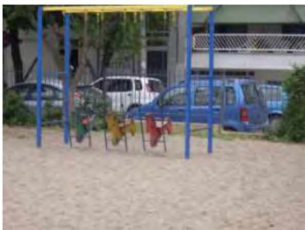
Υπαίθριος χώρος παιχνιδιού 4