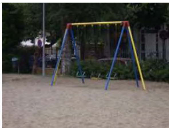
Υπαίθριος χώρος παιχνιδιού 4