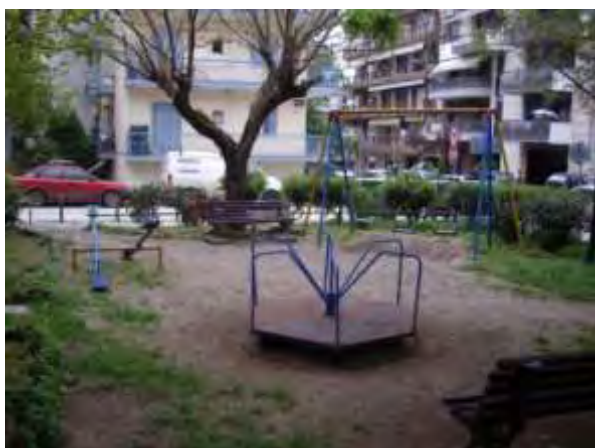
Υπαίθριος χώρος παιχνιδιού 3