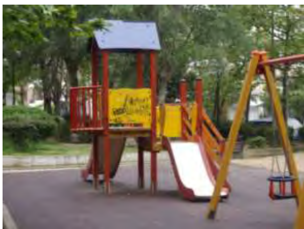
Υπαίθριος χώρος παιχνιδιού 1