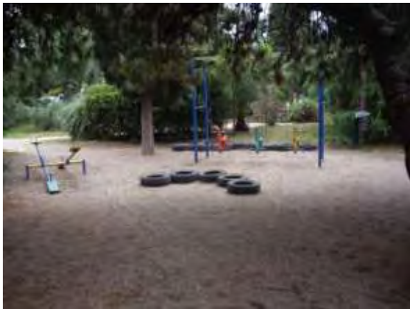
Υπαίθριος χώρος παιχνιδιού 6