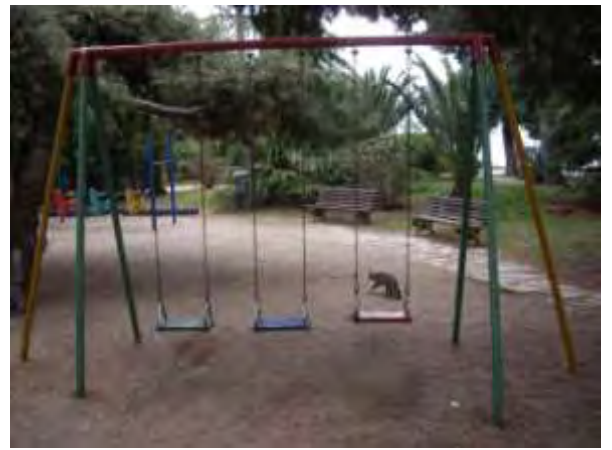
Υπαίθριος χώρος παιχνιδιού 6