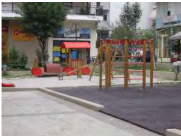
Υπαίθριος χώρος παιχνιδιού 7