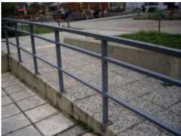
Υπαίθριος χώρος παιχνιδιού 7