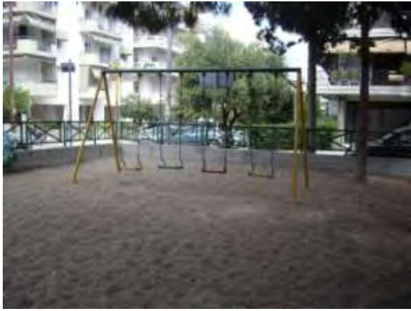
Υπαίθριος χώρος παιχνιδιού 9