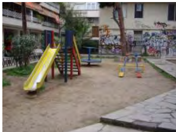
Υπαίθριος χώρος παιχνιδιού 2