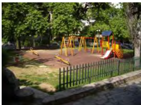
Υπαίθριος χώρος παιχνιδιού 8