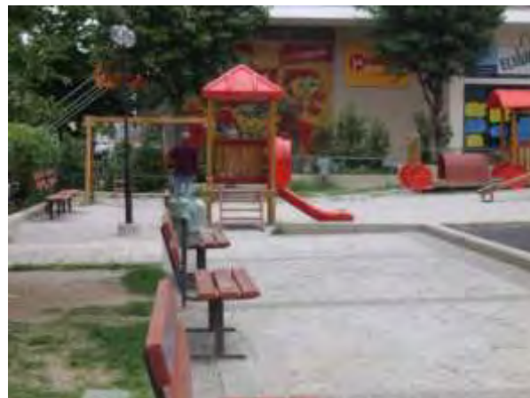
Υπαίθριος χώρος παιχνιδιού 7