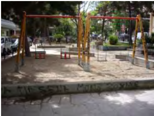
Υπαίθριος χώρος παιχνιδιού 10