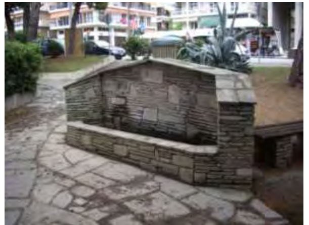
Υπαίθριος χώρος παιχνιδιού 6