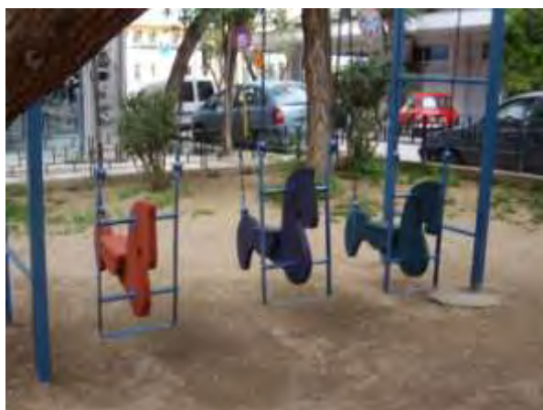
Υπαίθριος χώρος παιχνιδιού 2