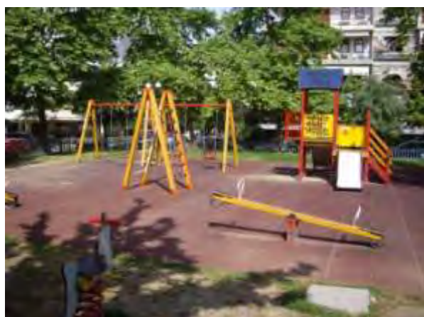
Υπαίθριος χώρος παιχνιδιού 8