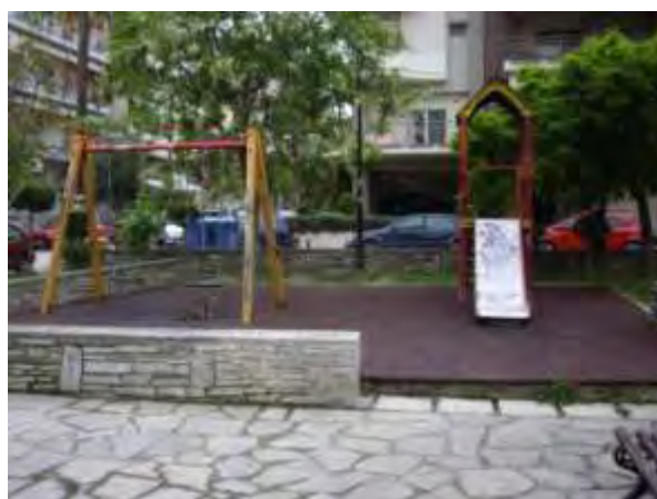
Υπαίθριος χώρος παιχνιδιού 5