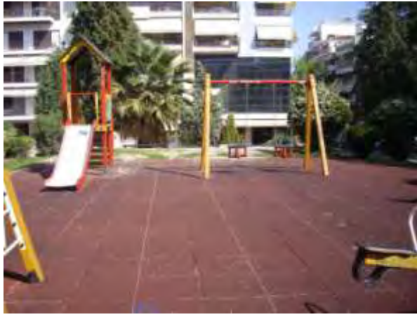
Υπαίθριος χώρος παιχνιδιού 12