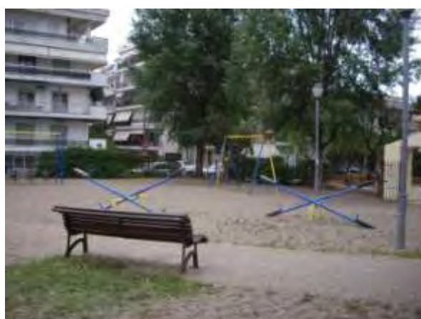
Υπαίθριος χώρος παιχνιδιού 4