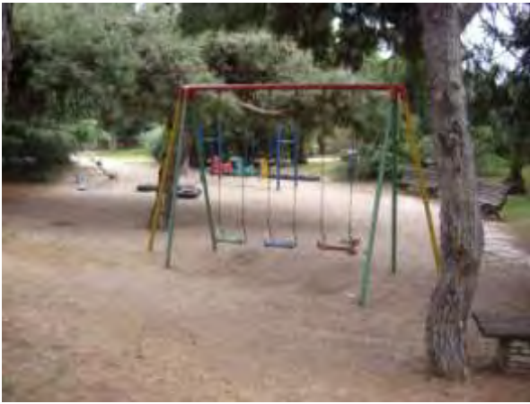
Υπαίθριος χώρος παιχνιδιού 6