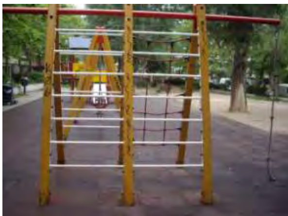
Υπαίθριος χώρος παιχνιδιού 1