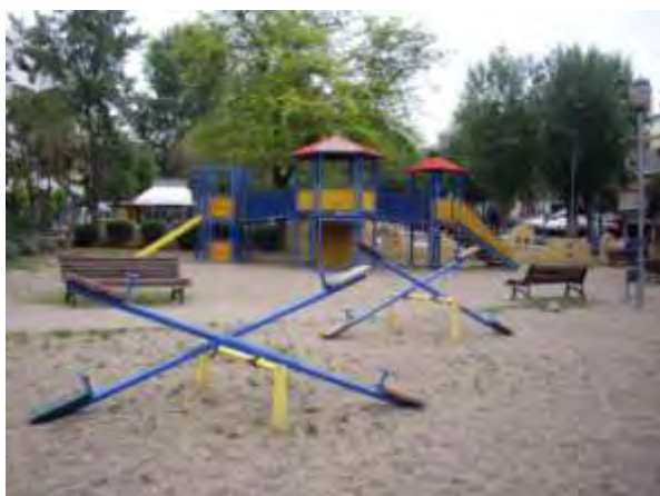
Υπαίθριος χώρος παιχνιδιού 4