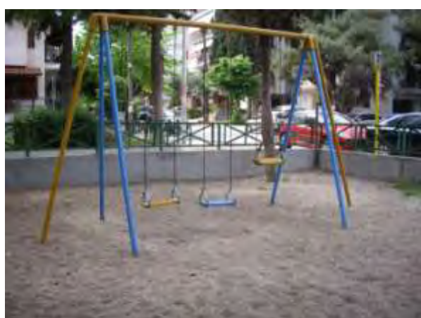
Υπαίθριος χώρος παιχνιδιού 9