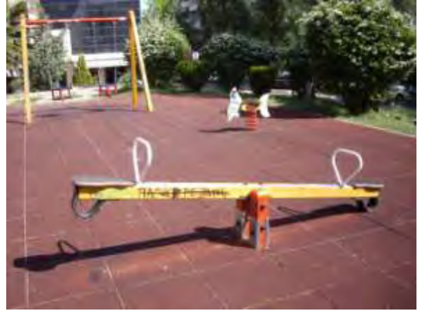
Υπαίθριος χώρος παιχνιδιού 12