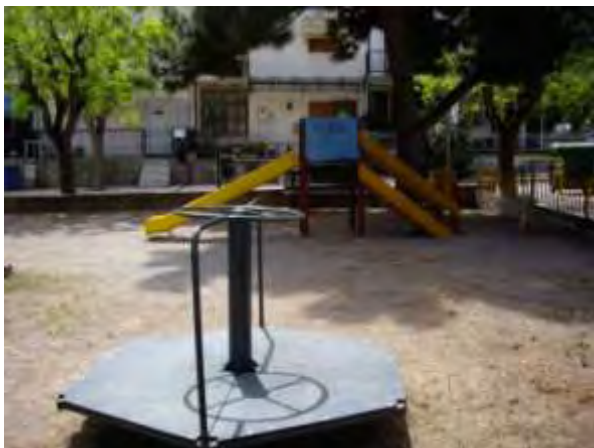
Υπαίθριος χώρος παιχνιδιού 11