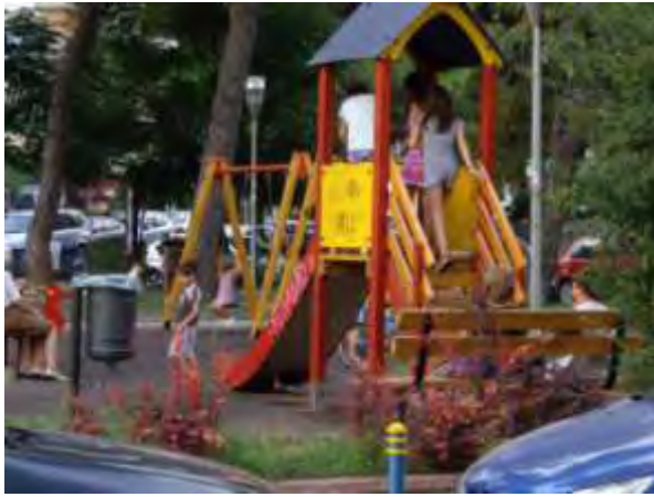
Υπαίθριος χώρος παιχνιδιού 13