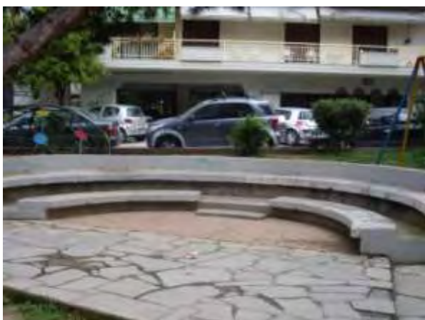
Υπαίθριος χώρος παιχνιδιού 2