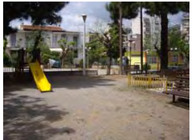
Υπαίθριος χώρος παιχνιδιού 11