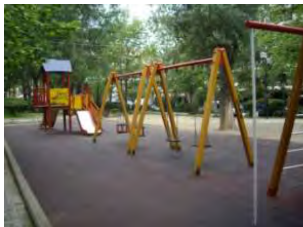
Υπαίθριος χώρος παιχνιδιού 1