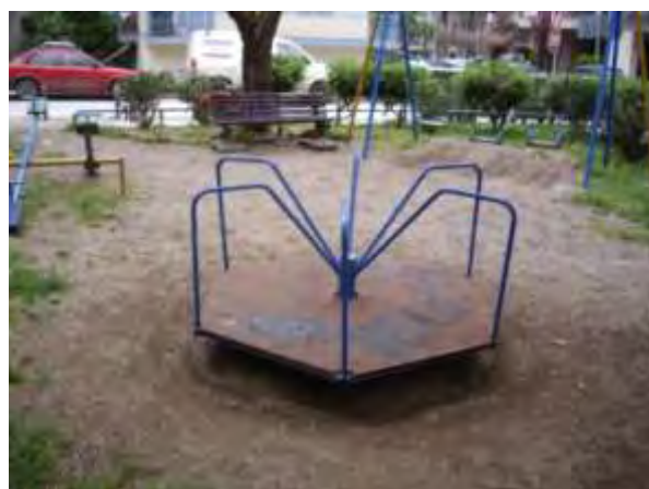
Υπαίθριος χώρος παιχνιδιού 3