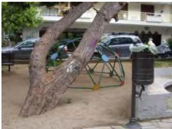
Υπαίθριος χώρος παιχνιδιού 2