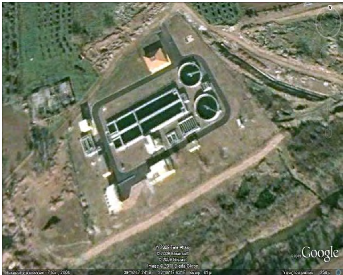
Εικόνα 1: ΕΕΛ Δήμου Αλμυρού