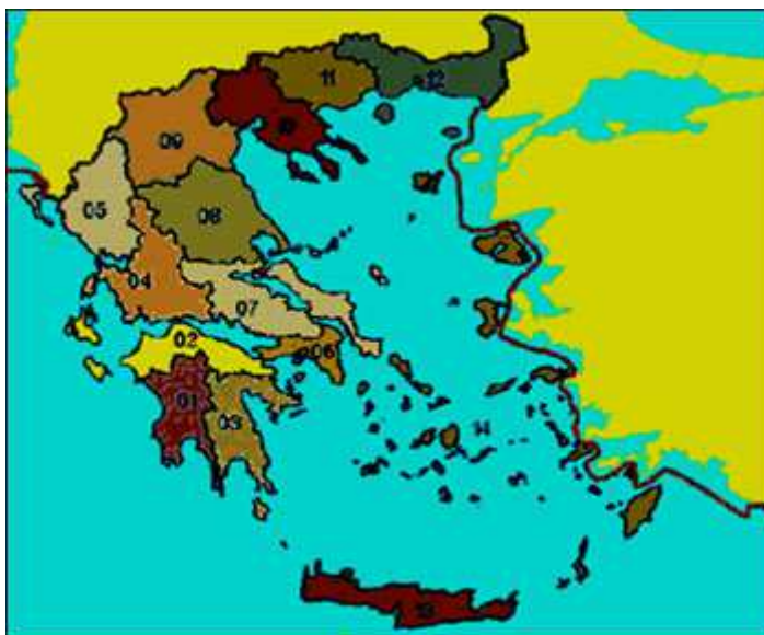
Χάρτης 1.1: Τα υδατικά διαμερίσματα της Ελλάδας

Α. Χωρίζεται η εθνική επικράτεια σε 14 υδατικά διαμερίσματα και προβλέπεται η δημιουργία αρχών διαχείρισης των υδατικών πόρων σε κάθε ένα από αυτά, τα οποία αποτελούν το χώρο εφαρμογής της διαχείρισης των υδατικών πόρων, με την σύσταση περιφερειακών υπηρεσιών διαχείρισης των πόρων αυτών. Το κάθε υδατικό διαμέρισμα αποτελείται από το σύνολο λεκανών απορροής με, όσο το δυνατόν, όμοιες υδρολογικές –υδρογεωλογικές συνθήκες. Τα "υδατικά διαμερίσματα" της Ελλάδας που έχουν καθοριστεί, είναι: 1) Δυτικής Πελοποννήσου, 2) Βόρειας Πελοποννήσου, 3) Ανατολικής Πελοποννήσου, 4) Δυτικής Στερεάς Ελλάδας, 5) Ηπείρου, 6) Αττικής, 7) Ανατολικής Στερεάς Ελλάδας, 8) Θεσσαλίας, 9) Δυτικής Μακεδονίας, 10) Κεντρικής Μακεδονίας, 11) Ανατολικής Μακεδονίας, 12) Θράκης, 13) Κρήτης και 14) Νήσων Αιγαίου.