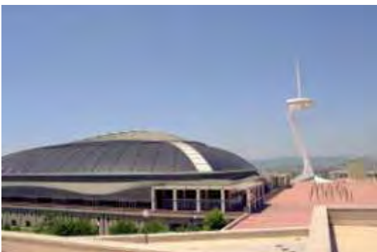
Εικόνα 10: Παλάτι Sant Jordi