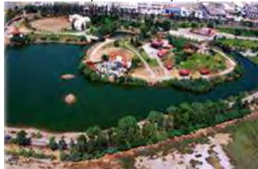
Εικόνα 29: Πάρκο Πεδίου Άρεως