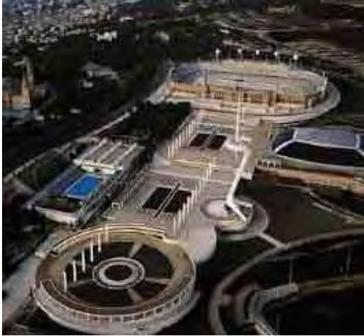
Εικόνα 8: Ολυμπιακός Δακτύλιος Montjuic