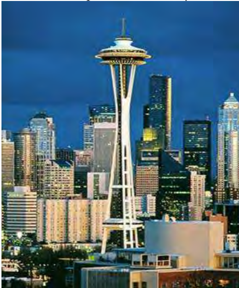
Εικόνα 3: Το Space Needle – Σιάτλ