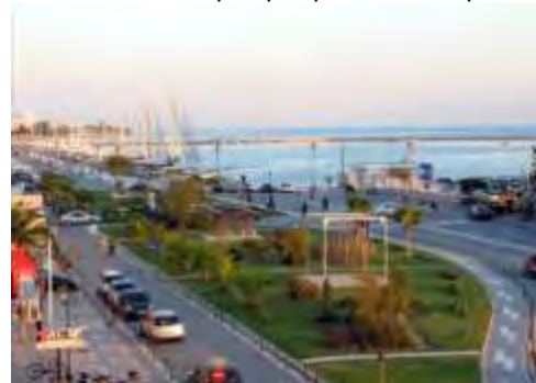
Εικόνα 27: Κεντρική παράκτια ζώνη