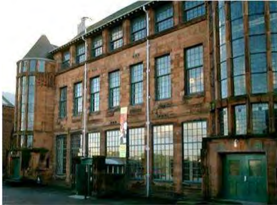
Εικόνα 25: To Scotland Street School