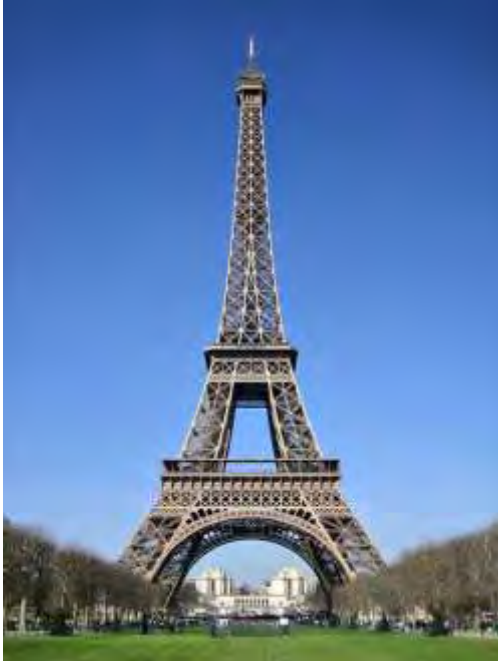
Εικόνα 1: Ο Πύργος του Άιφελ – Παρίσι