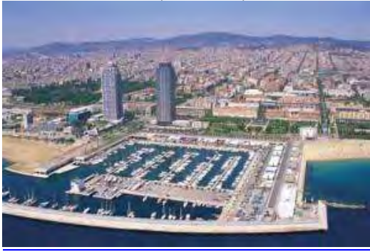
Εικόνα 12: Το Ολυμπιακό Λιμάνι