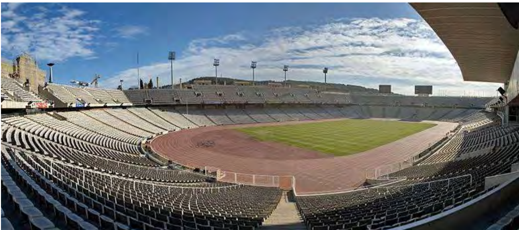
Εικόνα 9: Ολυμπιακό Στάδιο Montjuic