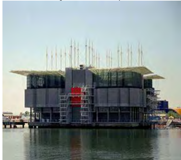
Εικόνα 4: Το Aquarium – Λισσαβόνα