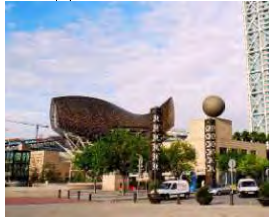
Εικόνα 15: Το Ολυμπιακό Χωριό – Γλυπτό ψάρι