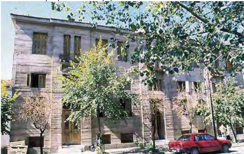
Εικόνα 32: Πρώην Καπναποθήκη Παπάντου

http://www.diki.gr/museum/EL/city/routes.asp?building=04&route=1