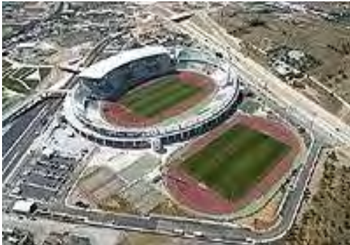
Εικόνα 26: Πανθεσσαλικό Στάδιο