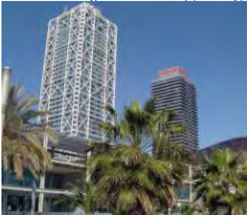
Εικόνα 14: Το Ολυμπιακό Χωριό – Ξενοδοχείο Arts και Πύργος Marfres