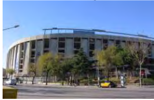
Εικόνα 13: Το Στάδιο Camp Nou