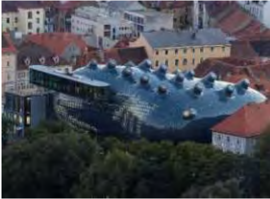
Εικόνα 5: Το Kunsthaus – Γκρατς