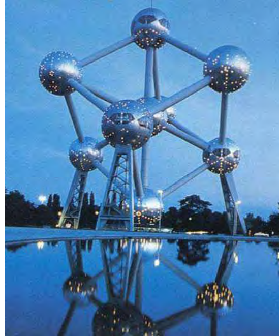
Εικόνα 2: Το Atomium – Βρυξέλλες