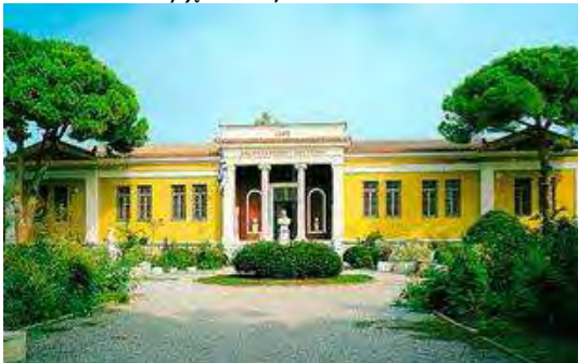
Εικόνα 28: Αρχαιολογικό Μουσείο