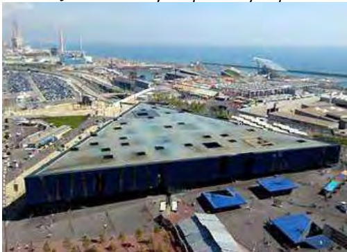
Εικόνες 16-17: Παγκόσμιο Φόρουμ των Πολιτισμών – 2004