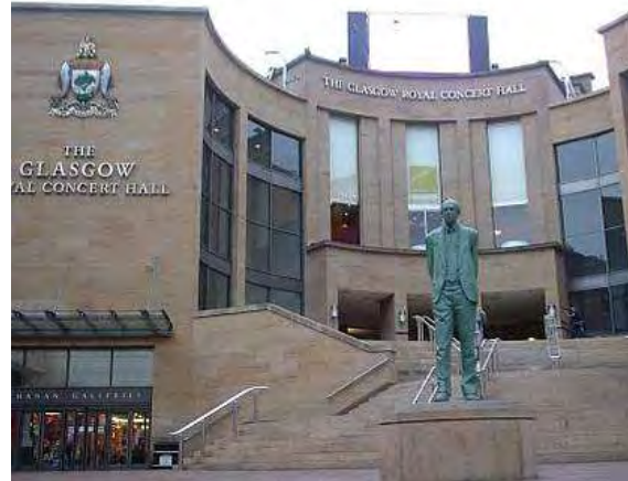
Εικόνα 24: Η Βασιλική Αίθουσα Συναντιών