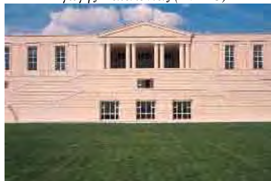
Εικόνα 11: Το Εθνικό Ινστιτούτο Φυσικής Αγωγής Καταλονίας (INEFC)