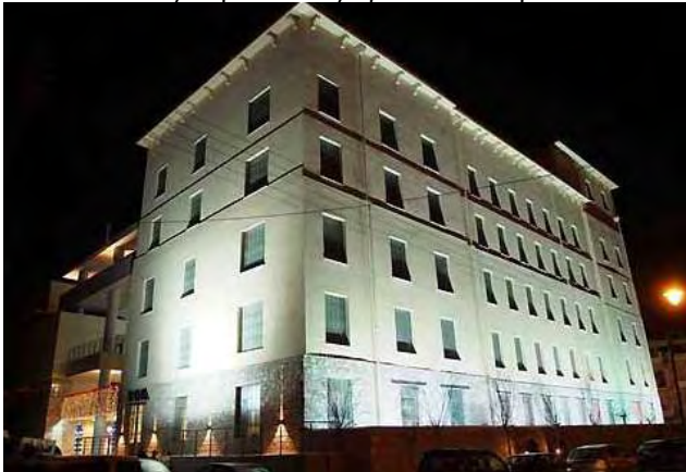
Εικόνα 31: Πρώην Κυλινδρόμυλοι Λούλη

http://www.diki.gr/museum/EL/city/routes.asp?building=02&route=1