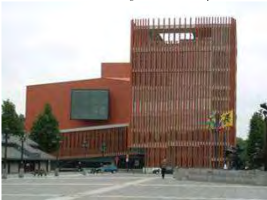
Εικόνα 7: Το Concertgebouw – Μπριζ