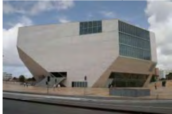
Εικόνα 6: Το Casa da Música – Πόρτο