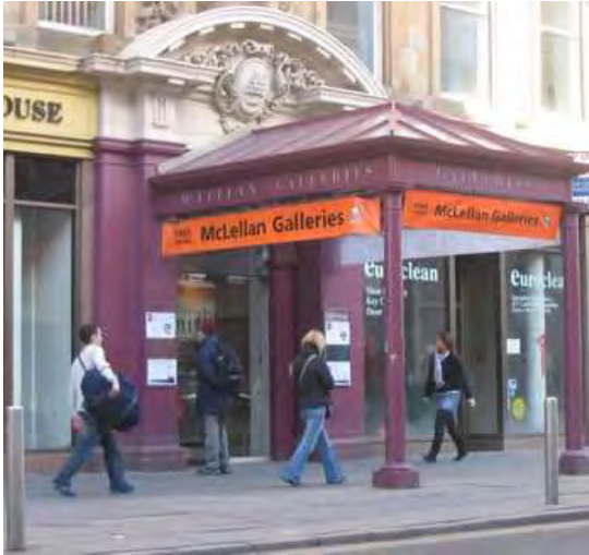
Εικόνα 23: Οι Στοές McLellan