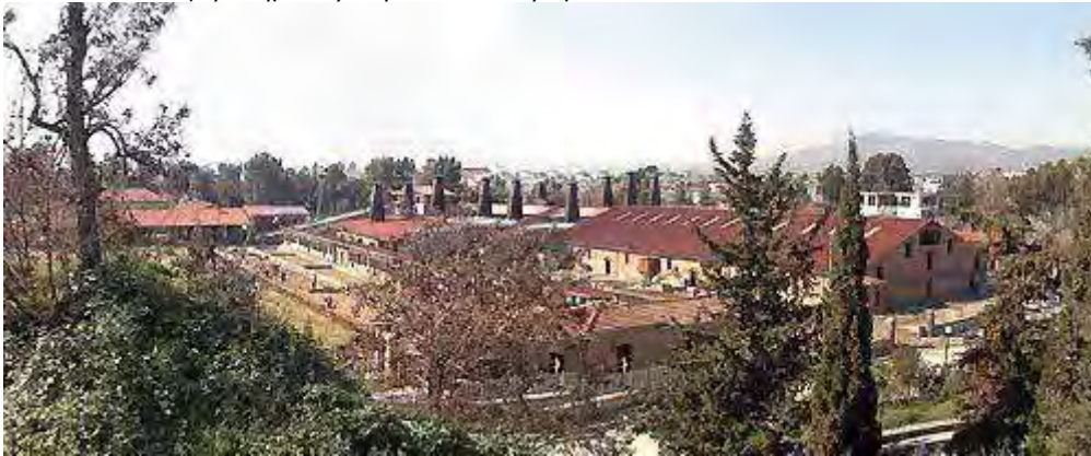
Εικόνα 30: Συγκρότημα Πρώην Πλινθοκεραμοποιείου Τσαλαπάτα

http://www.diki.gr/museum/EL/city/routes.asp?building=01&route=1