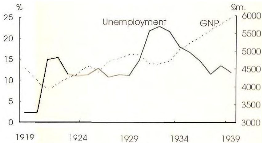
Εικόνα 1: Εθνικό Εισόδημα και Ανεργία στην Αγγλία, 1919-1939