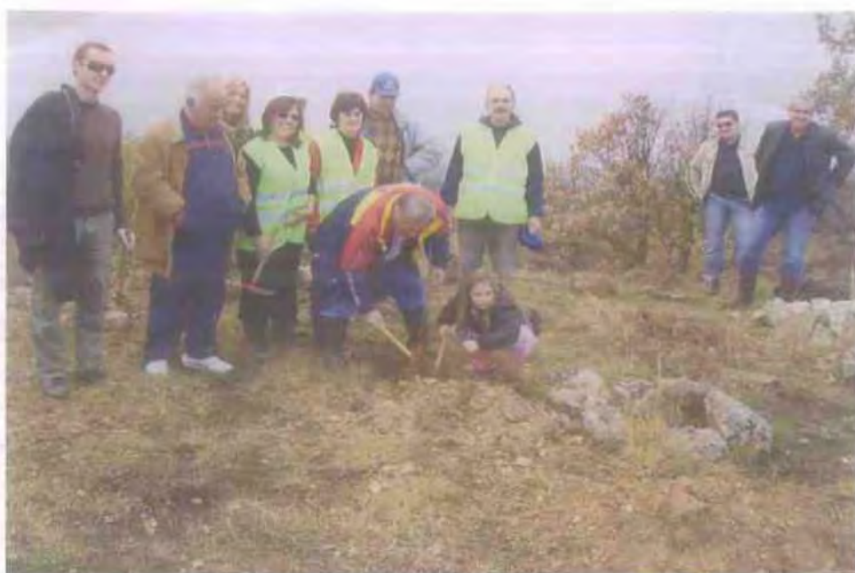
10. Αναδάσωση που πραγματοποίησε ο Σύλλογος Εθελοντών Περιβάλλοντος και Πρασίνου.