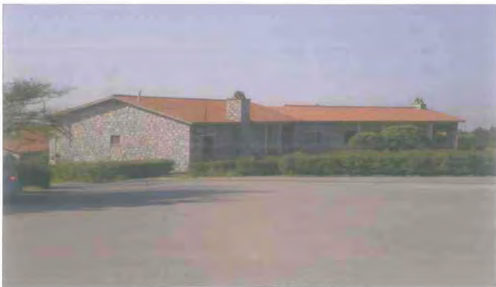
7. Τα κτίρια όπου στεγάζονται σήμερα ο Παιδικός Σταθμός της Δημοτικής Επιχείρησης και το ΚΔΑΠ.