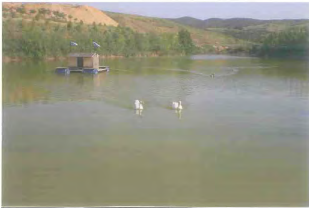
15. Η Τεχνητή Λίμνη Ωραιοκάστρου στην περιοχή Καλόγερος (φωτο. από την ιστοσελίδα του Δήμου Ωραιοκάστρου).