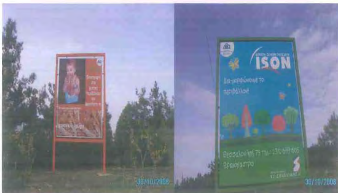
11. Ο θεσμός της υιοθεσίας των πάρκων (φωτο. από την ιστοσελίδα του Δήμου Ωραιοκάστρου).