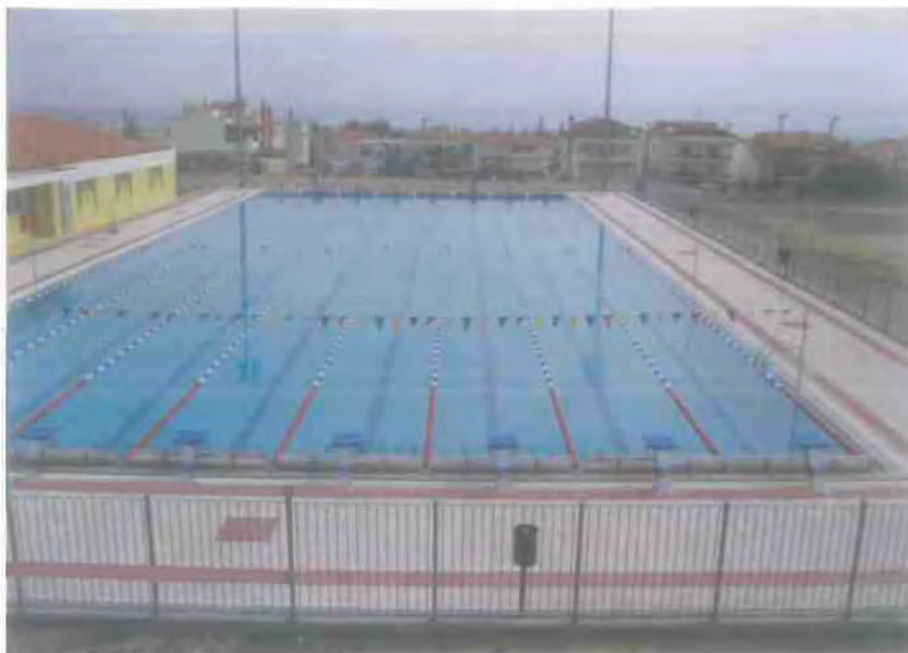
8. Το Κολυμβητήριο του Δήμου Ωραιοκάστρου.