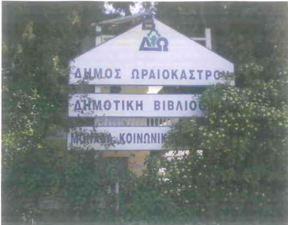
14. Τα κτίρια όπου στεγάζονται η Μονάδα Κοινωνικής Μέριμνας και η Δημοτική Βιβλιοθήκη Ωραιοκάστρου (φωτο. από την ιστοσελίδα του Δήμου Ωραιοκάστρου).