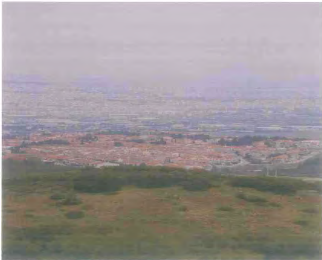
4. Πανοραμική άποψη του Ωραιοκάστρου.

3. Απεικονίζονται οι απογραφές που έχουν πραγματοποιηθεί στον Δήμο Ωραιοκάστρου. Σύμφωνα με εκτιμήσεις ο πραγματικός αριθμός των κατοίκων του Δήμου Ωραιοκάστρου σήμερα ξεπερνά τους 35.000 κατοίκους (γράφημα από την ιστοσελίδα του Δήμου Ωραιοκάστρου).