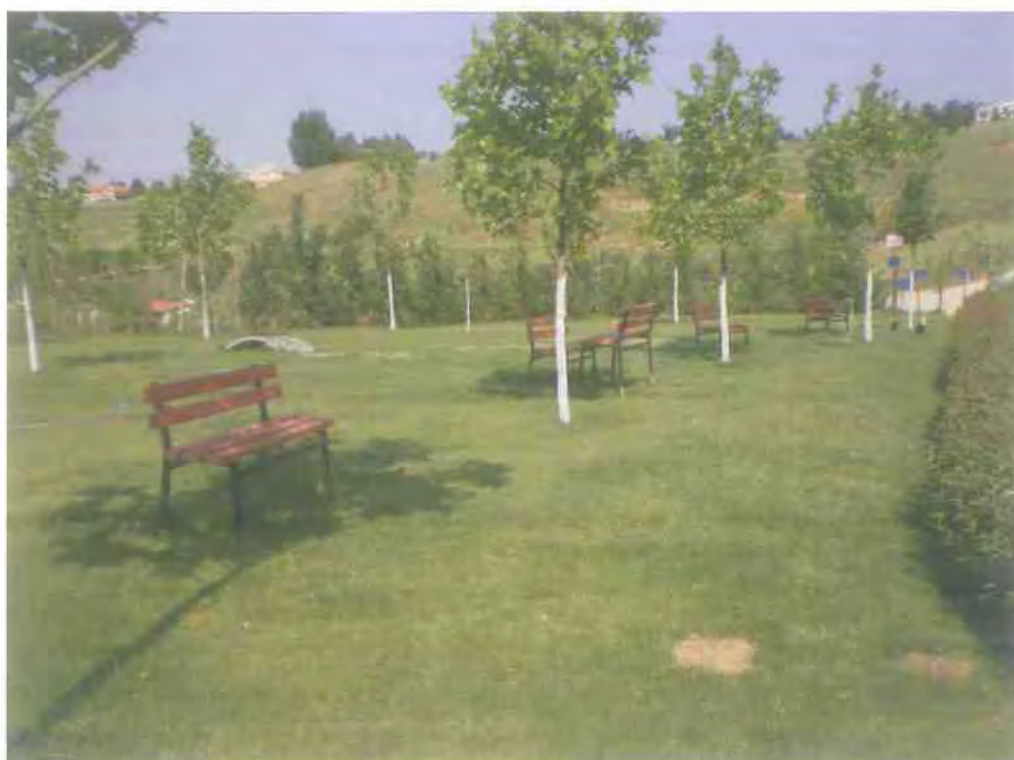
13. Ένα από τα πάρκα που αναδεικνύει η Δημοτική Επιχείρηση.