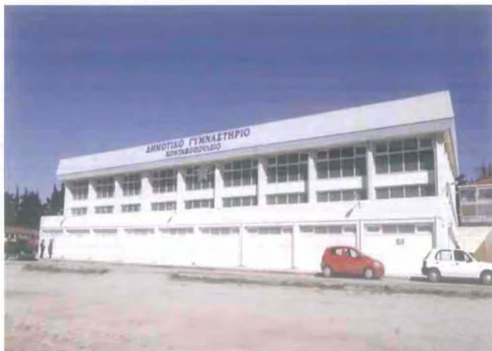
9. Το «ΚΟΝΤΑΞΟΠΟΥΛΕΙΟ» Δημοτικό Γυμναστήριο Ωραιοκάστρου.