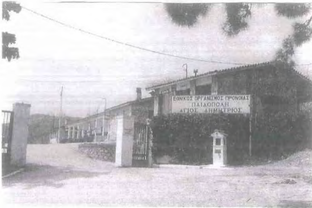
6. Είσοδος των εγκαταστάσεων, όπου στεγάζονται ο Παιδικός Σταθμός της Δημοτικής Επιχείρησης και το ΚΔΑΠ, όπως ήταν παλαιότερα