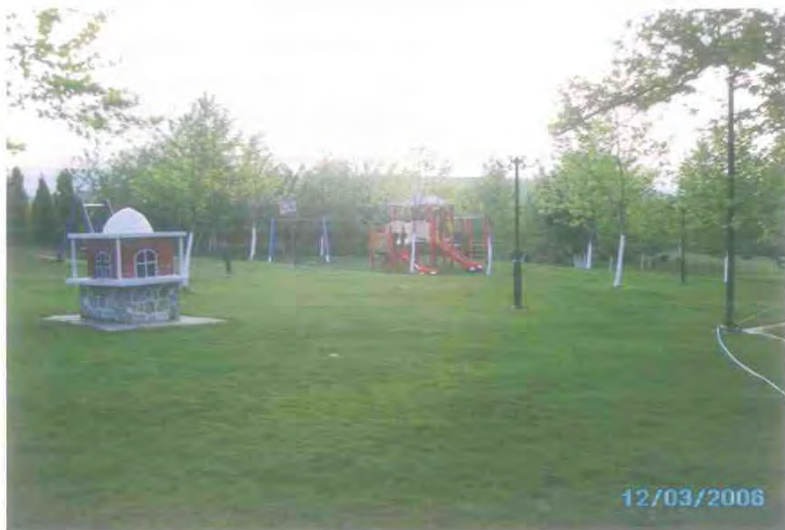
12. Η ανάδειξη πάρκων και πρασίνου είναι στους σκοπούς της Δημοτικής Επιχείρησης Ωραιοκάστρου.