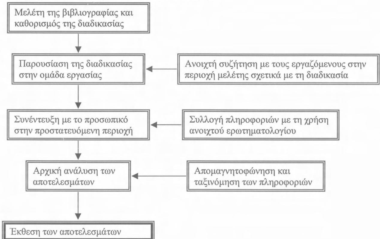
Διάγραμμα 2: Μεθοδολογικό πλαίσιο που ακολουθήθηκε

Εξαιτίας της συγκεκριμένης φύσης του προβλήματος, δηλαδή για να μπορέσει να γίνει μια εις βάθος αποτίμηση των παραγόντων εκείνων που συμβάλλουν στην αποτελεσματική διαχείριση μιας προστατευόμενης περιοχής, στη συγκεκριμένη περίπτωση η Πάρνηθα, απαιτείται βαθιά γνώση με το προς μελέτη αντικείμενο. Η γνώση αυτή στην συγκεκριμένη περίπτωση αποκτήθηκε, με τη επίσκεψη στην περιοχή μελέτης και μέσω κατ' ιδίαν συζητήσεων με τη χρήση ανοιχτού ερωτηματολογίου με το προσωπικό του Δασαρχείου.