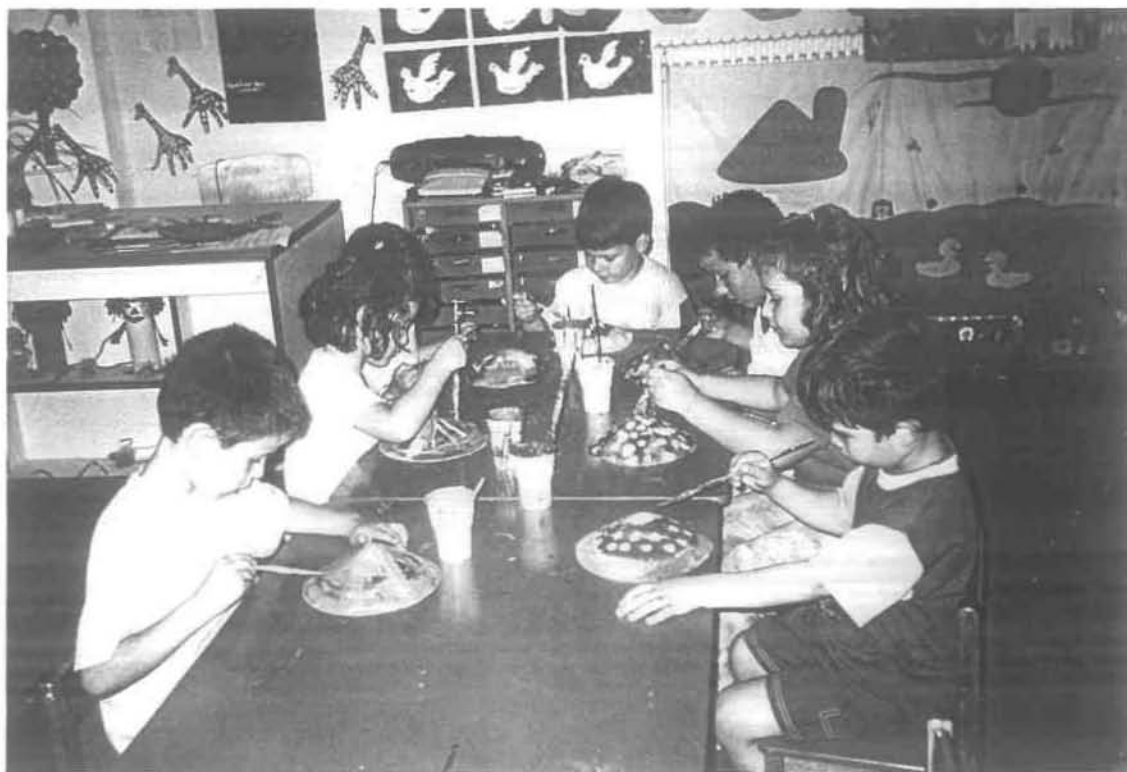
Ημέρα Πρώτη: 3 η οργανωμένη δραστηριότητα «Τα κινέζικα καπέλα»