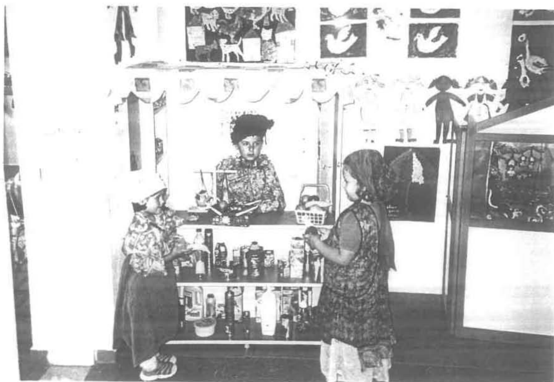
Ημέρα Δεύτερη :2 η οργανωμένη δραστηριότητα «Διαδρομή στις Ινδίες»