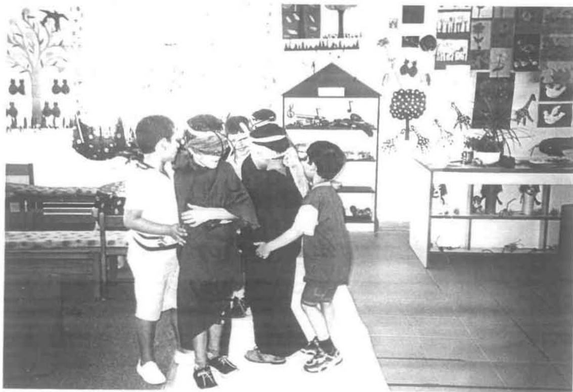
Ημέρα Δεύτερη: 1 η οργανωμένη δραστηριότητα «Οι Εσκιμώοι με τους Ταράνδους»