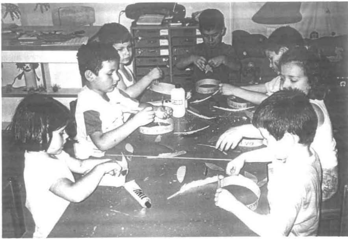
Ημέρα Τρίτη: 1 η οργανωμένη δραστηριότητα «Ινδιάνικα καπέλα»