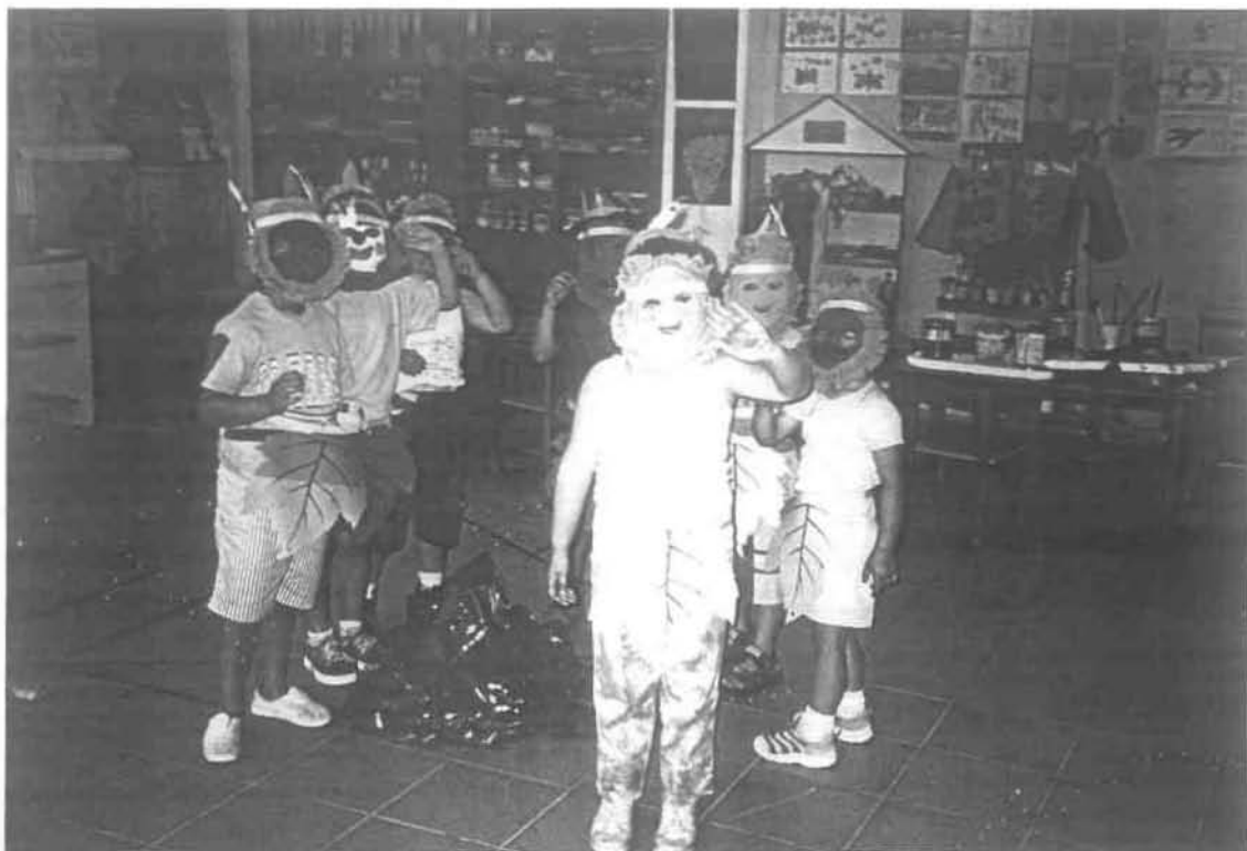
Ημέρα Τρίτη: 2 η οργανωμένη δραστηριότητα «Ο χορός της Φωτιάς»