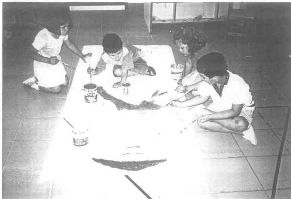
Ημέρα Τέταρτη: 1 η οργανωμένη δραστηριότητα «Χάρτινες κούκλες»