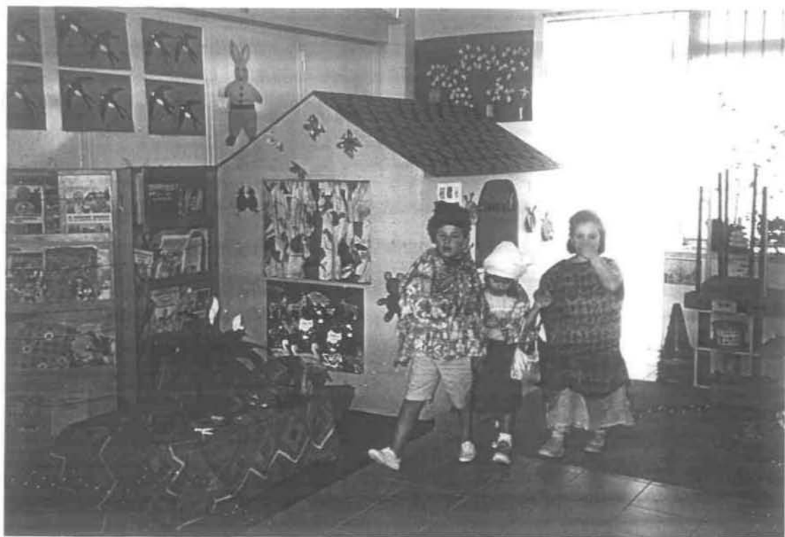
Ημέρα Δεύτερη :2 η οργανωμένη δραστηριότητα «Διαδρομή στις Ινδίες»