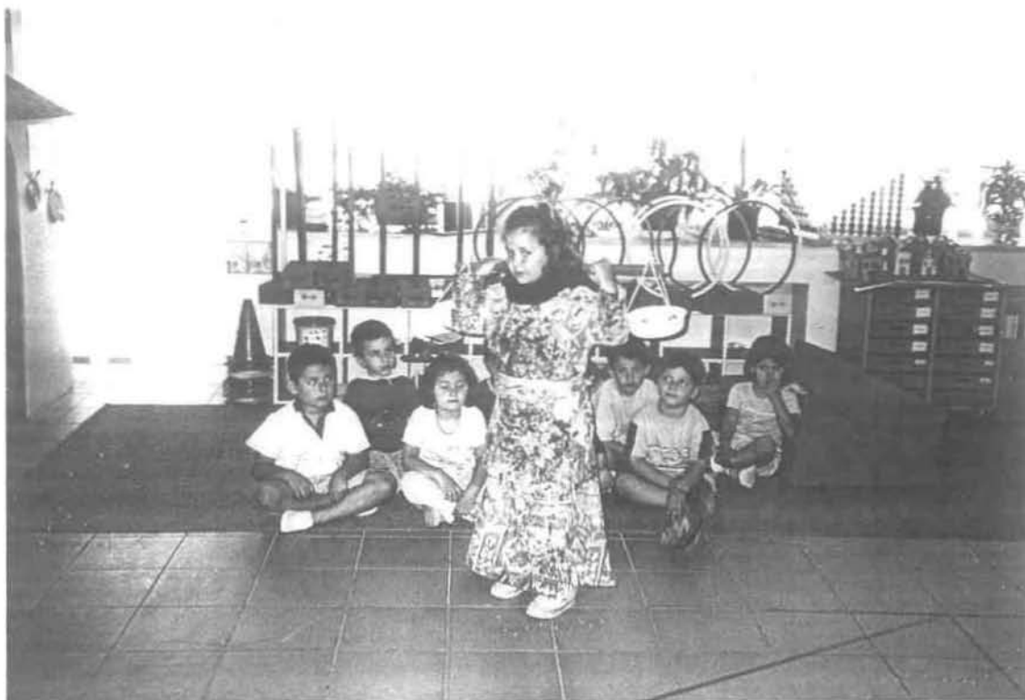
Ημέρα Πρώτη: 2 η οργανωμένη δραστηριότητα «Το κουβάλημα του νερού»