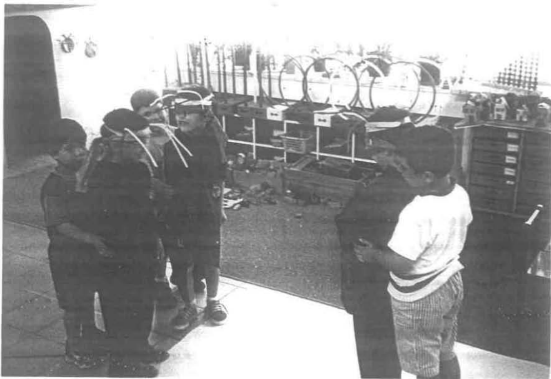
Ημέρα Δεύτερη: 1 η οργανωμένη δραστηριότητα «Οι Εσκιμώοι με τους Ταράνδους»