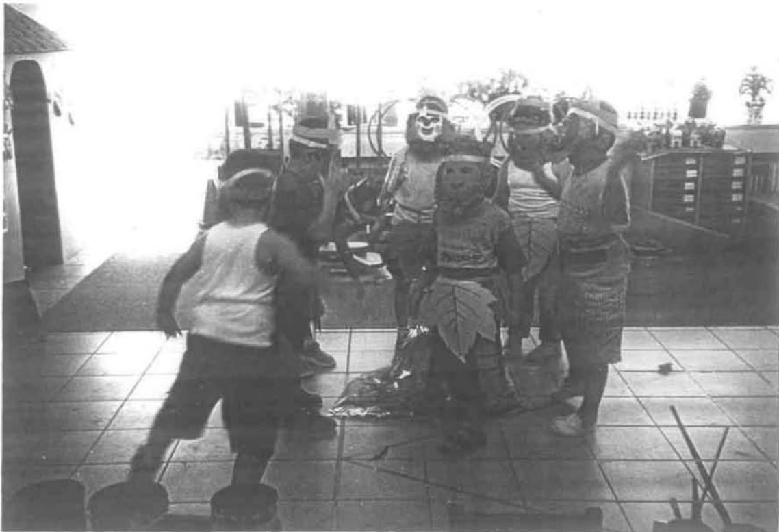
Ημέρα Τρίτη: 2 η οργανωμένη δραστηριότητα «Ο χορός της Φωτιάς»