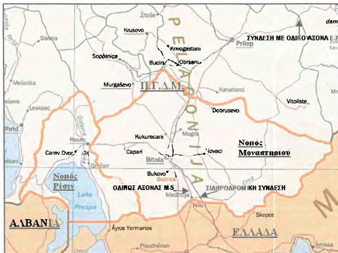
Χάρτης 4.1: Η περιοχή των νομών Μοναστηριού και Ρέσεν.