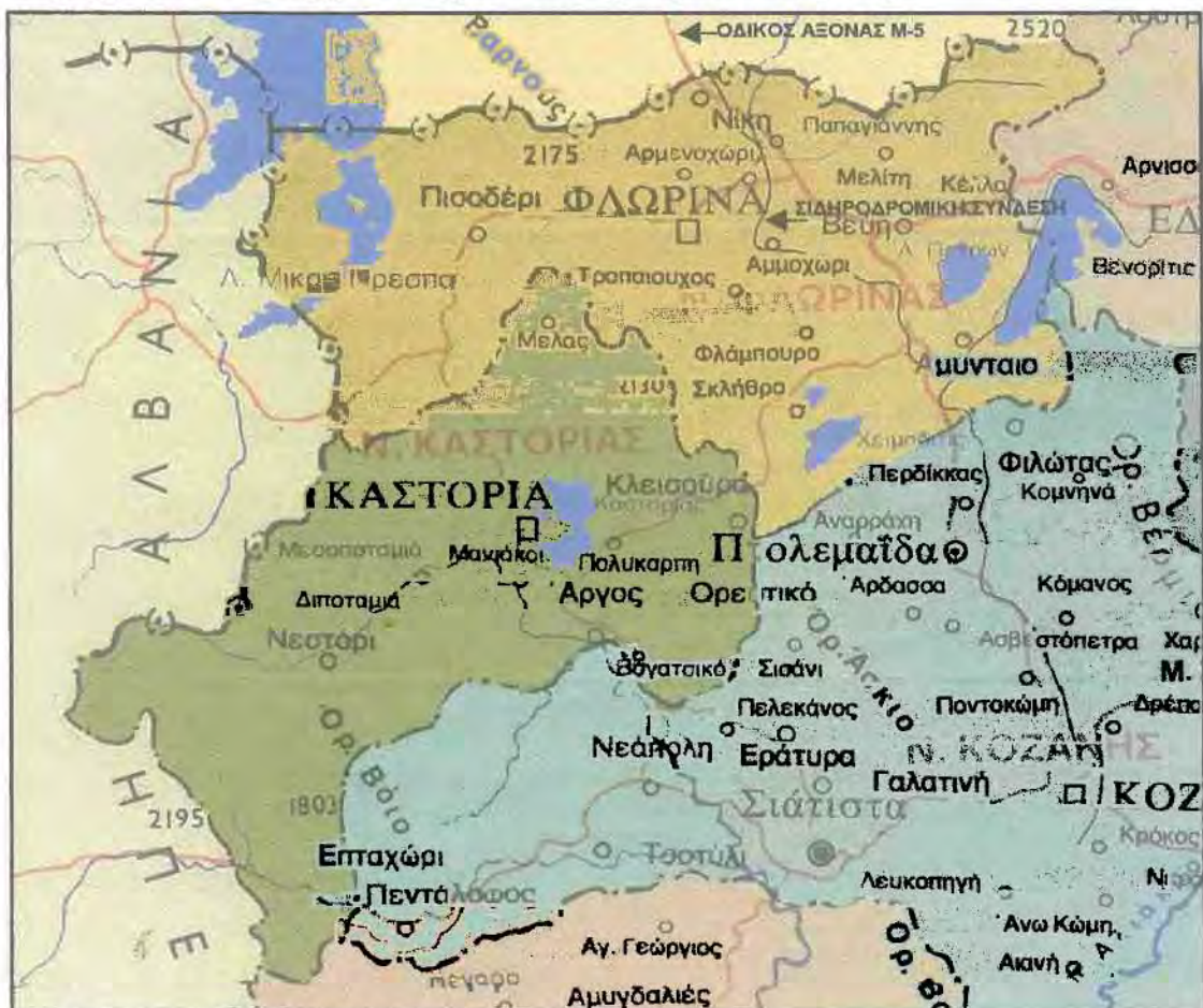
Χάρτης 3.1: Η περιοχή των νομών Καστοριάς και Φλώρινας.