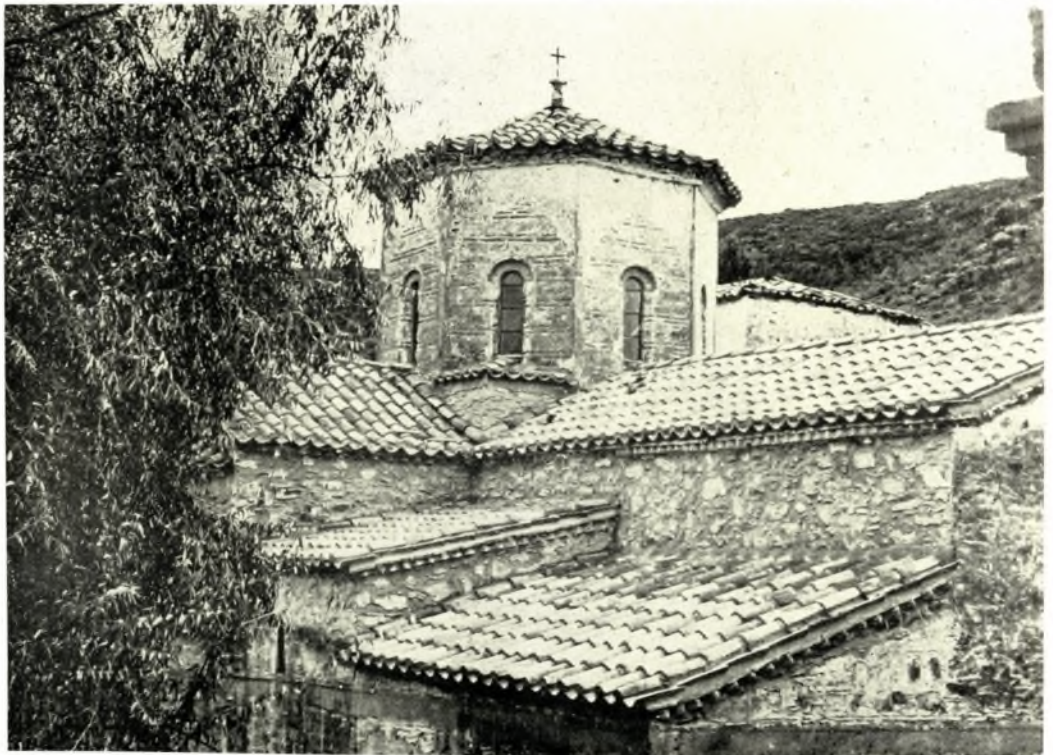
Λακωνία. Γ. Μονή Ἁγίων Τεσσαράκοντα ἐν Λακεδαίμονι: α - β. Ἡ στέγη τοῦ ναοῦ κατὰ καὶ μετὰ τὰς στερεωτικὰς ἐργασίας Ν. ΔΡΑΝΔΑΚΗΣ