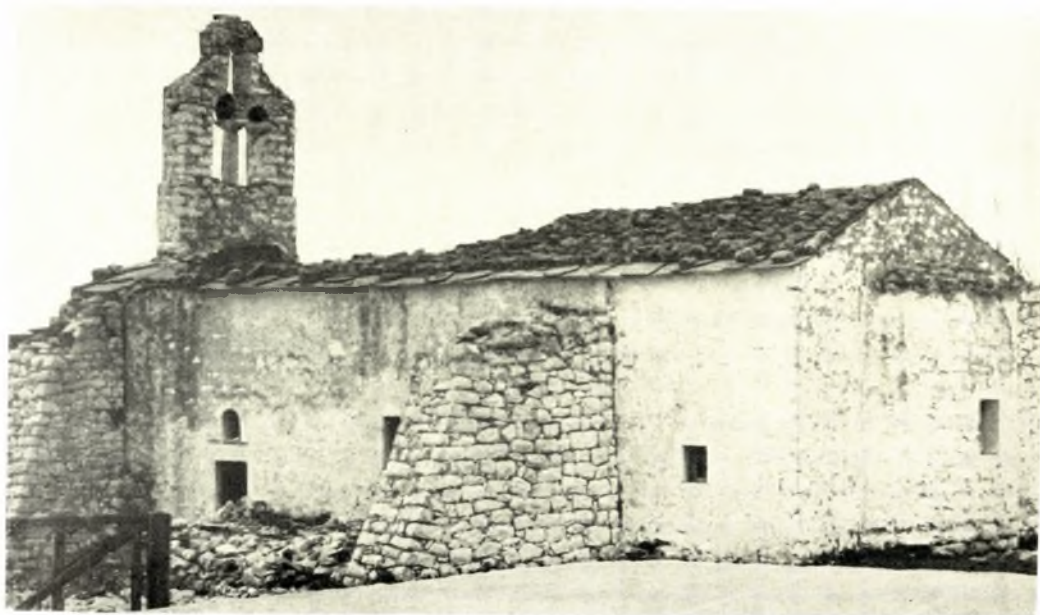
Λακωνία: α. Χρύσαφα. Ναός Ἁγ. Ἰωάννου. Α. πλευρά, κατά τήν διάρκειαν τῆς στερεώσεως, β. Ἀρεόπολις. Ναός Ἁγ. Ἰωάννου πρό τῶν ἐργασιῶν στερεώσεως