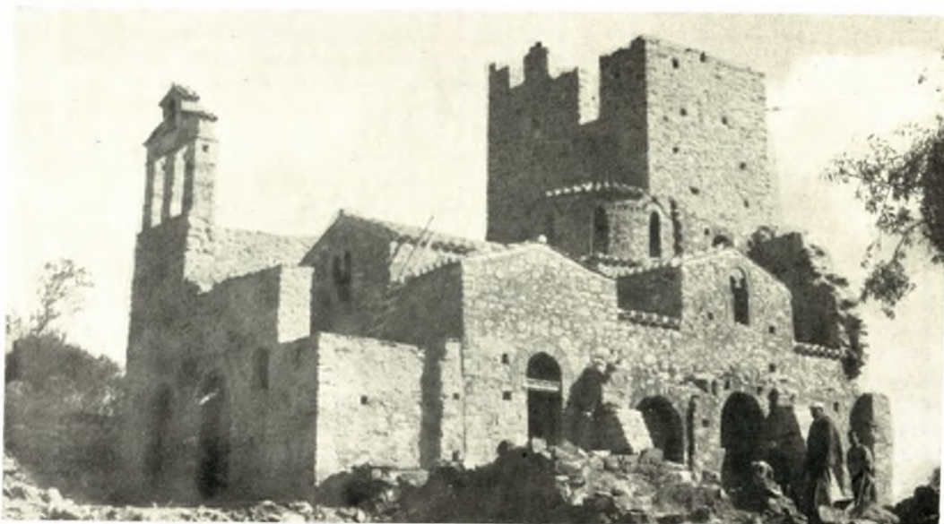
Λακωνία. Ναός της Χρυσοφιτίσης: α - β. 'Η Α. πλευρά τοῦ πύργου καὶ ὁ ναὸς μετὰ τὴν στερέωσιν