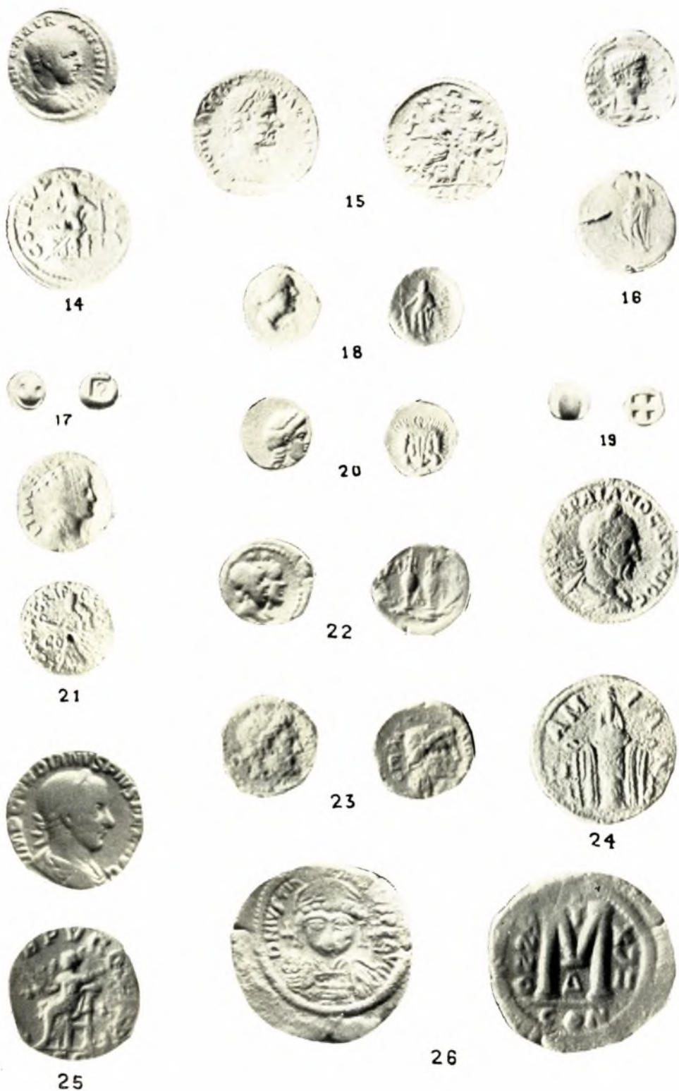
Ἐθνικὸν Ἀρχαιολογικὸν Μουσεῖον. Νομισματικὴ Συλλογὴ