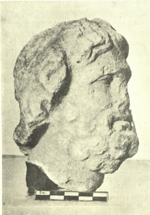
Εἰκ. 4. Μαρμαρίνη κεφαλὴ Πλούτωνος-Ἄσίδος.

πόδες πτηνῶν καὶ λεόντων συμφυεῖς μετὰ πωρίνων ἰωνικῶν κιονοκράνων, ἐφ' ὧν ἐπεκάθητο (εἰκ. 3, 1 καὶ 3). Ἐν ἄλλο πτηνόν, πιθανώτατα ἀετός, ἔλλιπες τὴν κεφαλὴν, σύγκειται ἐκ χονδροκόκκου νησιωτικοῦ μαρμάρου. Ἐκ τοῦ αὐτοῦ ὕλικου εἶναι μικρά, καλῶς διατηρουμένη μαρμαρίνη κεφαλὴ,