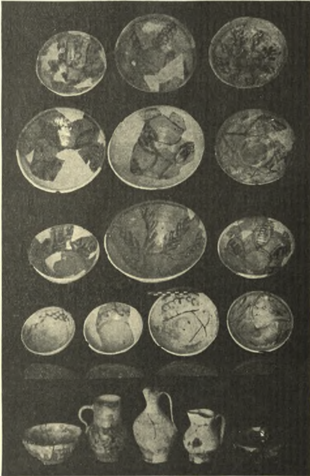
Εἰκ. 11. Ἀγγεῖα Ἐνετικῆς ἐποχῆς ἐξ Ἀμνισοῦ (στιλπνὴ τεχνικὴ διὰ μολυβδώσεως τοῦ 17 ου αἰῶνος).

ὑπῆρξεν ἡ εὐρεσις πρωτομινωικοῦ ἑνταφιασμοῦ μετὰ τινων ἀρχαιοτήτων καὶ δύο ἀξιολόγων στιλβωτῶν ἐρυθροπῶν ἀγγείων τῆς κατηγορίας Πύργου. Τὴν ΜΜ ἐποχὴν ἀντιπροσωπεύει οὐ μόνον ὁ μνημονευθεὶς ἀποθέτης τῆς δυτικῆς πλευρᾶς, ἀλλὰ καὶ τρεῖς μικραὶ πρόχοι εὐρεθεῖσαι ἐπὶ τῆς κορυφῆς τοῦ βράχου.