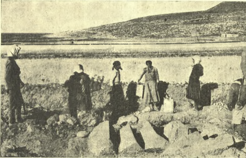
Εἰκ. 4. Ἡ καταπεσοῦσα κλίμαξ τοῦ ἄνω πατώματος κατὰ χώραν, ὡς εὐρέθη, ὀρωμένη ἐκ Δυσμῶν.

Τὸ ἀποκαλυφθὲν οἰκοδόμημα (εἰκ. 3) καταλαμβάνει τετράγωνον περι-