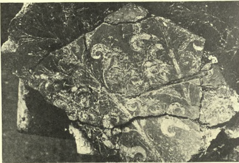
Εἰκ. 8. Μέρος τῆς τοιχογραφίας τῶν ἐμπιέστων κρίνων.

Τὰ εὐρεθέντα τεμάχια θὰ καταστῆ ἴσως δυνατὸν νὰ ἀποδώσωσιν ὀλόκληρον τὴν σύνθεσιν τοῦ τοιχογραφημένου δωματίου, διότι ἐν συνόλῳ ἀποτελοῦσιν ἐπιφάνειαν πλείονων τετραγωνικῶν μέτρων. Μόνον τὸ τεμάχιον τῶν