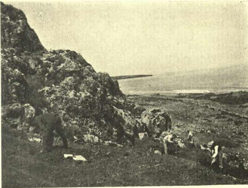
Εἰκ. 1. Ἀποψὶς τοῦ Ἀμνισοῦ. Ἀριστερὰ ὁ βράχος τῆς Παληοχώρας.

ἀρχαῖων ἀποτόμων ἐν μέσῳ τῆς ἄμμου, λέγεται Παληοχώρα (εἰκ. 1). Αἱ μαρτυρίαι περὶ Ἀμνισοῦ εἶναι ὀλίγαι καὶ ἐν μέρει συγκεχυμένα. Ἡ παλαιότητα καὶ σπουδαιότητα εἶναι ἢ τῆς Ὀδυσσεΐας (19,188), ὅπου ἀναφέρεται τὸ μέρος ὡς «λιμένες χαλεποὶ» καὶ μνημονεύεται τὸ σπήλαιον τῆς Εἰλειθυΐας. Ἀνάξια λόγου εἶναι μαρτυρία ὡς τοῦ Διδύμου «Ἀμνισός, πόλις καὶ ποταμὸς Κρήτης» ἔτι δὲ πεπλανημένη ἢ ἀπόδοσις νομισμάτων τινῶν εἰς πόλιν Ἀμνισόν, ὥστε παραμένει ἀβέβαιον καὶ μάλιστα ἀπίθανον, ὅτι ἐν τῇ ἑλληνικῇ