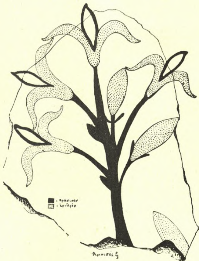
Εἰκ. 8α. Ἰχνογράφημα ἑνὸς τῶν τεμαχίων τῆς εἰκόνας 8.

ἐγνωρίζομεν μέχρι τοῦδε ἐκ μόνης τῆς ἐπιδράσεώς της ἐπὶ τὴν ἀγγειογραφίαν. Ἐπὶ παραδείγματι δὲν ὑπάρχει ἡ παραμικρὰ ἀμφιβολία, ὅτι οἱ ἐμπέστοι κρίνοι εἶναι τὸ πρωτότυπον τῶν περιφήμων «ἀγγείων μὲ τὰ κρίνα» τῆς Κνωσοῦ, ἀνηκόντων εἰς τὴν ΜΜ 3 ἔτι ἐποχὴν. Ὅμοίως πλεῖστα ἄλλα ἀγγεῖα τῆς ΥΜ Ια ἐποχῆς τοῦ ρυθμοῦ τῆς γλωρίδος ἠρύσθησαν τὰ θέματά των ἐξ