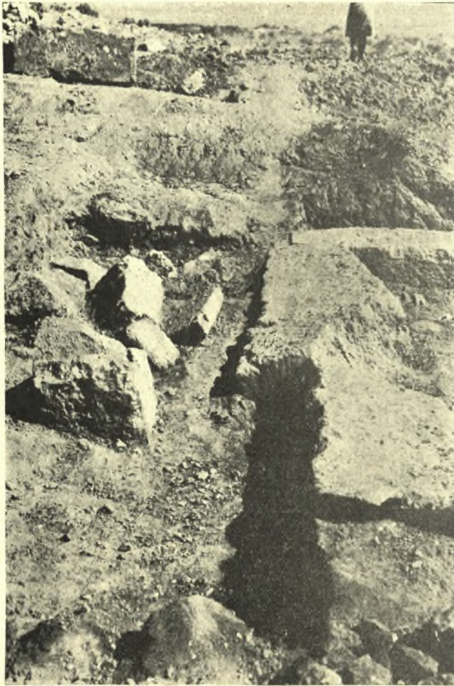
Εἰκ. 10. Πτώσις λίθων πρὸς τὰ ἔξω καὶ περιέργως μετακίνησις δύο ὀρθοστατικῶν ὀγκολίθων τῆς ἐπαύλεως ὧν ὁ εἷς ἔχει μῆκος 2 μέτρων, (ἀποτέλεσμα σεισμοῦ;)

τελέσματα. Ἡ πρὸς δυσμὰς τῆς Παληοχώρας ἔκτασις παρουσιάζει διάφορα λείψανα κτισμάτων, ὧν τινὰ ἐντὸς τῆς ἄμμου πιθανόν νὰ εἶναι ἕχνη λιμενικῶν ἐγκαταστάσεων ἀναλόγων πρὸς τὰς τῶν 5 χιλιομ. ἀνατολικώτερον κειμένων Ἀγίων Θεοδώρων. (Πρακτικά τῆς Ἀρχ. Ἑταιρ. 1925 - 6 141 ἔξ., 1929