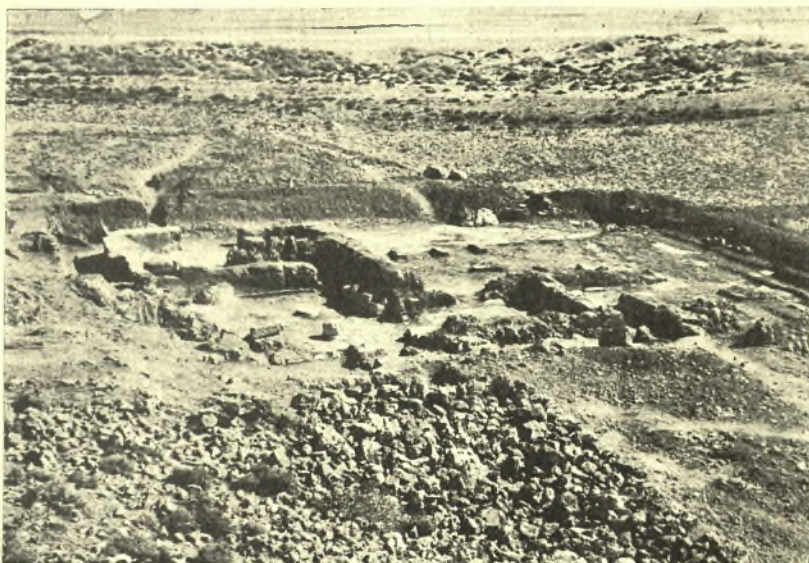
Εἰκ. 2. Ἐποψὶς τῆς ἀνεσκαμμένης ἐπαύλεως.

μέτρον δεξιότερον ἢ ἀριστερώτερον δὲν ἤθελε προέλθει τι ἀξιόλογον εἰς φῶς καὶ ἠθέλομεν ἐγκαταλείψει τὸ μέρος. Εὐτυχῶς ἐπέσαμεν ἀκριβῶς ἐπὶ τοῦ πυρῆνος τῶν τοιχογραφιῶν, αἵτινες ἐπρόκειτο νὰ προσδώσουν εἰς τὴν ἀνασκαφὴν ἀσυνήθη σπουδαιότητα. Ἦδη μετὰ μίαν ὥραν ἀπὸ τῆς ἐνάρξεως τῆς ἐργασίας προσεῖλκυσε τὴν προσοχήν μου τὸ ἐξαγόμενον καφεόχρουν καθαρὸν χῶμα τῶν διαλελυμένων πλίνθων. Δὲν εἶχεν ἔτι παρῆλθει ἡ δευτέρα ὥρα, καὶ προσεκρούσαμεν ἐπὶ σωροῦ ἀκανονίστου μεγάλων λίθων, τοὺς ὁποίους οἱ