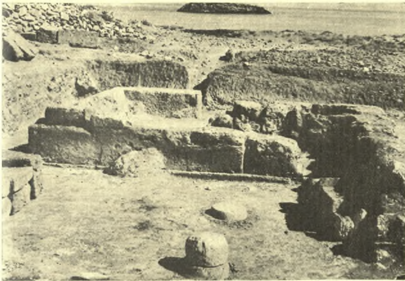
Εἰκ. 7. Ὁ χώρος, ὅπου εὐρέθησαν αἱ τοιχογραφίαι.

Ἐπιβεβαιωτέρα περιγραφή τῶν τοιχογραφιῶν δὲν εἶναι δυνατὴ πρὸ τοῦ ἐντελοῦς καθαρισμοῦ καὶ σχετικῆς ἐπ' αὐτῶν μελέτης. Ἀνήκουσι πᾶσαι