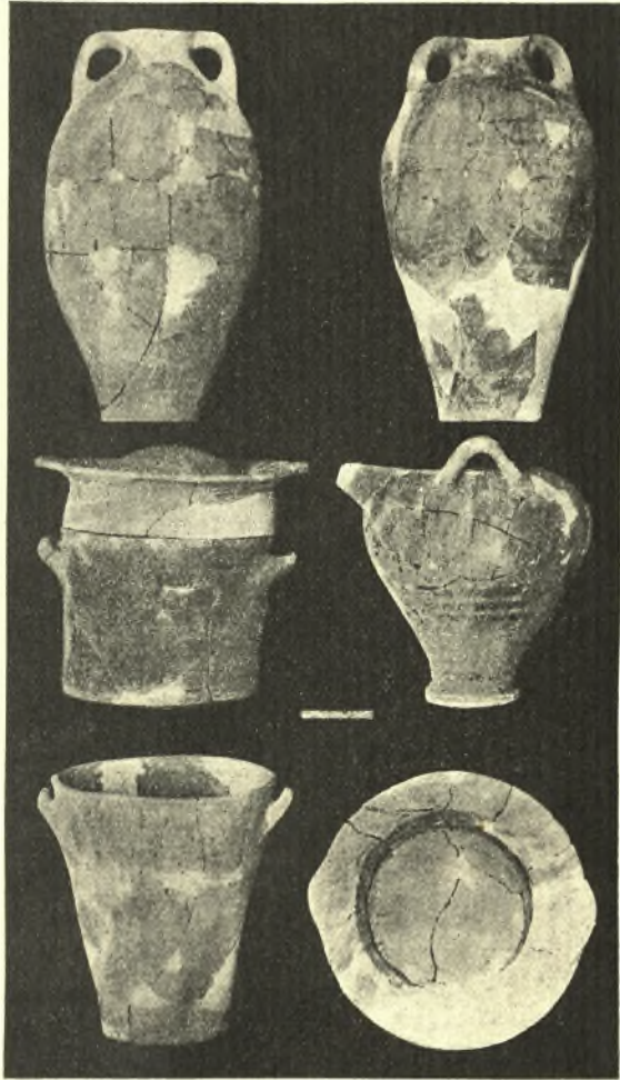
Εἰκ. 5. Ἀγγεῖα ἐκ τῆς ἐπαύλεως.

Εὐρήματα. Τοιοῦτον ἀξιόλογον ἀρχιτεκτόνημα εἶναι περιέργον ὅτι εἰς κινητὰ εὐρήματα σχεδὸν οὐδὲν ἀπολύτως παρουσίασε. Πολύτιμα πράγματα βεβαίως δὲν εἶναι κοινά, ἐν Κρήτῃ δὲ μάλιστα οὐδόλως ἀφθονοῦσιν. Ἐν τούτοις εἶναι παραδόξον, ὅτι δὲν εὐρέθησαν τουλάχιστον