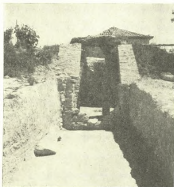
Εἰκ. 8. Δρόμος θολωτοῦ τάφου.

πληροῦσα αὐτὸν ἐπίχωσις ἐν τομῇ, καὶ οὕτω κατωρθώθη εὐκολώτερον νὰ διαπιστωθῇ, ὅτι ἀπετελεῖτο αὕτη ἐκ τεσσάρων διαδοχικῶν δαπέδων σημειουμένων διὰ λεπτοῦ στρώματος ἀνθρακιᾶς, ἀποδεικνυομένου διὰ τούτου, ὅτι μετὰ τὴν πρώτην ταφὴν καὶ ἐπίχωσιν τοῦ δρόμου, ἠνοίχθη καὶ ἐπανεπληρώθη ὁ δρόμος ἐκ νέου τρεῖς φορὰς, πιθανῶς κατὰ τὸν χρόνον νέων ταφῶν. Ἄξιοσημείωτον εἶναι, ὅτι εἰς ἑκάστην νέαν σκαφὴν τοῦ δρόμου μετεκινεῖτο ἡ ἐπίχωσις εἰς ὀλιγώτερον ἑκάστοτε διάστημα ἔμπρὸς εἰς τὸ ἐσωτερικὸν ἄκρον τοῦ δρόμου, τόσον μόνον ὅσον ἦτο ἀρκετὸν νὰ σχηματισθῇ μία κλιμακωτὴ κατὰβασις φέρουσα ἀμέσως εἰς τὸν χώρον τοῦ στομίου τῆς θόλου. Ἡ πιστοποίησις τῶν ἐπανειλημμένων ἀνοιγμάτων τοῦ τάφου ἐθεωρήθη παρ' ἡμῶν (ὀρθῶς, ὡς ἀπεδείχθη) κακὸν σημεῖον ὡς πρὸς τὴν εὐρεσιν ἐντὸς τοῦ θαλάμου τοῦ τάφου ἀδιαταράκτου βασιλικῆς ταφῆς. Δὲν παρατηρήσαμεν κτιστὸν φράγμα εἰς τὴν ἀρχὴν τοῦ δρόμου, ἀλλὰ μόνον εἰς τὸ τέρμα αὐτοῦ, ἢ μᾶλλον ἐντὸς τοῦ στομίου, ὅπου εὐρέθησαν λείψανα δύο διαδοχικῶν τοίχων, οἱ ὁποῖοι ἀπέκλειον τὴν πρόσοδον.