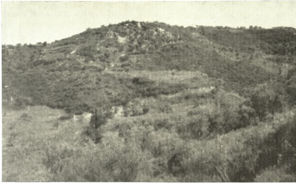
Ὁ λόφος Ἄνω Ἐγκλιανὸς ἐκ Νοτιανατολικῶν.