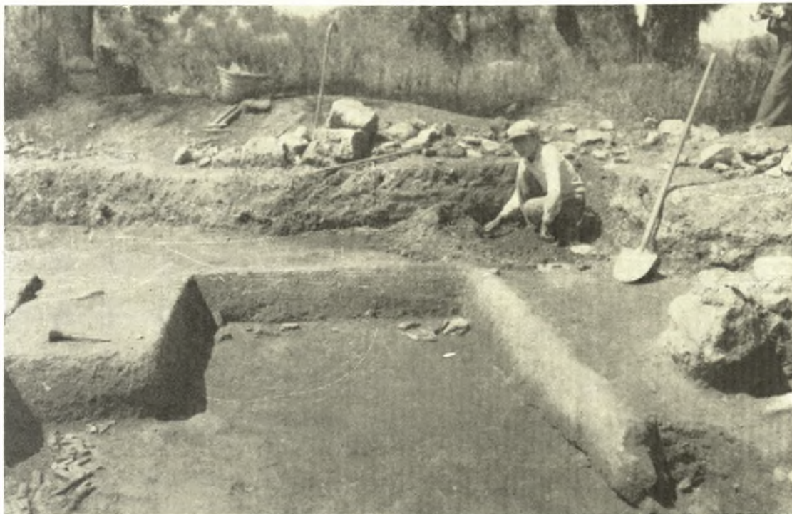
Εἰκ. 1. Δωμάτιον εὐρέσεως ἐνεπιγράφων πινακίδων, τὸ ἀρχεῖον τοῦ ἀνακτόρου.