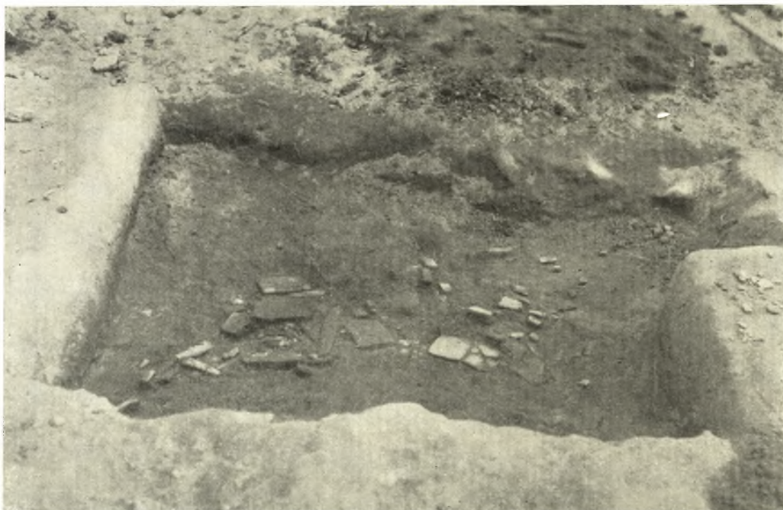
Εἰκ. 2. Πήλινοι ἐνεπίγραφοι πινακίδες ὡς εὐρέθησαν ἐπὶ τοῦ δωπέδου τοῦ ἀρχείου.