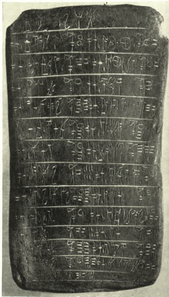
Εἰκ. 3. Πηλίνη πινακίς ἀριθ. 131.

διὰ τῶν ὁποίων σχηματίζονται δύο ἢ τρία διαστήματα πρὸς γραφήν. Ὑπάρχουν ἐν τούτοις