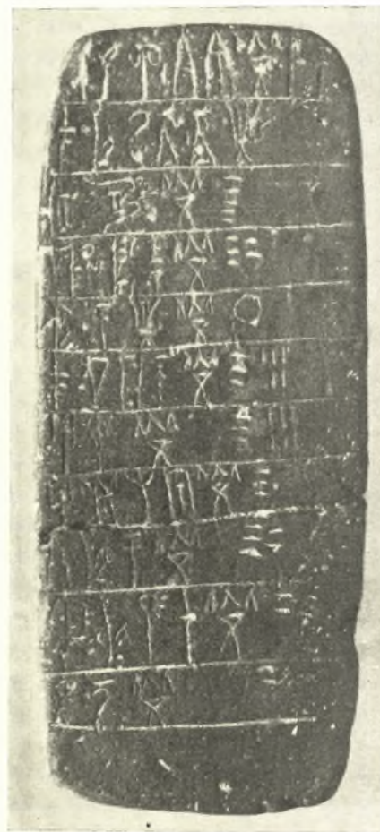
Εἰκ. 5. Πηλίνη πινακίς ἀριθ. 20.