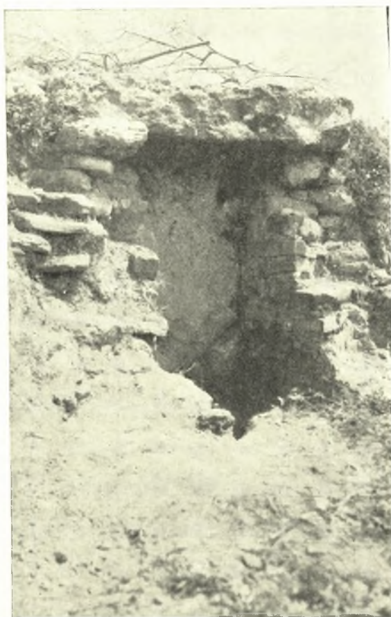
Εἰκ. 7. Ἀνώφλιον θολωτοῦ τάφου πρὸ τῆς ἀνασκαφῆς.