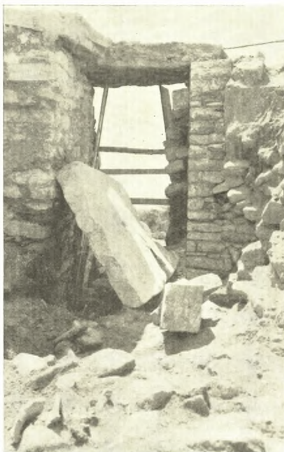
Εἰκ. 9. Στόμιον θολωτοῦ τάφου.

εἰς τὸ περιεχόμενον τοῦ τάφου, κατωρθώσαμεν νὰ συλλέξωμεν σημαντικὸν πλῆθος διαφωτιστικοῦ ὕλικου. Περισυνελέξαμεν μὲ μεγάλην εὐλάβειαν κάθε τι, ἀκόμη καὶ τὰ ἐλάχιστα θραύσματα ὀστέων. Πολλὰ μικρότατα πράγματα παρουσιάζοντο καὶ ὅταν ἐκοσκινίζομεν τὸ χῶμα. Διὰ τῶν εἰς μεγάλην ἔκτασιν ἕντος τοῦ τάφου διεσπαρμένων τμημάτων ἀνθρωπίνων σκελετῶν ἠδου-