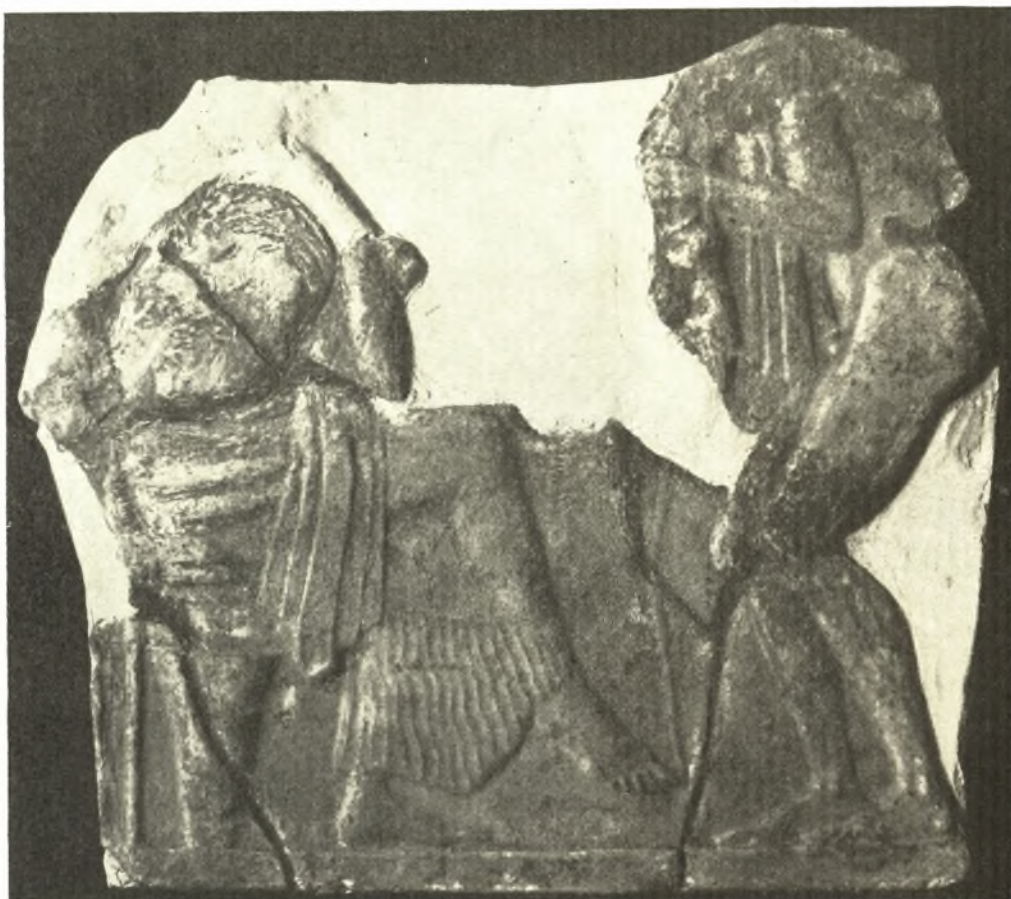
Εἰκ. 4. Μηλιακὸν ἀνάγλυφον ἐν Σύρῳ.

ἐνώπιον. Φορεῖ χιτῶνα λινοῦν, τοῦ ὁποῦ αἱ λεπταὶ πτυχαὶ φαίνονται κάτωθι τοῦ μέγρι τοῦ μέσου ὕψους τῶν κνημῶν φθάνοντος ἱματίου· τοῦτο περιβάλλει αὐτὴν κατὰ τὴν ὀσφύν, τὸ δὲ ἀριστερὸν αὐτοῦ ἄκρον κατέρχεται πρὸς τὰ κάτω ἀπὸ τοῦ δεξιοῦ μηροῦ εἰς κλιμακοειδεῖς πτυχάς. Τὸ δεξιὸν σκέλος ἔχει ἐπὶ τοῦ ἀριστεροῦ τὴν κεφαλὴν ἐστήριζεν ἐπὶ τῆς ἀριστερᾶς χειρὸς· ἡ δεξιὰ κρατεῖ τὴν ἄνω ἀριστερὰν γωνίαν τοῦ καθί-