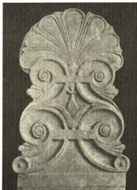
Εἰκ. 2. Στήλη ἐκ Τρωάδος.