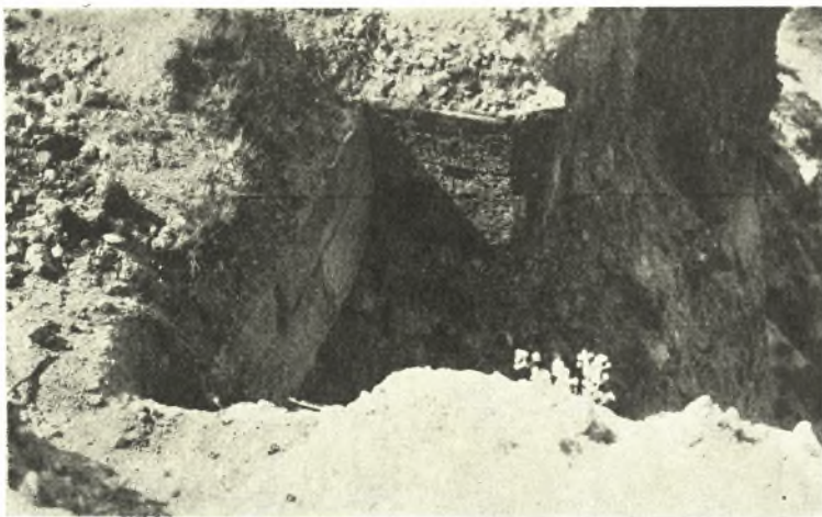
Εἰκ. 4. Ἀναλημματικὸν τεῖχος τοῦ νοτίου λόφου τῆς Γαληψοῦ.

ἢ παρόμοιον κτίσμα 1 . Οὐδὲν ἕτερον θεμέλιον ἢ λείψανον παρατηρήθη εἰς τὴν ἔκτασιν ταύτην, ἢ ὅποια ἴσως ἐχρησιμοποιεῖτο διὰ θρησκευτικὰς τελετὰς καὶ ὡς γέφυρα ἐνοῦσα τὸν βόρειον λόφον καὶ τὴν εἴσοδον τῆς πόλεως μετὰ τὴν χαμηλοτέραν ἐπίπεδον ἐπιφάνειαν τοῦ νοτίου λόφου.