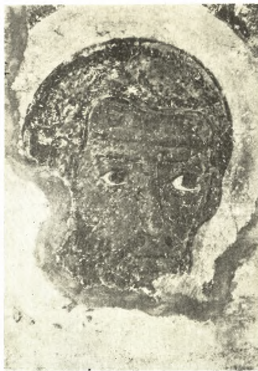
Εἰκ. 11. Ὁ Ἀπόστολος Ἰάκωβος.