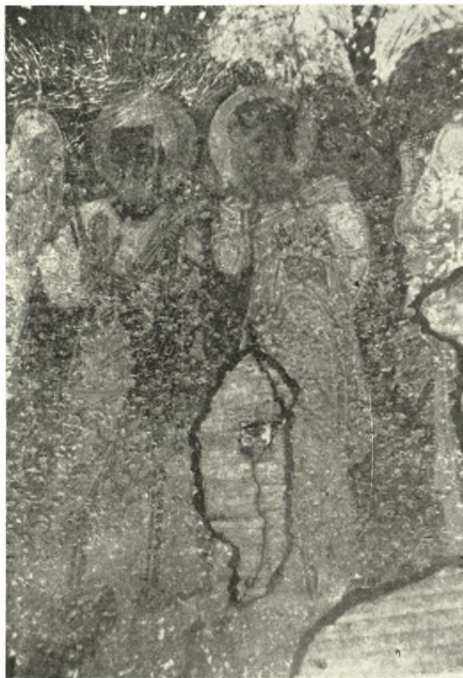
Εἰκ. 4. Οἱ Ἀπόστολοι Πέτρος καὶ Ἰωάννης (Πρβ. καὶ εἰκ. 9, 10).

λίαν μέλαν τῆς κόρης. Τὰ περιγράμματα εἶναι ἐντόνως διαγεγραμμένα διὰ λίαν σκοτεινοῦ χρώματος, ἢ δὲ φωτοσκίασις δὲν γίνεται διὰ βαθμιαίας μεταβάσεως ἀπὸ τῶν σκοτεινῶν τόνων πρὸς τοὺς φωτεινοὺς, ἀλλὰ δι' ὀλίγων φωτεινῶν ἐπιπέδων ἐπὶ τοῦ ὄχι πολὺ σκοτεινοῦ γενικοῦ χρώματος τῶν σαρκῶν (προπλασμοῦ), οὕτως ὥστε ἐξ ἀποστά-