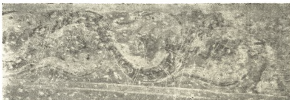
Εἰκ. 7. Κόσμημα εἰς τὴν ἄνω παρυφὴν τῆς παραστάσεως.

καθαρῶς δογματικούς, καὶ ὅτι κατόπιν τεχνικαὶ ἀνάγκαι ἐπέβαλον τὴν ἀντικατάστασιν τῆς σκηνῆς ταύτης ἐν τῷ τρούλλῳ διὰ τῆς εἰκόνας τοῦ Παντοκράτορος. Τὴν συνέχισιν τοῦ συστήματος τούτου εὐρίσκει κατὰ τὴν κυρίως Βυζαντινὴν περίοδον εἰς τὴν 'Αγ. Σοφίαν τῆς Θεσσαλονίκης καὶ εἰς ἄλλα γνωστὰ μνημεῖα, ὅπου ἡ 'Ανάληψις κατέχει τὸν κεντρικὸν τρούλλον 1 . "Αν ἠκολούθει τις τὴν γνώμην ταύτην τοῦ Schmit, θὰ ἔπρεπε νὰ παραδεχθῆ ὅτι καὶ ὁ τεχνίτης τῶν 'Αγ. 'Αποστόλων ἐτοποθέτησε κατὰ τὸν 6 ον αἰῶνα τὴν 'Ανάληψιν εἰς τὸν κεντρικὸν τρούλλον συμμορφούμενος πρὸς τὰ κατὰ τὴν ἐποχὴν του ἐπικρατοῦν εἰκονογραφικὸν σύστημα. 'Η θεωρία ὅμως αὕτη νομίζομεν ὅτι δὲν εἶναι δυνατὸν νὰ γενικευθῆ, καθ' ὅσον τὰ παραδείγματα ἅτινα φέρει ὁ Schmit πολὺ ἀπέχουσιν ἀπὸ τοῦ νὰ εἶναι ἀσφαλῆ. 'Η ἀπεικόνισις τῆς 'Αναλήψεως εἰς τὸν τρούλλον τοῦ ναοῦ τῆς Κοιμήσεως ἐν Νικαίᾳ εἶναι ἐντελῶς ὑποθετικὴ 2 , εἰς δὲ τὸν ἐπὶ 'Ιουστι-