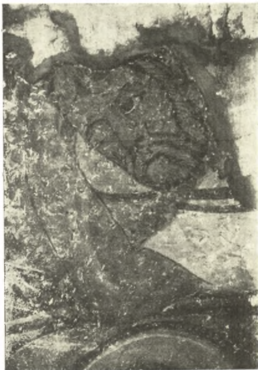
Εἰκ. 13. Ὁ Ἀπόστολος Βαρθολομαῖος.