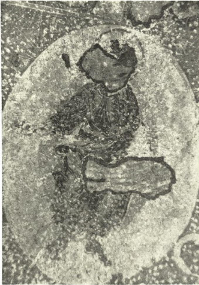
Εἰκ. 2. Ὁ ἀναλαμβάνόμενος Ἰησοῦς.

Ἀριστερὰ τῆς Θεοτόκου παρίσταται ἄγγελος, τοῦ ὁποῦ μέρος μόνον διατηρεῖται, δεικνύων διὰ τῆς δεξιᾶς τὸν εἰς τοὺς οὐρανούς ἀνερχόμενον Ἰησοῦν. Παρ' αὐτὸν