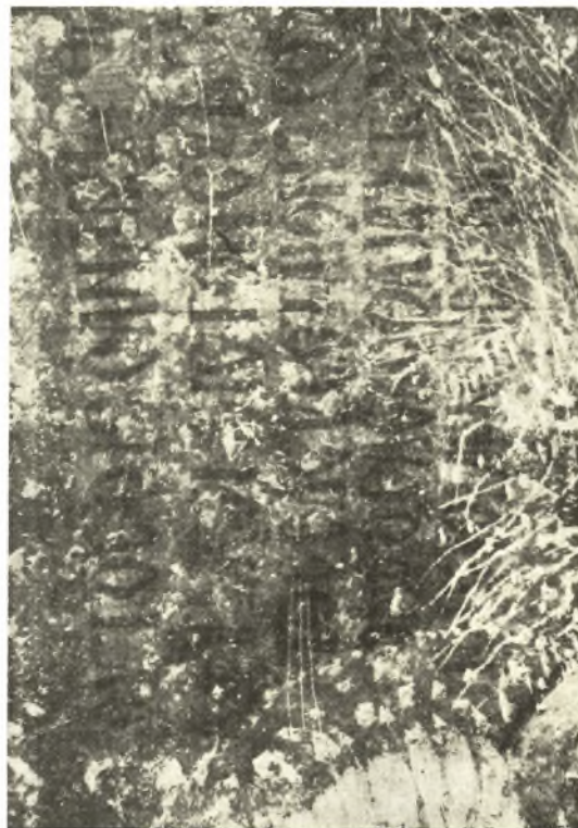
Εἰκ. 15. Ἡ ἐπιγραφή ἄνω τῶν Ἀποστόλων Πέτρου καὶ Ἰωάννου.