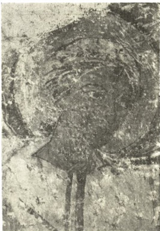
Εἰκ. 8. Ὁ πρὸς δεξιὰ ἄγγελος. (Πρβ. καὶ εἰκ. 3).