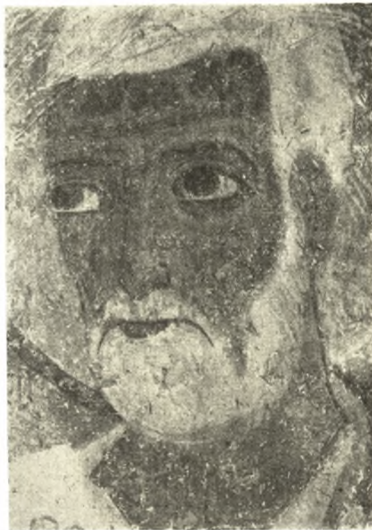
Εἰκ. 9. Ὁ Ἀπόστολος Πέτρος. (Πρβ. καὶ εἰκ. 4).