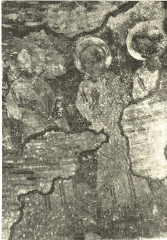
Εἰκ. 6. Οἱ Ἀπόστολοι Μάρκος, Ἀνδρέας καὶ Παῦλος.