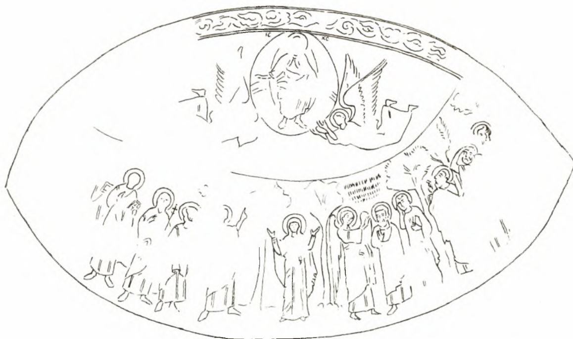
Εἰκ. 1. Τοιχογραφία τῆς Ἀναλήψεως ἐν τῇ ἀψίδι τοῦ Ἁγ. Γεωργίου τῆς Θεσσαλονίκης. Γενική ἀπομυκ.