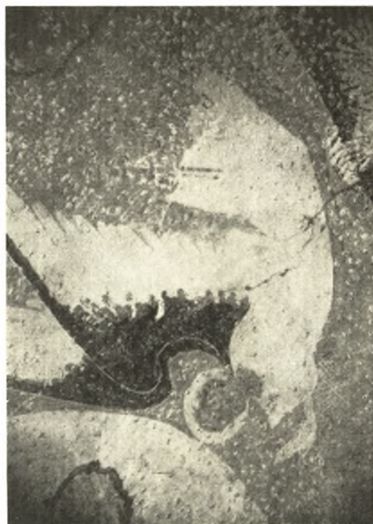
Εἰκ. 14. Εἰς τῶν Ἀγγέλων τῶν ὑπερβασιζόντων τὸν Ἰησοῦν.