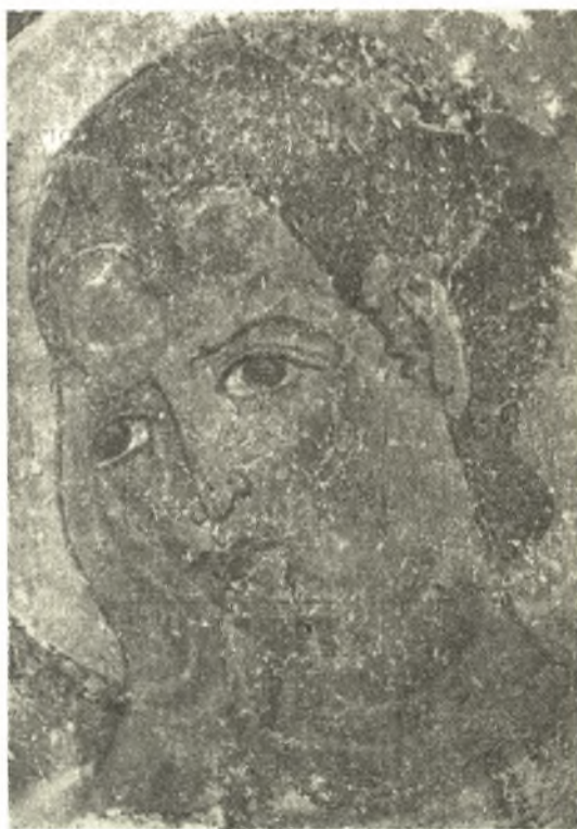
Εἰκ. 10. Ὁ Ἀπόστολος Ἰωάννης. (Πρβ. καὶ εἰκ. 4).