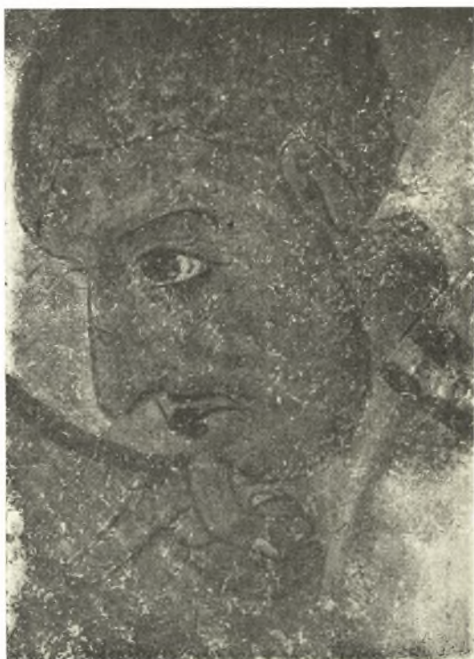
Εἰκ. 12. Ὁ Ἀπόστολος Λουκᾶς. (Περβ. καὶ εἰκ. 5).