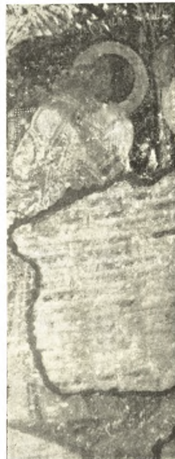
Εἰκ. 5. Ὁ Ἀπόστολος Λουκᾶς. (Πρβ. καὶ εἰκ. 12).

Τὸ γεγονὸς τοῦτο, τὴν ὑπὸ λαϊκῶν δηλαδὴ ζωγράφων μετασκευὴν ἀκαδημαϊκῶν προτύπων, δυνάμεθα νὰ διαπιστώσωμεν ἀπολύτως, χάρις εἰς τὴν εὐτυχή συγκυρίαν ὅτι διεσώθησαν μέχρις ἡμῶν δύο ἀντίγραφα ἐνὸς καὶ τοῦ αὐτοῦ ἀκαδημαϊκοῦ προτύπου, ὧν τὸ μὲν ἐγένετο ὑπὸ λαϊκοῦ τεχνίτου, τὸ δὲ ὑπὸ ἀκαδημαϊκοῦ. Τὸ πρῶτον εἶναι αἱ λαϊκαὶ τοιχογραφίαι τῆς παλαιᾶς ἐκκλησίας τοῦ Τοκάλ ἐν Καππαδοκίᾳ, γενόμεναι λήγοντος τοῦ 9 ου ἢ ἀρχομένου τοῦ 10 ου αἰῶνος 3 , τὸ δὲ δεύτερον αἱ μικρογραφίαι τοῦ ὑπ' ἀριθ. 5 χειρογράφου Εὐαγγελίου τῆς Μονῆς Ἰβήρων ἐν Ἀγ. Ὁρει, γενόμεναι κατὰ τὸν 12 ον πιθανώτατα αἰῶνα καὶ δυνάμεναι νὰ χαρακτηρισθῶσιν ὡς πραγματικοὶ ἀντιπρόσωποι τῆς μεγάλης τέχνης τῆς Κωνσταντινουπόλεως 4 . Εἰς τὰς πλείστας τῶν σκηνῶν τῶν εἰκονιζομένων εἰς τὰ δύο ταῦτα μνημεῖα εἶναι εὐκόλον νὰ παρατηρήσῃ τις ὅτι ὁ ζωγράφος τῆς Καππαδοκίας μετέφρασε κατὰ τὸν ἰδικόν του λαϊκὸν τρόπον τὸ ἑλληνιστικὸν πρότυπον, τὸ ὅποῖον ὁ ἐκτελέσας τὰς μικρογραφίας τοῦ χειρογράφου τῆς Μονῆς Ἰβήρων ἀντέγραψε πιστότατα κατὰ τὴν ἀκαδημαϊκὴν τεχνοτροπίαν τῆς Πρωτευούσης.