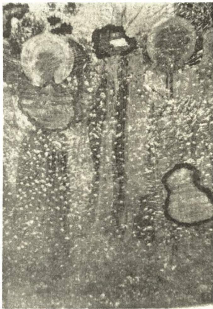
Εἰκ. 3. Ἡ Θεοτόκος καὶ ὁ πρὸς δεξιὰ Ἀγγελος (Πρβ. καὶ εἰκ. 8).

Ἡ κατασκευὴ ὁμοίως τῶν προσώπων καὶ τῶν ἐνδυμάτων παρουσιάζει πολὺ ἐνδιαφέρον. Αἱ μορφαὶ ἔχουσι μεγάλους ὀφθαλμούς, οὓς καθιστᾷ ζωηροτέρους τὸ ἰσχυρῶς λευκὸν τοῦ βολβοῦ καὶ τὸ