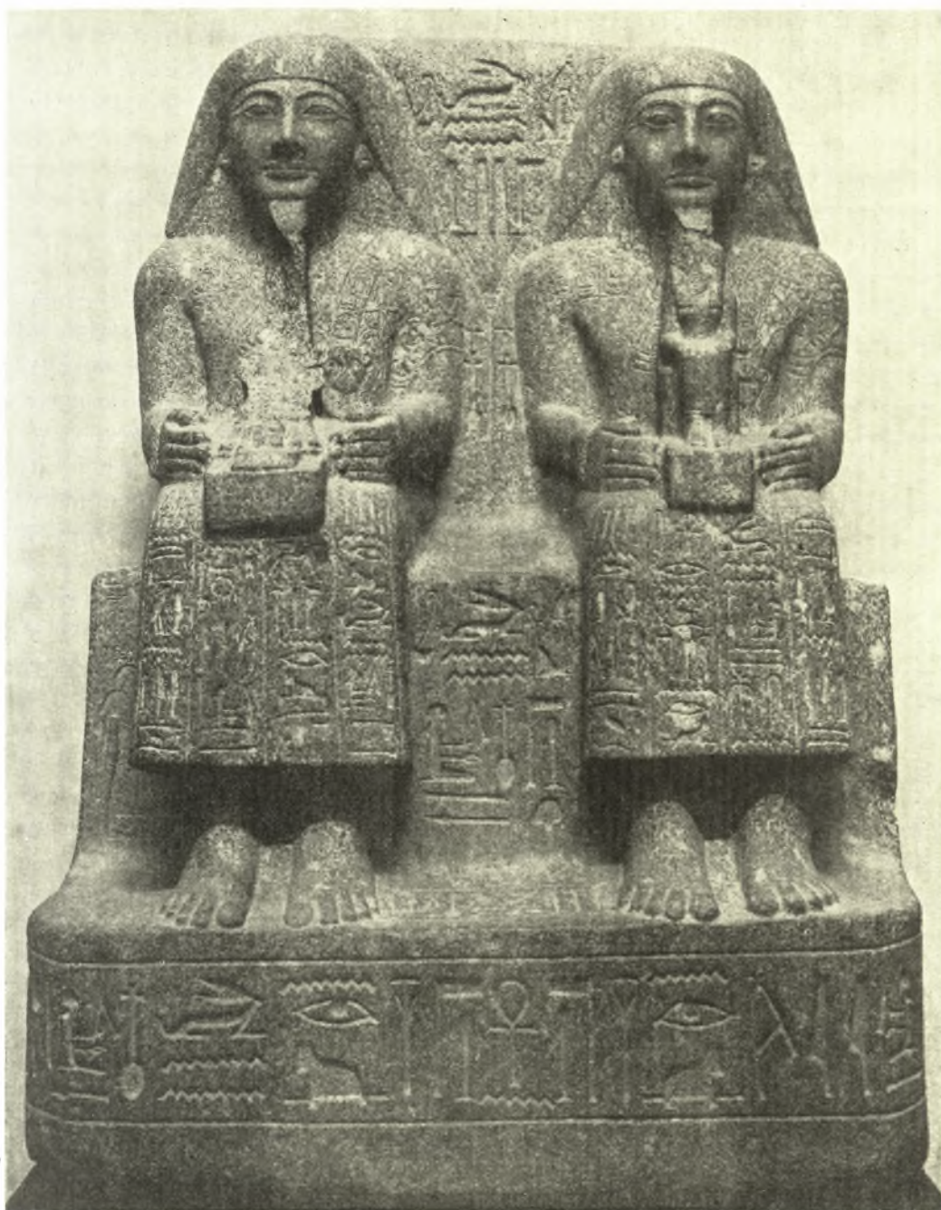
Fig. 2. Groupe du prêtre Unnefer et de son père Meri, du Musée du Caire, N° 35257.