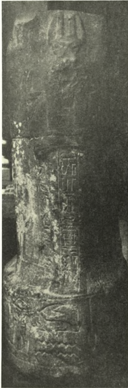
Fig. 4. Côte gauche du monument acéphale d'Unnefer du Musée du Caire, N° 35258.