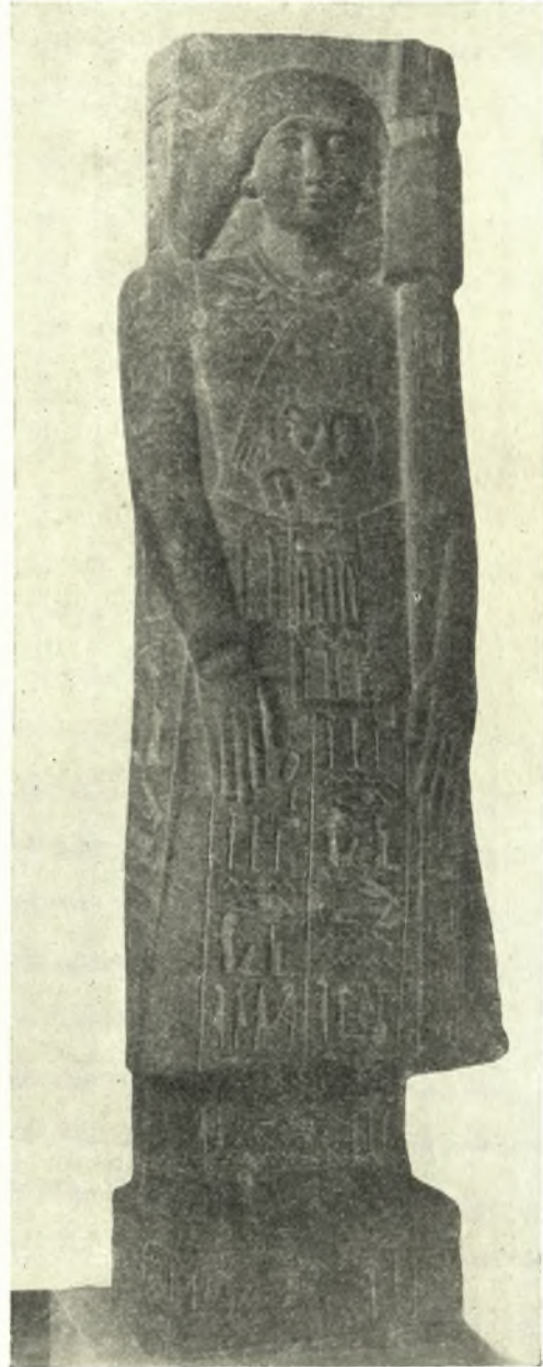
Fig. 5. Statue-caryatide du prêtre Unnefer du Musée du Louvre, A. 66.