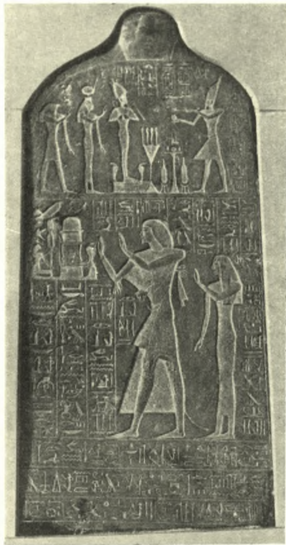
Fig. 3. Stèle du prêtre Unnefer et de sa femme Tai , dite Nefertati , du Musée du Caire. N° 34505.

3. Cinq fils d'Unnefer: 1) Le prêtre, le chef du palais Rames , 2) le prêtre d'Isis Jura , 3) le prêtre d'Osiris Saast , 4) le prêtre d'Horus Ut , 5) le prêtre-purificateur d'Osiris Meri et cinq filles d'Unnefer: 1) Chera , 2) Uaai , 3) Ast-nefert , 4) Mut-nefert , 5) Buia .