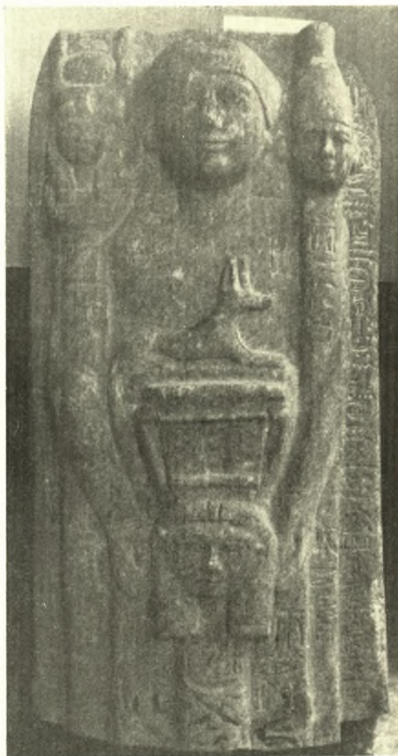
Fig. 1. Statue-caryatide du prêtre Unnefer, du Musée National d'Athènes.

Sur le bâton hathorique: «Hathor, maîtresse de Akhori (ville de la province d'Oxyrrynchos), Isis, maîtresse d'Akhoui».