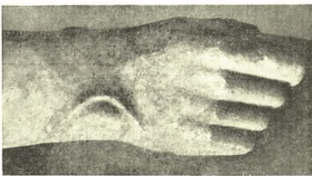
Εἰκ. 1. Δεξιὰ χεῖρ κούρου τῆς Νέας Ὑόρκης.

Μεταξὺ τῶν τριῶν αὐτῶν γνωστῶν παραδειγμάτων, τὰ ὁποῖα εἶναι καὶ τὰ μόνα, πρὸς τὰ ὁποῖα εἶναι δυνατόν νὰ συγκριθῇ ἡ ἰξεταζομένη χεῖρ, τὴν μεγίστην ἀναλογίαν μεταξὺ των παρουσιάζουν αἱ χεῖρες τοῦ Διπύλου καὶ τῆς Νέας Ὑόρκης. Καὶ τῶν δύο αἱ ἀναλογίαι εἶναι ἐπιμήκεις καὶ τὸ περίγραμμά των γωνιώδες. Ἐξαιρετικῶς