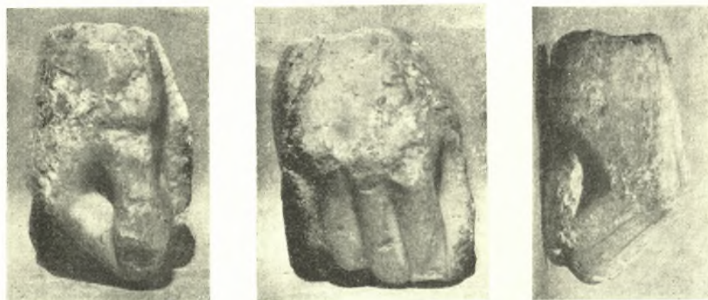
Εἰκ. 3. Ἐθνικοῦ Μουσείου.

Ἐμφότεραι αἱ χεῖρες εἶναι νεώτεροι τῆς ἀνωτέρω δημοσιευομένης ἐκ τῆς ἰδιωτικῆς συλλογῆς Καλλιγᾶ καὶ ποιοτικῶς βεβαίως ὑποδεέστεραι. Πρὸς ταύτην, ὡς καὶ πρὸς