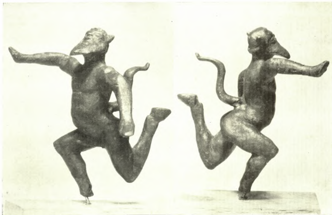
1. ΚΥΡΙΑ ΟΨΙΣ ΤΟΥ ΣΙΑΗΝΟΥ.