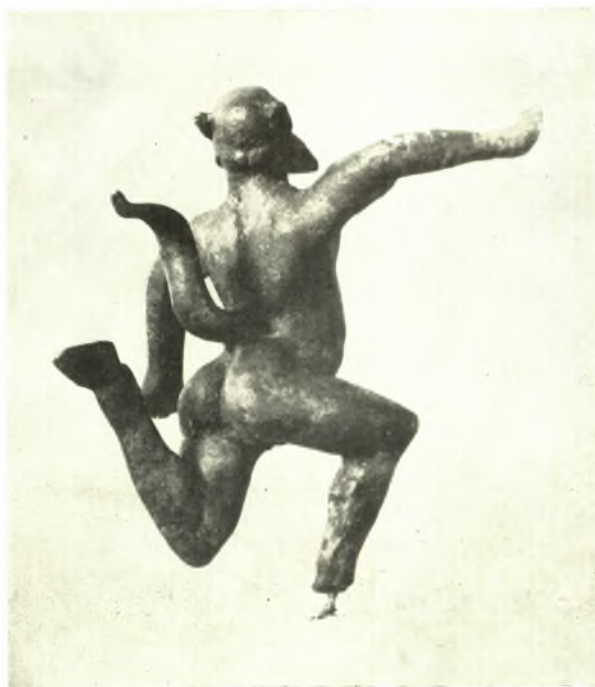
3. ΟΠΙΣΘΙΑ ΟΨΙΣ ΤΟΥ ΣΙΑΗΝΟΥ.