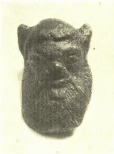
Εἰκ. 3. Κεφαλὴ τοῦ σιληνοῦ πίν. 1.