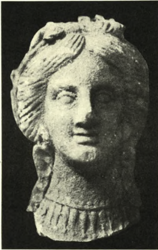
Εἰκ. 5. Πηλίνη κεφαλή Ἀφροδίτης.

τῆς κορυφῆς 0,145). Παρίσταται Ἑρμῆς γυμνός, ὄρθιος, φέρων ἐπὶ τῆς κεφαλῆς φύλλον λατοῦ ἄνω τοῦ μετώπου κατ' Αἰγυπτιακὴν τέχνην ἴσταται κατ' ἐνώπιον στηρίζων τὸ βάρος τοῦ σώματος ἐπὶ τοῦ δεξιοῦ ποδός καὶ ἀνασύρων ἐλαφρῶς τὸν ἀριστερόν· στρέφει δ' ἐλαφρῶς τὴν κεφαλὴν δεξιὰ βλέπων ἡρέμα. Καὶ διὰ μὲν τῆς δεξιᾶς χειρός, ἣν προεκτείνει δεξιὰ, κρατεῖ βαλάντιον, διὰ δὲ τῆς ἀριστερᾶς κηρύκειον καὶ φέρει περιβεβλημένον ἐπὶ τῆς ἀριστερᾶς χειρός ἀπὸ τοῦ ἀγκῶνος μέχρι τοῦ καρποῦ τῆς χειρός τὸ ἱμάτιον, πτυχούμενον καὶ κρεμάμενον πρὸς τὰ κάτω, ἢ παλάμη ὅμως τῆς ἀριστερᾶς χειρός λείπει ἀποκοπεῖσα.