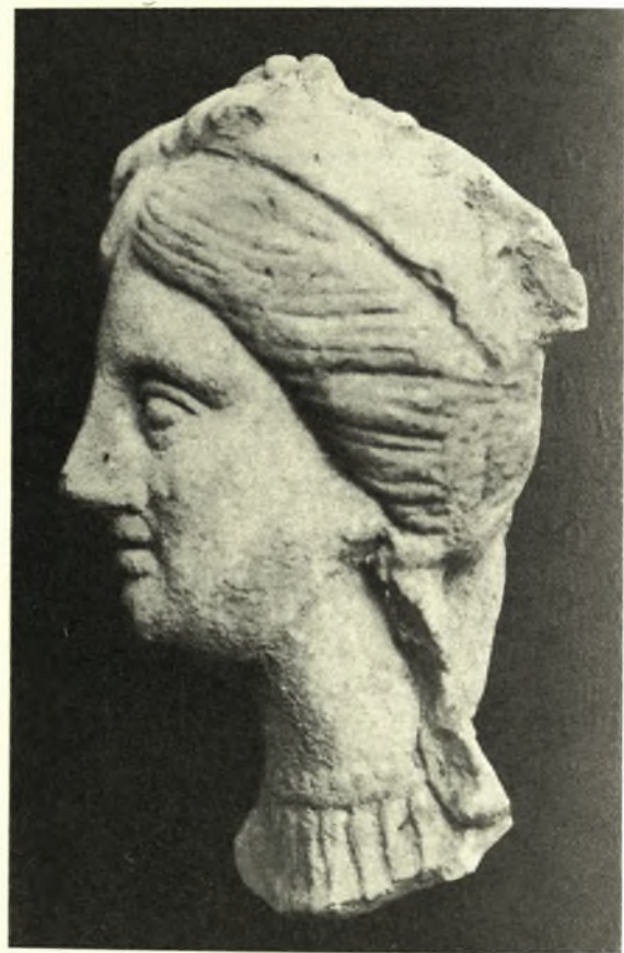
Εἰκ. 5 α . Πηλίνη κεφαλή Ἀφροδίτης.