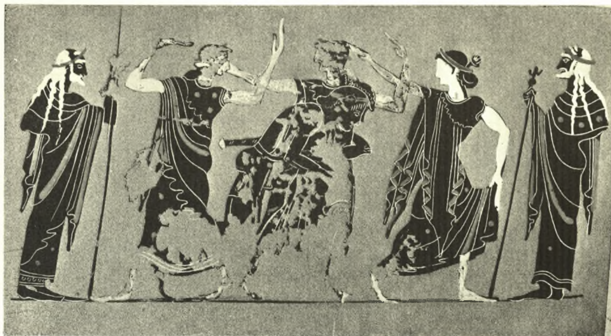
Εἰκ. 4. Ἀνάπτυγμα τῆς παραστάσεως τῆς Ληκήθου τοῦ 5 ου τάφου, πρβλ. εἰκ. 3.

νά φύγη. Ὁ ἀνὴρ ὅμως ἔχει ἤδη περισφίγξει διὰ τῶν δύο του χειρῶν τὴν ὀσφύν της καὶ φαίνεται προσπαθῶν νὰ τὴν σηκώσει. Δυστυχῶς εἰς τὸ σημεῖον τοῦτο ἡ σύνθεσις ἔχει φθαρῆ, διότι τὸ ἀγγεῖον εὐρίσκετο κατ' αὐτὴν τὴν πλευρὰν ἐντὸς τῆς ὑγρᾶς τοῦ τάφου ἐπιχώσεως. Τὴν ἔλλειψιν ταύτην ὅμως ἀναπληρώνουν ὁ τε πίναξ (εἰκ. 4) καὶ τὸ παρατιθέμενον ἰχνογράφημα (εἰκ. 5), ἔργα καὶ τὰ δύο τοῦ κ. Gillieron 1 . Ὁ ἀνὴρ οὗτος εἶνε ἐνδεδυμένος μὲ δέρμα ζώου, τὸ ὁποῖον τοῦ καλύπτει τὰ νῶτα καὶ τοὺς γλουτούς, ζώνη δὲ δι' ἐγχαράκτων