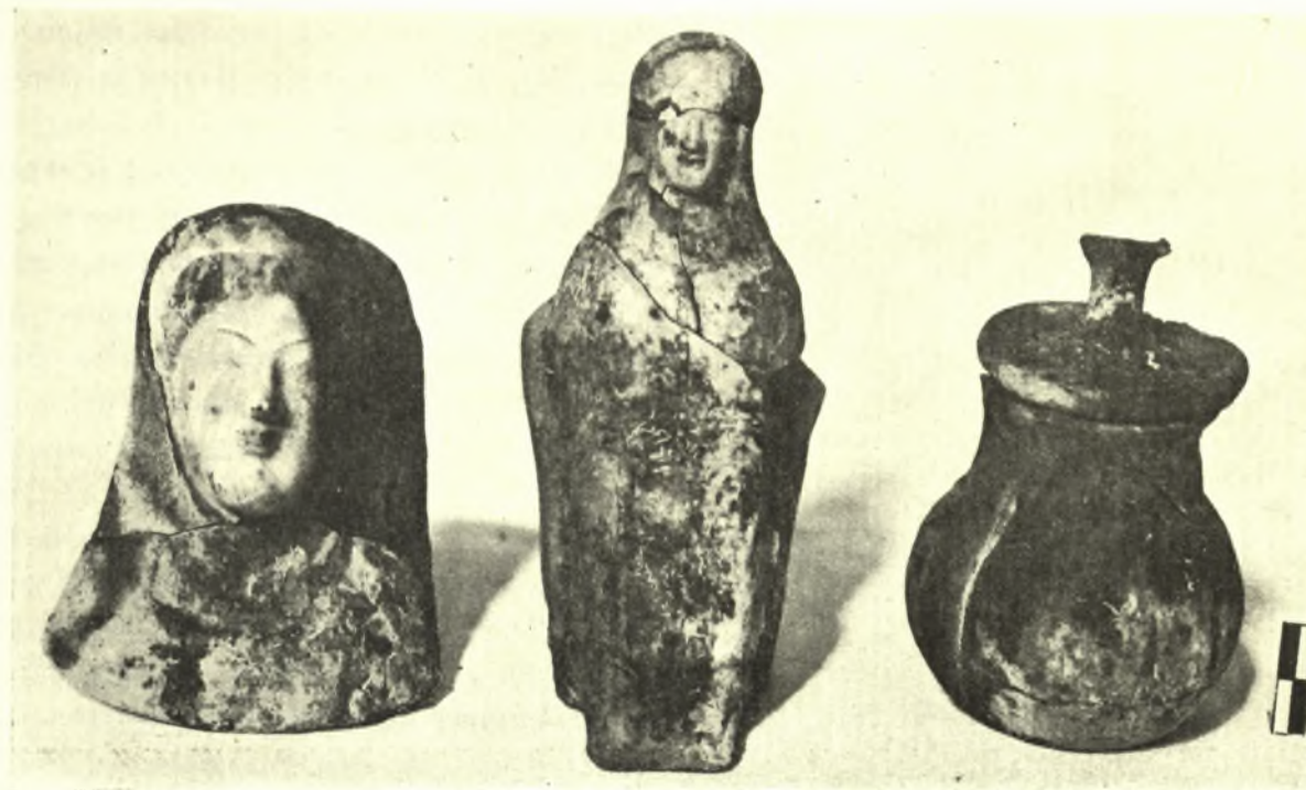
Εἰκ. 6. Ἐκ τῶν εἰρημάτων τοῦ 5 ου αἰῶνος.

φέρει μικράν λαβὴν σχήματος Τ, ἐξαρτωμένην ἐκ τοῦ κέντρου του. Κατὰ τὰ σημεῖα τῆς ἐπαφῆς του μετὰ τῆς στεφάνης τοῦ χείλους τοῦ ἀγγείου φέρει μικράν βάθυνσιν, διὰ νὰ ἐπιτυγχάνεται καλυτέρα ἡ ἀρμογή. Τέσσαρες ὁπαὶ ὑπάρχουσιν ἀκόμη εἰς τὸ πῶμα ἀντιστοιχοῦσαι πρὸς τὰς τῆς στεφάνης τοῦ χείλους. Ἐπὶ τῆς ἐκ λευκῆς βαφῆς ἐπιφανείας φέρει διακόσμησιν τινα κειμένην κατὰ τὸ ἐμπρόσθιον τμήμα τοῦ ἀγγείου, χρώματος δὲ ἐρυθροῦ. Εἶνε αὕτη μία ζώνη, ἐντὸς τῆς ὁποίας ἔχουν γραφῇ δωρικά(;) κυμάτια, φαίνεται δὲ ὅτι