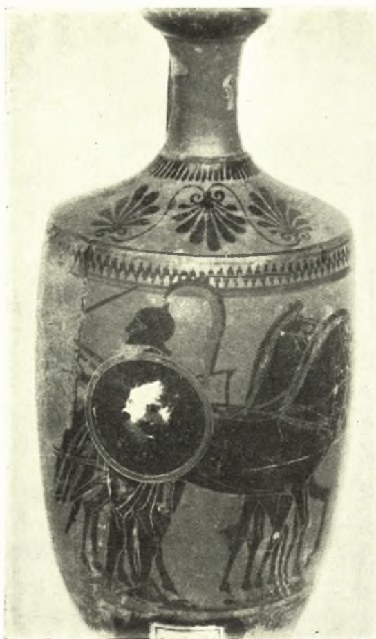
Εἰκ. 7. Αἰκίνητος τοῦ Ἐθνικοῦ Ἀρχαιολογικοῦ Μουσείου.

κεκολλημένον ἐκ δύο τεμαχίων. Ἡ τοῦ προσώπου διαμόρφωσις εἶνε ἐπιμελής, διακρίνονται δὲ ἡ ἐξέχουσα μύτη, εἰς μίαν εὐθείαν μετὰ τοῦ μετώπου οὖσα, αἱ παρειαί, τὰ παχέα, ἰδίᾳ τὸ