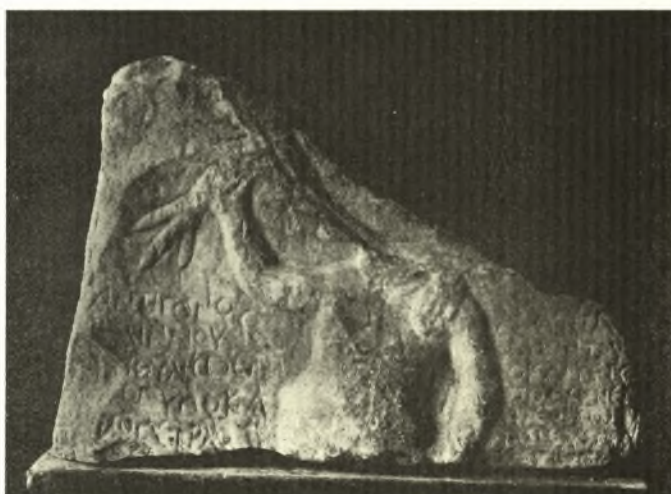
Εἰκ. 4. Ἐνεπίγραφον ἀνάγλυφον τοῦ Διὸς κεραυνοῦντος ἐκ Καισαρείας τοῦ Ἀλιάκμονος.