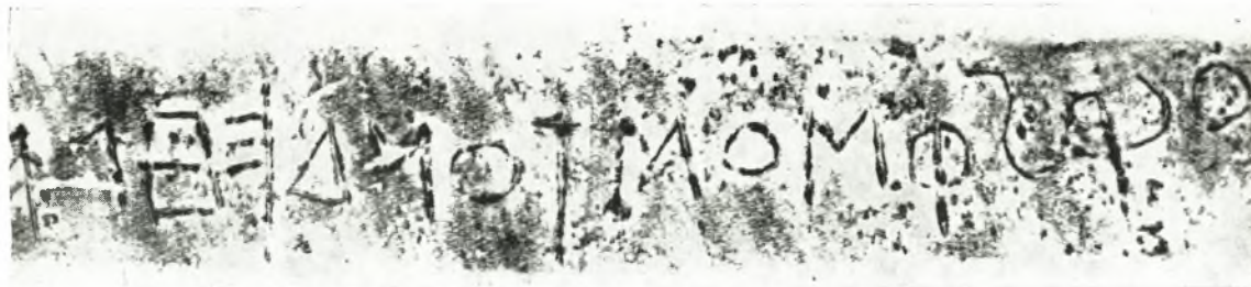
Εἰκ. 2. Ἐντριπτον ἔκτυπον τῆς ἐπιγραφῆς τῆς μίτρας.

Ἡ δευτέρα ἀνάγνωσις δὲν ἀποδίδει καὶ αὕτη πατρώνυμον, τὸ δὲ ὄνομα πρέπει νὰ