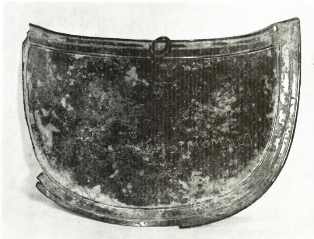
Εἰκ. 1. Ἐνεπίγραφος μίτρα ἐξ Ἄξου. Τέως Συλλογὴ Γιαμαλάκη (νῦν Μουσεῖον Ἡρακλείου).

Ἡ ἐπιγραφή εἶναι γεγραμμένη ἐπὶ τὰ λαϊὰ εἰς τὸ κάτω δεξιὸν μέρος τοῦ πετάλου.