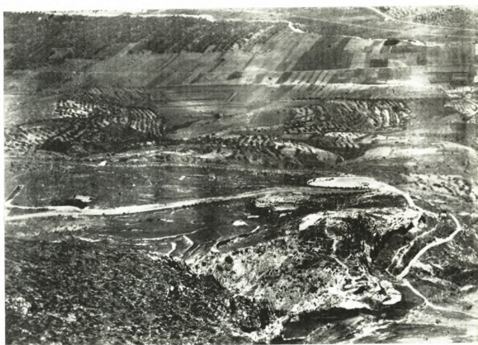
Ἡ ἀκρόπολις τῶν Μυκηναίων α. Ἡ βορεία πλευρά τῆς ἀκροπόλεως. β. ἡ ἀκρόπολις ἀπὸ τὰ Βορειοανατολικά.