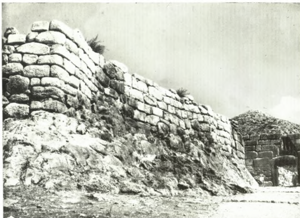
β. Ἡ πύλη τῶν λεόντων καὶ τὸ ἀνατολικὸν τεῖχος τῆς αὐλῆς τῆς μετὰ τὴν ἀναστήλωσιν.