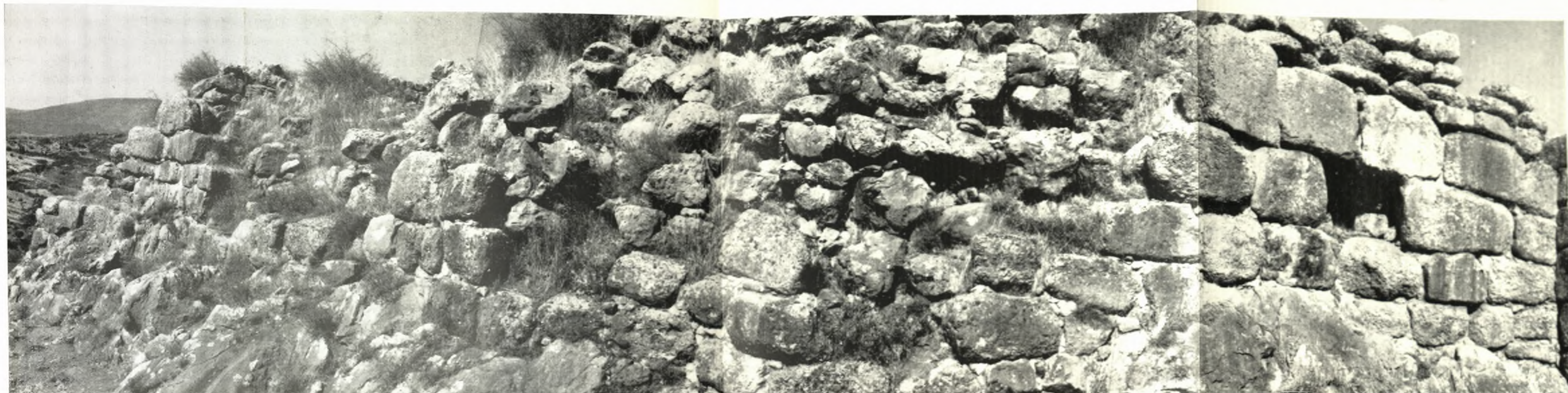
α. Το ανατολικόν τείχος της εξωτερικής αὐλῆς τῆς πόλης τῶν λεόντων πρὸ τῆς ἀναστήλωσως.