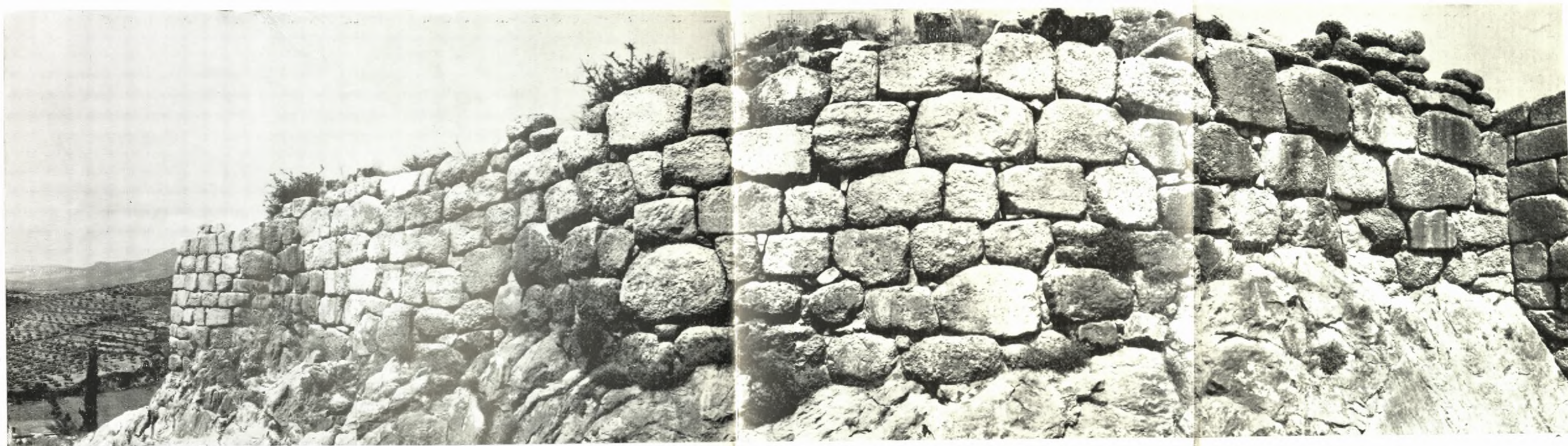
β. Το ανατολικόν τείχος τῆς εξωτερικῆς αὐλῆς τῆς πόλης τῶν λεόντων μετὰ τὴν ἀναστήλωσιν