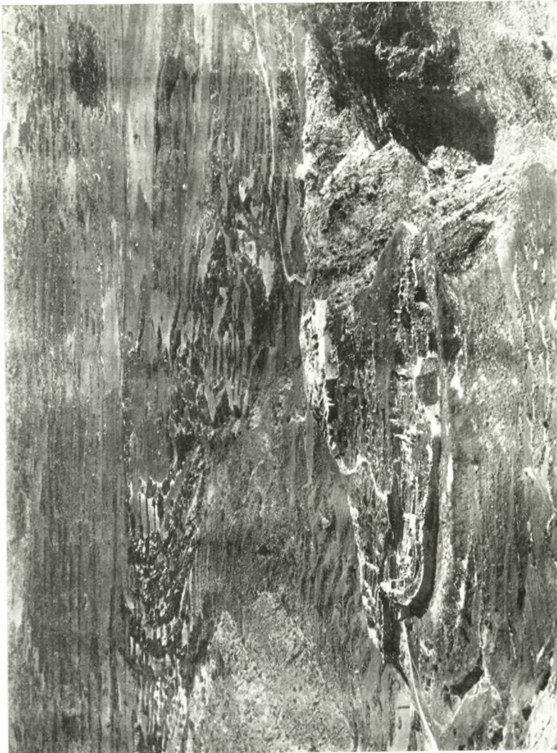
Ἡ ἀξρόπολις τῶν Μυκηθῶν ἀπὸ τὰ Νοτιοδυτικά.