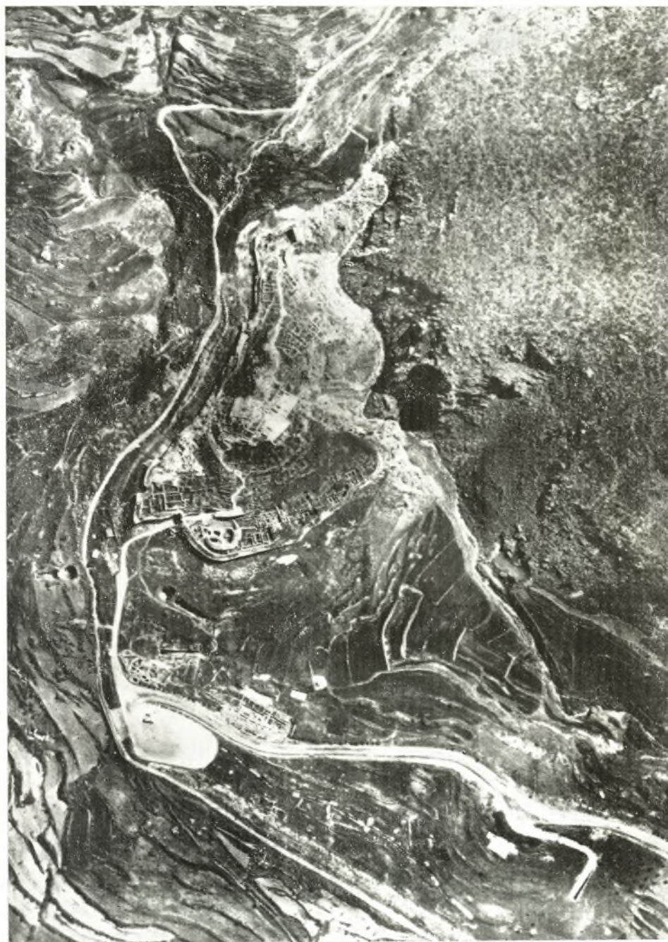
Ἡ ἀκρόπολις τῶν Μυκηνῶν ἀπὸ Βορρᾶ.