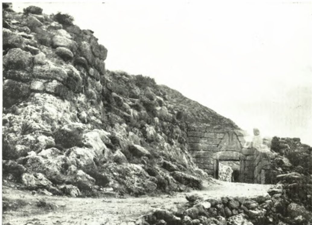
α. Ἡ πύλη τῶν λεόντων καὶ τὸ ἀνατολικὸν τεῖχος τῆς αὐλῆς τῆς πρὸ τῆς ἀναστηλώσεως.