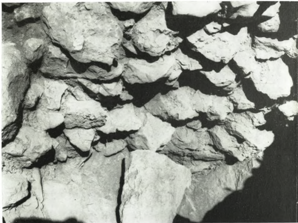
Εἰκ. 101. Γέμισμα πρὸ τῆς βορειοδυτικῆς αὐλῆς τοῦ ἀνακτόρου ὑποβασταζόμενον ὑπὸ τοῦ ἀναλημματικοῦ τοίχου Α τῆς εἰκόνας 99.

ανατολικόν τείχος στροφῆς του (πίν. 3α) ἔκλειε τὸν πρὸς τὸν Χάβον χώρον τῆς ἀκροπόλεως. Εἰς τὸ τείχος τοῦτο καὶ εἰς χρόνους μεταγενεστέρους προσετέθη ὁ λεγόμενος ἰσόδομος πύργος, περὶ τοῦ ὁποίου θὰ γίνῃ λόγος κατωτέρω. Τὸ βόρειον σκέλος τοῦ περιβόλου ἀπετέλει τὸ διασωθὲν βόρειον κυκλώπειον τείχος ἀπὸ τῆς παρὰ τὴν ὑπόγειον δεξαμενὴν στροφῆς του (πίν. 6α), τῆς ἀποτελούσης τὸ ἀνατολικόν του ἄκρον, μέχρι τῆς ΒΔ. γωνίας τῆς ἀκροπόλεως, πρὸς τὴν πύλην τῶν λεόντων. Πρὸ ἐτῶν ὁ ΤΣΟΥΝΤΑΣ ἐδίδαξεν ὅτι ἡ δυτικὴ πλευρὰ τοῦ ἀρχαιοτέ-