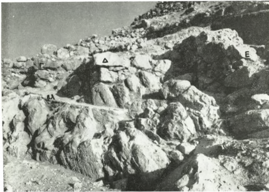
Εἰκ. 106. Ἐσοχαὶ Γ καὶ Δ τοῦ τοίχου ΤW καὶ τέρμα τοῦ Ε παρὰ τὸ χεῖλος τοῦ Χάβου. ἐλ. δάπεδον ἑλληνιστικοῦ κτίσματος.

Πρὸς πληρεστέραν κατανόησιν τῆς φύσεως τοῦ τοίχου ΤW ἐσκάψαμεν τομὰς ὀπισθεν τῆς ὄψεώς του καὶ εἰς διάφορα σημεῖα τοῦ μήκους του. Εἰς ὅλας αὐτὰς τὰς τομὰς ἀπεκαλύφθη γέμισμα ἐκ λίθων ἀργῶν καὶ χώματος, τὸ ὅποιον διήκει ἀπὸ τῆς ὄψεως τοῦ τοίχου μέχρι τοῦ βράχου, τοῦ ὑψουμένου ὀπισθεν αὐτοῦ. Τὸ πλάτος τοῦ γεμίματος ποικίλλει ἀναλόγως τῆς ἀποστάσεως τῶν βράχων ἀπὸ τοῦ