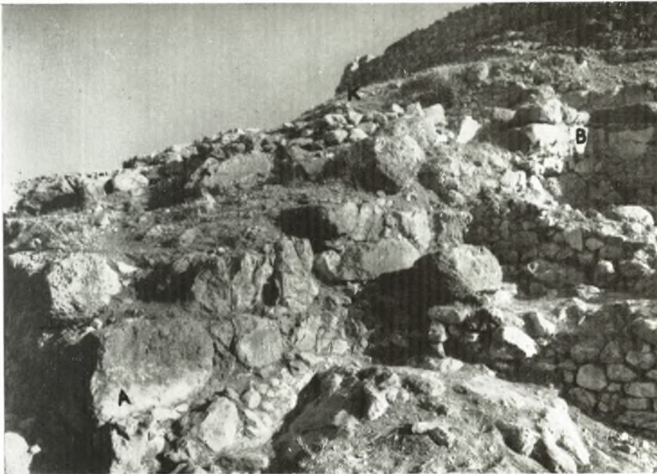
Εἰκ. 105. Δευτέρα στροφή ἀπὸ τοῦ B πρὸς Ἀνατολὰς τοῦ τοῖχου TW. K, ἡ θέσις τῆς νοτιοδυτικῆς κλιμακῆς τοῦ ἀνακτόρου.

ανατολικά μήκους του, ὁ τοῖχος TW στρέφεται κατ' ὀρθὴν σχεδὸν γωνίαν πρὸς Βορρᾶν, προφανῶς ἀκολουθῶν τὴν εἰς τὸ σημεῖον ἐκεῖνο καμπὴν τοῦ πετρώματος 1 . Ἡ στροφή του αὐτὴ διεσώθη καλῶς (εἰκ. 104, AA ) καὶ εἶχε προγενεστέρως ἀποκαλυφθῆ ὑπὸ τοῦ ΤΣΟΥΝΤΑ. Ἐκ τῆς γωνίας αὐτῆς ὁ τοῖχος βαίνει πρὸς Βορρᾶν περὶ τὰ 10 μέτρα· ἀντὶ ὅμως νὰ τερματισθῆ εἰς τὸν βράχον κατὰ τὸ σημεῖον ἐκεῖνο καὶ πάλιν στρέφεται κατ' ὀρθὴν σχεδὸν γωνίαν καὶ βαίνει, περὶ τὰ 7 ἀκόμη μέτρα, πρὸς Ἀνατολὰς (εἰκ. 105, B ). Ἐκεῖ καὶ πάλιν κάμπτεται πρὸς Βορρᾶν καὶ δημιουργεῖ δευτέραν ἔσοχὴν βάθους περίπου 2 μέτρων