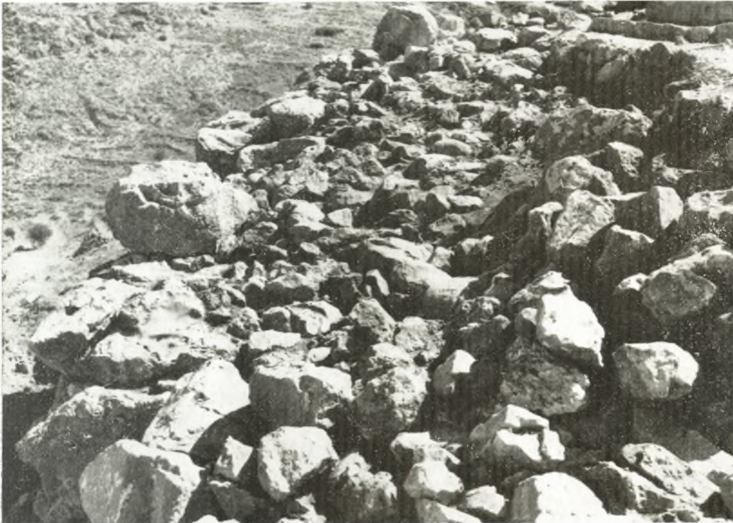
Εἰκ. 100. Γέμισμα λίθων ὑποβασταζόμενον ὑπὸ τοῦ ἀναλημματικοῦ τοίχου Α τῆς εἰκόνας 99.

σκαφή ἀπέδειξεν ὅτι ἰδρύθη εἰς τμήματα κατὰ διαφόρους χρόνους τῆς ΥΕ III ἐποχῆς. Τομαὶ γενόμεναι ὀπισθεν τῆς σειρᾶς τῶν ὀγκολίθων τῆς ὄψεώς του ἔφερον εἰς φῶς τὸ ἐξ ἀργῶν λίθων γέμισμα τῶν ἀνδῆρων, τὰ ὅποια ὑπεβάσταξε (εἰκόνες 100 καὶ 101). Τὰ ὀλίγα ὄστρακα ἐκ τοῦ γεμίματος, τὸ ὅποιον εἰς πολλὰ τμήματα διήκει μέχρι τοῦ βράχου, εἶναι ΥΕ III. Οὐδὲν ἀρχαιότερον ὄστρακον εὑρέθη. Πρὸς τούτοις, τὸ ἀνατολικὸν ἄκρον τοῦ τοίχου, ὡς ἀποδεικνύουν τὰ ἐπὶ τῶν βράχων ἴχνη του, προτοῦ καταστραφῆ εἰς τοὺς ἐλληνιστικοὺς χρόνους, ἐτερματίζετο εἰς τὴν βορείαν κλίμακα τοῦ ἀνακτόρου, ἐν ᾧ τὸ νότιον ἄκρον του καμ-