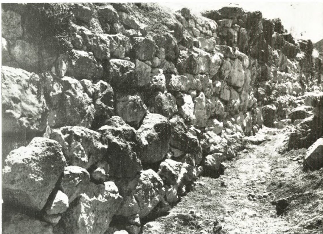
Εἰκ. 103. Τὸ βορειοδυτικὸν ἄκρον τοῦ τοίχου ΤW.

καὶ ἐγὼ ἐξέλαβον τοὺς βράχους αὐτοὺς ὡς ὀγκολίθους κυκλωπείου τείχους κατὰ χώραν κειμένους καὶ μόνον ὅταν ἀνέσκαψα τὸ περὶ αὐτοὺς χώμα, ἄνωθεν τοῦ ὁποίου ἐφαίνοντο αἱ κορυφαὶ των, ἀντελήφθην ὅτι δὲν ἦσαν ὀγκόλιθοι ἐκτισμένοι ἀλλὰ βράχοι. Ἐλυσὶς τοιούτων βράχων φέρει πρὸς τὸ ἄκρον κυκλωπείου τοίχου, τὸν ὁποῖον ὁ STEFFEN ἐσημείωσεν εἰς ὑψόμετρον 251.6 - 250.6 - 251.4 καὶ ἐχαράκτηρισεν ὡς kyklopische Stützmauer (πίν. 32, β). Τὸν τοῖχον τοῦτον ἐκαθάρισε καὶ ἐξηρεύνησεν ὁ ΤΣΟΥΝΤΑΣ καὶ εἰς τὴν ἔκθεσίν του τοῦ 1895 καὶ 1896 ἐδέ-