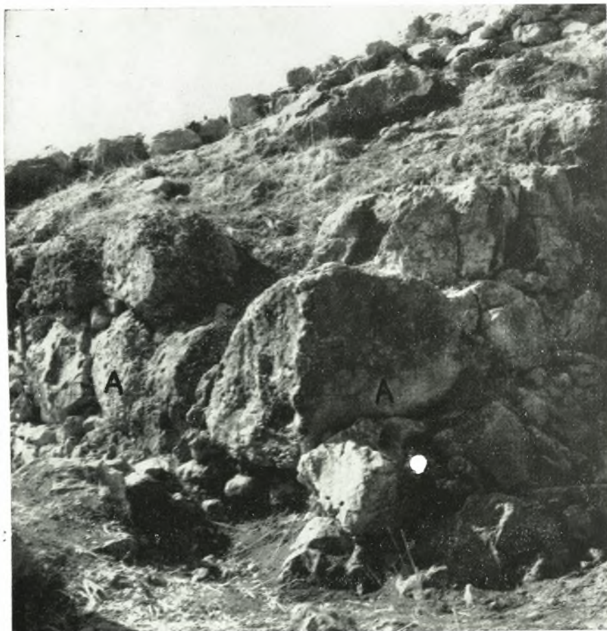
Εἰκ. 104. Στροφή ΑΑ, τοῦ τοίχου ΤW πρὸς Βορρᾶν.

διασώζονται δὲ εἰς μῆκος 9 μ. 1 . Οἱ ἄνωθεν τῶν τιτανολίθων τούτων δόμοι σχηματίζονται ἀπὸ πολὺ μικροτέρους λίθους, οἱ ὅποιοι εἶναι τεθειμένοι εἰς γραμμὴν διάφορόν πὺς τῆς τῶν κατωτέρων δόμων. Ἐν ᾧ ἡ κατασκευὴ τῶν ἐν λόγῳ τριῶν κατωτάτων δόμων εἶναι συμπαγῆς καὶ κυκλωπεῖα, ἡ τῆς πρὸς Νότον συνεχείας τοῦ τοίχου γίνεται βαθμηδὸν ἀμελεστέρα, μεγαλύτερα κενὰ ἀφίνονται μεταξὺ τῶν ὀγκολίθων, πολλοὶ τῶν ὁποίων εἶναι κροκαλοπαγεῖς. Τοῦτο, βεβαίως, δύναται