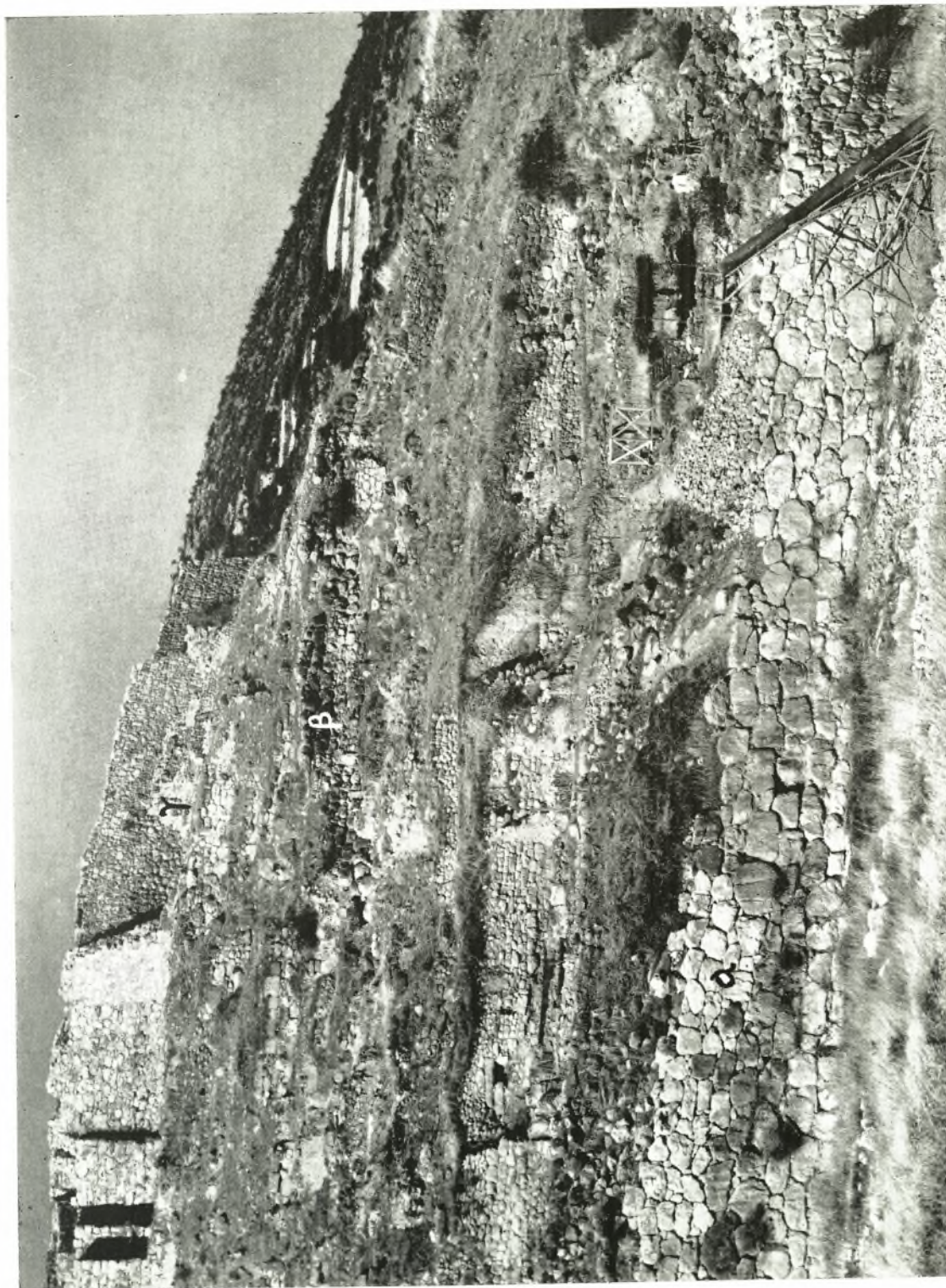
Τὸ νοτιοδυτικὸν τμήμα τῆς ἀκροπόλεως τῶν Μυκηθῶν.