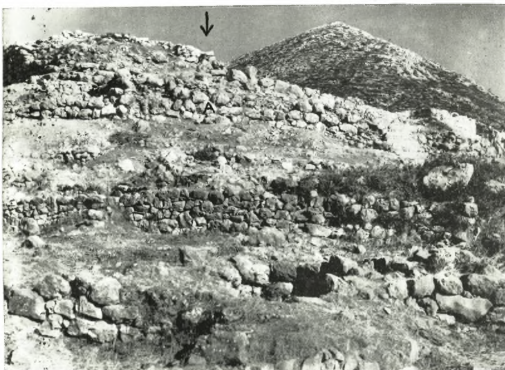
Εἰκ. 99. Τοῖχος κατὰ τὴν ΒΔ. κλιτὴν τῆς ἀκροπόλεως τῶν Μυκηνῶν.

Τὰ ἐκ τῶν πυλῶν καὶ τοῦ δυτικοῦ κυκλωπείου τείχους ὄστρακα ἐπιβάλλουν τὸ συμπέρασμα τῆς ὑπάρξεως ἀρχαιότερου περιβόλου, εἰς τὸν ὁποῖον προσετέθησαν τὰ κτίσματα ἐκεῖνα εἰς μεταγενεστέρους χρόνους, διότι εἶναι ὅλως ἀπαράδεκτον καὶ νὰ φαντασθῶμεν ἂν ὅτι αἱ Μυκῆναι εἶχον παραμείνει ἀτείχιστοι μέχρι τῶν μέσων τῆς ΥΕ ΠΙΒ περιόδου, ὅτε ἐκτίσθησαν ἡ πύλη τῶν λεόντων καὶ τὸ δυτικὸν κυκλώπειον τεῖχος, ἐν ᾧ ἡ Τίρυνς εἶχε τειχισθῆ κατα τὴν ΥΕ ΠΙΑ περίοδο. Τὰ διασωθέντα λείψανα ἐπιτρέπουν τὸν σαφῆ καθορισμὸν τῶν περιβόλων τῆς ἀκροπόλεως τῶν Μυκηνῶν εἰς τοὺς προϊστορικοὺς χρόνους.