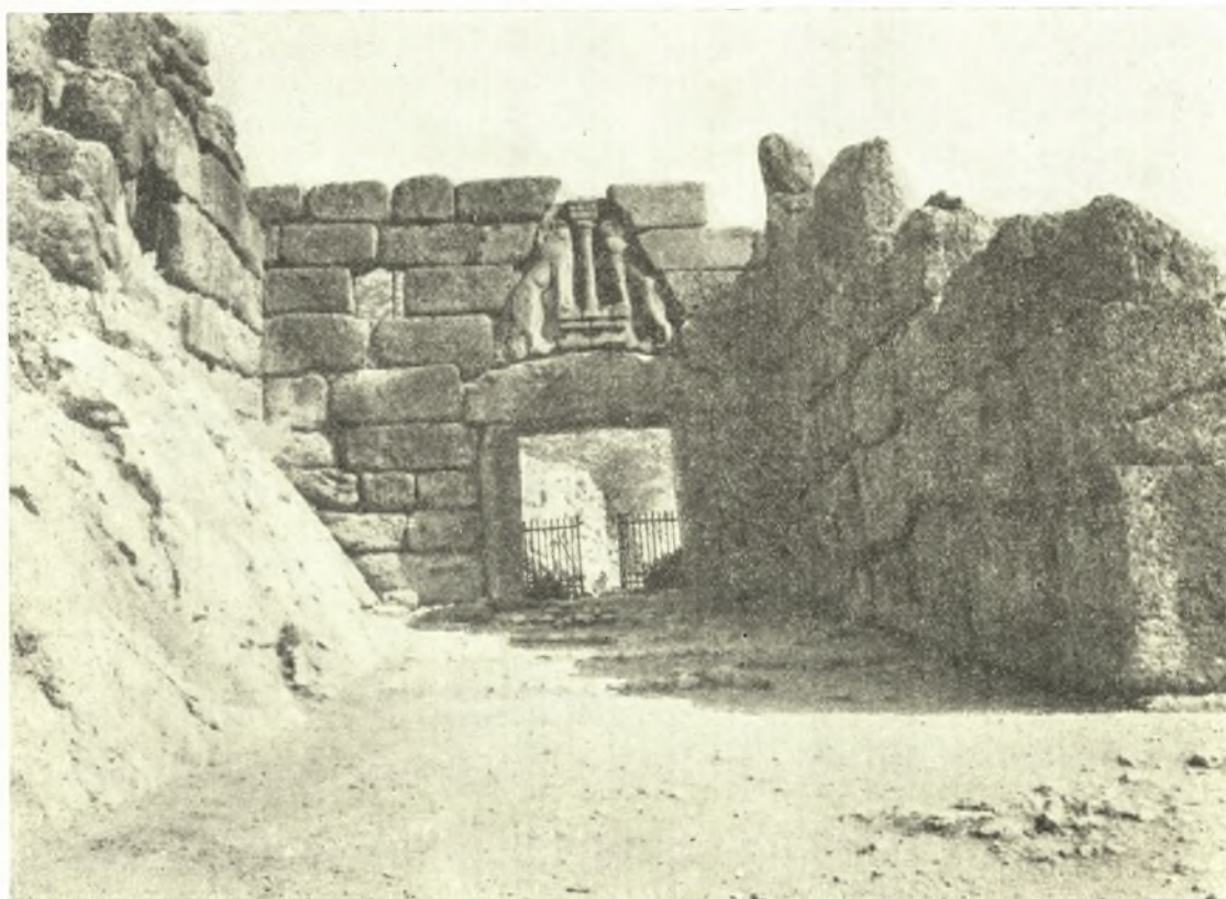
Εἰκ. 5. Ἡ πύλη μετὰ τὴν ἀναστήλωσιν.