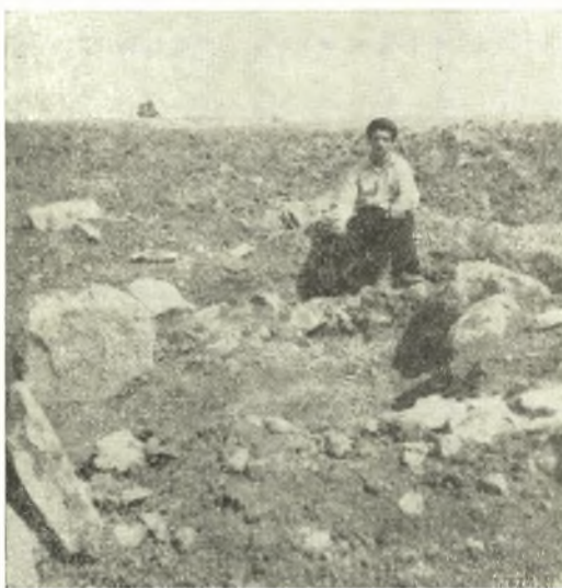
Εικ. 4. Ώσειδής τάφος τής νεκροπόλεως τής Φαρσαλου.

Κατά την σταυροειδή διαχάραξιν πέριξ του τάφου τής ύδρίας άνευρέθησαν πλησίον αυτου