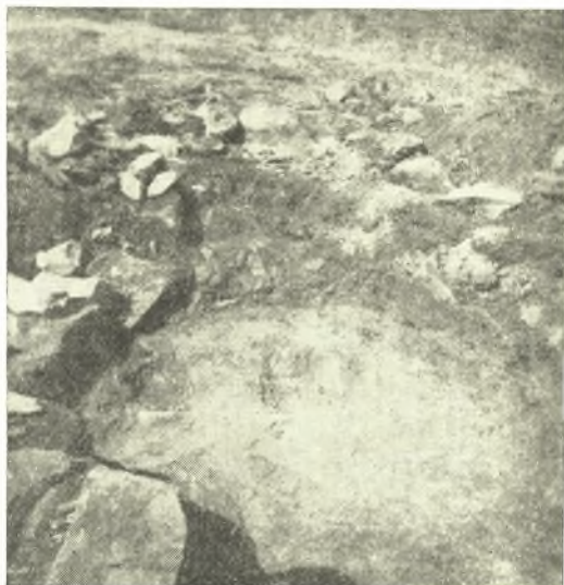
Εἰκ. 1. Περιφερὴς τάφος τῆς νεκροπόλεως τῆς Φαρσάλου.

Ὀλίγον δυτικώτερον καὶ ἐγγύτατα πρὸς τὴν δημοσίαν ὁδὸν ἀνεύρομεν ἕτερον τάφον, περι-