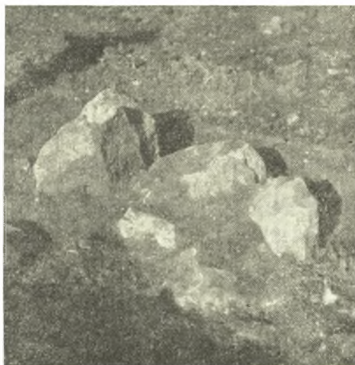
Εἰκ. 2. Τρόπος οἰκοδομῆς τοῦ ἐν εἰκ. 1 τάφου.

προκειμένην περιοχὴν θὰ εἶναι ἴσως δυνατὸν πλείονα νὰ ἔλθωσιν εἰς φῶς, ἢ δὲ Ἀρχαιολογικὴ Ἑταιρεία ἀσφαλῶς, ὡς ἐλπίζω, δὲν θὰ ἀρνηθῆ τὴν ἀρωγὴν τῆς πρὸς τοῦτο διὰ τὸ προσεχὲς ἔτος. Κατωτέρω παρέχω σύντομον ἔκθεσιν τῶν ἀποκαλυφθέντων κατὰ τὴν ἐφετινὴν πρόχειρον ἀνασκαφήν.