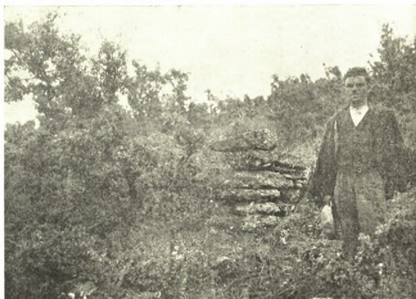
Εἰκ. 4. Τμῆμα ἐκ τῶν τειχῶν τῆς Πίμπλειας.

τῷ αὐτῷ κτίσματι εἶχον χρησιμοποιηθῆ ὡς οἰκοδομικὸν ἐπίσης ὑλικὸν τὰ ὑπὸ τοῦ ἰδιοκτῆτου εὑρεθέντα ποικίλα εἰς εἶδος καὶ μέγεθος θραύσματα ἐπιγραφῶν, ἀγαλματίων ἐνδεδυμένων γυναικῶν τύπου Ἡρακλεώτιδος, κεφαλαὶ ἀγαλματίων, ἀγαλμάτια ἀνευ χειρῶν καὶ κεφαλῶν, πλίνθοι ἀγαλματίων, χεῖρες, πόδες, βωμίσκοι, ἀκέφαλος καὶ ἄχειρ Ἑρμαφρόδιτος, Κυβέλη, Διό-