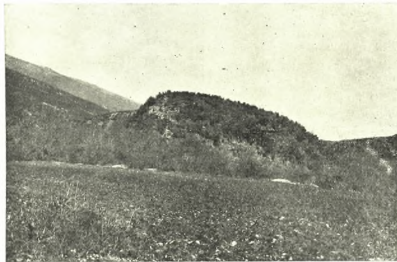
Εἰκ. 2. Ἀποψὶς τῶν χειμάρρων Καβουρόλακκα καὶ Γρίβα ἐκατέρωθεν τῆς ἀκροπόλεως.

δὲ περὶ τὸν Ὀλυμπον χειμάρρων καὶ ὁ Σῦς ἔστι) τότε οὖν οὗτος ὁ ποταμὸς κατέβαλε μὲν τὰ τεῖχη Λιβηθρίοις, θεῶν δὲ ἱερὰ καὶ οἴκους ἀνέτρεψεν ἀνθρώπων, ἀπέπνιξε δὲ τοὺς τε ἀνθρώπους καὶ τὰ ἐν τῇ πόλει ζῶα ὁμοίως τὰ πάντα. Ἀπολλυμένων δὲ ἤδη Λιβηθρίων, οὕτως οἱ ἐν Δίῳ Μακεδόνες, κατὰ γε τὸν λόγον τοῦ Λαρισαίου ξένου, εἰς τὴν ἑαυτῶν τὰ δοτᾶ κομίζουσι τοῦ Ὀρφέως». Ὁ Πausanias διὰ τῶν ὀλίγων τούτων στίχων ἱστορεῖ τὴν ἀκριβῆ θέσιν τῶν Λειβήθρων καὶ τὰς τύχας τούτων· ὅτι δηλ. ἡ πό-