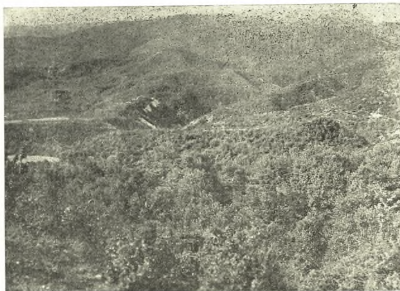
Εἰκ. 1. Γενικὴ ἀποψὶς τῶν Καναλίων.

Ὁ δὲ Ζυλιάνας φέρεται καὶ κατὰ θηλυκὸν γέ-