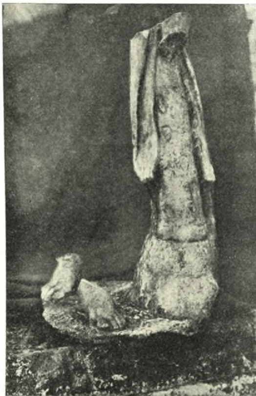
Εἰκ. 5. Πλίνθος μετ' ἐρείσματος ἀγαματίου Σατύρου.

τούτων τὸ μὲν παρὰ τὸ θέατρον νομίζω, ὅτι ἀνήκει εἰς τὸν Διόνυσον, τὸ δὲ παρὰ τὸν ποταμὸν καὶ πλησιέστερον πρὸς τὴν πηγὴν εἰς τὰς Μούσας. Ἀπέχουσι δὲ ταῦτα ἀπὸ τοῦ ἀγροῦ διακόσια περίπου μέτρα (Πρβ. Γ. ΣΩΤΗΡΙΑΔΟΥ Πρ. Ἀκ. Ἀθ. 1937 σελ. 4, Ἑλληνικά τόμ. Δ 1931,