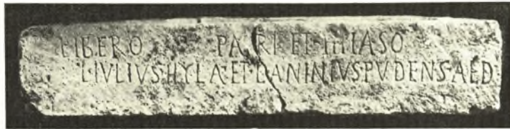
Εἰκ. 7. Λατινικὴ ἀναθηματικὴ ἐπιγραφή.

νῆκεν εἰς τὴν Παλατίνην φυλὴν. Ὄνομάσθη δὲ συγχρόνως provincia senatoria ἤτοι ἐπαρχία διοικουμένη ὑπὸ συγκλητικῶν ἐκάστοτε ἀποστελλομένου. Τὸ πλήρες δὲ τῆς ἀποικίας ὄνομα Colonia Julia Augusta Diensis ἀναγράφεται ἐπὶ νομισμάτων τῶν αὐτοκρατορικῶν χρόνων (πρβ. Γ. Π. ΟΙΚΟΝΟΜΟΥ αὐτ. σελ. 90, RE IV 549 ἀριθ. 242). Ἔνεκα τούτου ἐν τῇ μικρᾷ ταύτῃ πόλει διέμενον ἐκτὸς τῶν ῥωμαίων ἐγκα-