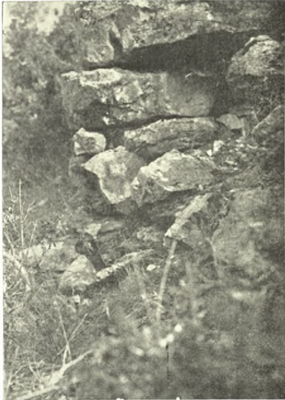
Εἰκ. 3. Τμήμα τείχους ἐκ τῆς δυτ. πλευρᾶς τῆς ἀκροπόλεως τῶν Λειβήθρων.

γωνται εἰς τὴν αὐτὴν ἐκείνοις ἐποχὴν ἦτοι τὴν γεωμετρικὴν. Οἱ τάφοι οὗτοι προήρχοντο, κατὰ τὴν παράδοσιν ἐκ συνοικισμοῦ ἀρχαιοτάτου, καταστραφέντος ὑπὸ χολέρας. Πρὸς πιθανὴν δὲ ἀνακάλυψιν τῶν ἐρειπίων τοῦ συνοικισμοῦ τούτου ἀναζητήσας τὰς σπανιζούσας περὶ τὸν ἀνα-