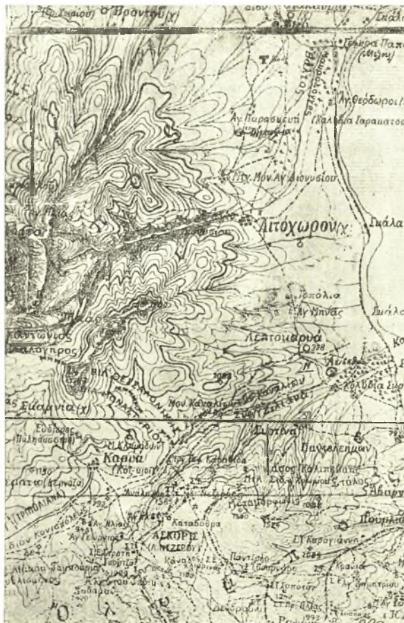
Εἰκ. 8. Τοπογραφικὸς χάρτης τοῦ ΝΑ Ὀλύμπου.

Πιμπληίδος ἄγχι, ἔξω τῆς πόλεως καὶ ἐπὶ τῆς ἐπὶ τὸ ὄρος Ὀλυμπον, μέχρι τοῦ ὁποῦ ἠδύνατο νὰ ἐκτείνηται τὸ τέμενος, ἄβατον ταῖς γυναιξὶ λόγῳ τῆς θέσεως, οὐχὶ μακρὰν τοῦ θεάτρου καὶ τῶν ἱερῶν Διονύσου καὶ Μουσῶν καὶ