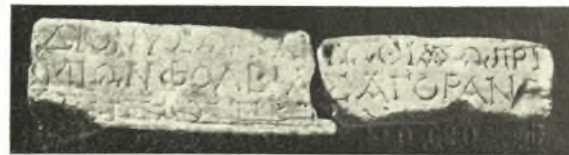
Εἰκ. 6. Ἀναθηματικὴ ἐπιγραφή Πριμίονος Φουλβίας.

4. Πλίνθου τριγωνικὸν ἀπότμημα· κατὰ τὴν ἄνω ἐπιφάνειαν ἑλλειψοειδῆς ἐντομὴ διὰ τὴν τοποθέτησιν ἀγαματίου· ἕτερον συναντήκον ἀπότμημα, παραδοθὲν ὑπὸ Ν. Κρεμέτη, παρέχει ὄλικὸν μῆκος 0.108 μ., πλάτος 0.08 μ., ὕψος 0.037 μ.· μάρμαρον ἐπιχώριον· ἐπὶ τῆς σφζομένης προσθίας μακρᾶς πλευρᾶς ἡ ἀναθηματικὴ ἐπιγραφή: (εἰκ. 6). Ἀριθ. κατ. 244/10. 279.