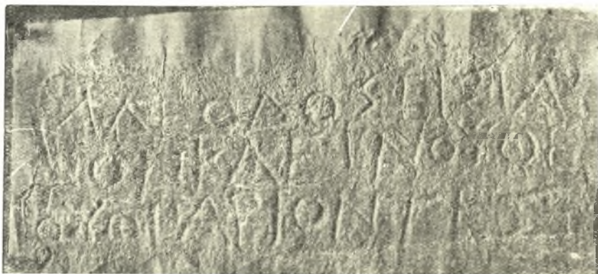
Εἰκ. 3. Ἐξ ἐκτύματος τῆς ἐπιγραφῆς ὑπ' ἀριθ. 3.

Τὰ γράμματα εἶναι τοῦ 3 ου π.Χ. αἰῶνος. Ἡ ἐπιγραφή αὕτη εὑρέθη εἰς ἀπόστασιν 3 περίπου χιλιομέτρων πρὸς τὰ βορειοδυτικὰ τοῦ ἱεροῦ, καθ' ἃ ἐπληροφορήθη παρὰ τοῦ εὐρόντος χωρικοῦ, μετακομίσαντος ταύτην εἰς τὸ χωρίον Κορώνι. Διὰ τῆς θέσεως ταύτης ἄγει ἡ ὁδὸς ἐκ τοῦ ἱεροῦ πρὸς τὴν παρὰλιον πόλιν τῆς Ἀρχαίας Ἐπιδαύρου διερχομένη διὰ μέσου βαθείας χαράδρας κατὰ τὴν ὁποίαν εἰς πολλὰ σημεῖα εἶναι δυνατὸν νὰ διακρίνη τις τὰ ἴχνη τῶν τροχῶν. Σήμερον ἡ ὁδὸς αὕτη εἶναι μόλις βατὴ καὶ