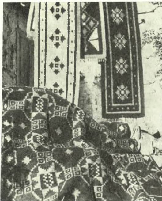
Εἰκ. 2. Ἄνω: Διαδρόμα. Κάτω: Σαλαπλάδα ἐξαιρέτου κατασκευῆς.

Ἐνθυμοῦμαι ἐνταῦθα ὅσα ἀναφέρει ὁ BLEGEN 3 περὶ τῶν δαπέδων ἐν γένει ἀνακτόρων καὶ οἰκιῶν τῆς Τροίας: «The floor was no doubt covered with matting carpets or skins», κυρίως δὲ ἐν σ. 72, ὅπου λέγει: «Δὲν εἶναι δυνατὸν νὰ ἐξακριβώσωμεν ἐκ ποίου ὑλικοῦ εἶχον κατασκευασθῆ τὰ ἐπὶ τοῦ ἀργαλειοῦ ὑφαντά. Τὰ παχέα βάρη (ἀγνῦθες) ὑποδεικνύουν ὅτι τὸ στημόνιον συνίστατο ἐκ παχέων ὑφαιδίων ἢ κορδωνίων καὶ ὅτι ἡ κατασκευὴ ἦτο τραχεῖα, μᾶλλον ἐκ μαλλίου». Κατόπιν τῶν ὄσων ἐξέθεσα ἀνωτέρω, εἰς ἐμὲ τοῦλάχιστον δὲν ὑπολείπεται ἀμφιβολία ὡς πρὸς τὴν εὐρείαν χρῆσιν τοῦ σπάρτου διὰ τὴν κάλυψιν τῶν δαπέδων τῶν ἀνακτόρων καὶ τῶν οἰκιῶν τῆς Τροίας. Τοῦτ' αὐτὸ