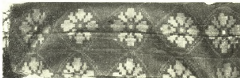
Εἰκ. 3. Σαλαπλάδα μετὰ διακοσμήσεως ἐξ ὑφαδίων σπάρτου.

Αἱ φωτογραφίαι παριστοῦν ὑφάσματα ἐκ σπάρτου, ὡς χρησιμοποιοῦνται ἔτι σήμερον εἰς τὴν Πελοπόννησον. Ἔχουν ὑφανθῆ ἐπὶ βαμβακεροῦ στήμονος διὰ σπαρτίνων ὑφαδίων, ἐπιμελῶς ἐξεργασμένων καὶ ὑφασμένων κατὰ τρόπον ἀπιστεύτως κομψὸν καὶ πυκνόν. Αἱ εἰκόνες 1 καὶ 2 ἄνω παριστοῦν διαδρομία χωρικῆς οἰκοδεσποίνης εἰς τὰ ὅποια φαίνεται ὀπωσοῦν καθαρὰ ἢ ὑφανσις καὶ τὰ διακοσμητικὰ σχέδια. Ἐπιμήκεις