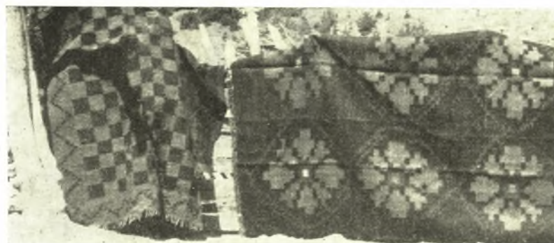
Εἰκ. 4. Τμῆμα διαδρομίου καὶ σαλαπλάδας .

ταινίαι εἰς χρωματισμὸν ἀντίθετον τοῦ βάθους μὲ ὁμοίχρωμα τετραγωνίδια μεταξὺ των ἢ γεωμετρικὰ σχήματα (τρίγωνα, ὀδοντωτὸν κόσμημα, ρομβοειδῆ σχέδια κλπ.), ἐνῶ αἱ εἰκόνες 2 κάτω, 3, 4 παριστοῦν ἐξ ἴσου λεπτῆς κατασκευῆς καὶ ἐπεξεργασίας ὑφάσματα ( σαλαπλάδα ) εἰς διακόσμησιν γεωμετρικῶς συμμετρικὴν καὶ μὲ ποικιλίαν