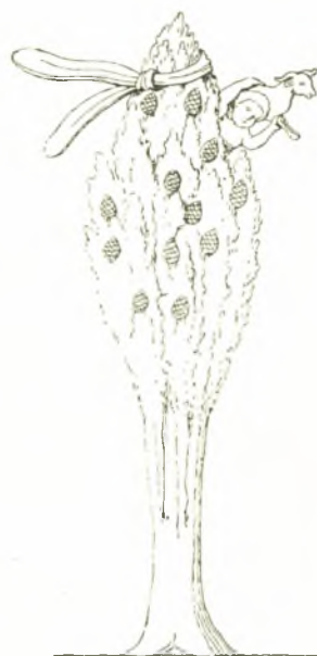
Εἰκ. 5. Διόνυσος (ἐρίφιος;) (Böttcher, Der Baumkultus εἰκ. 47).

ἔχοντος τὸν αὐτὸν περίπου σχηματισμὸν πρὸς τὴν περικλείουσαν τὸν Διόνυσον κληματίδα (εἰκ. 6). Ὁ Μίθρας δὲ ἐλατρεύετο μὲν ὡς θεὸς Ἥλιος, ἀλλ' εἶχε καὶ πολλὰς ἄλλας