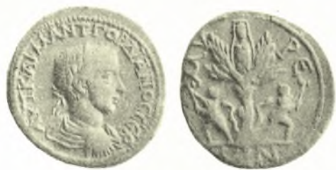
Εἰκ. 7. Νόμισμα Μύρων τῆς Λυκίας.

Ἡ προσκόλλησις εἰς τὰς ἰδέας ταύτας βεβαιοῦται καὶ ἐκ τῶν ἐπὶ μνημείων τῶν ἱστορικῶν χρόνων εἰκονιζομένων δένδρων μετὰ παντοίων ἀφιερωμάτων, ἐνίοτε καὶ πλησίον βωμῶν, συχνάκις δὲ καὶ μετὰ προσκυνητῶν πρὸ αὐτῶν 3 . Αἱ παραδόσεις διετηρήθησαν παρὰ τῷ Ἑλληνικῷ λαῷ διὰ τῶν αἰώνων καὶ ὑπολείμματα τούτων εἶναι αἱ προλήψεις περὶ τῶν «στοιχειωμένων» δένδρων 4 .