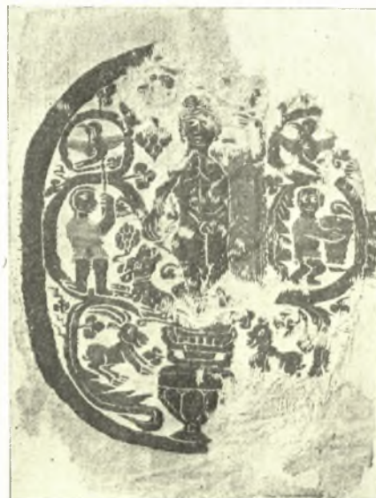
Εἰκ. 3. Ὁ Διόνυσος καὶ παρ' αὐτὸν κῶνος πίτυος.

δομένη ἐρμηνεία, διὰ τὸν τῆς Δάφνης δὲν ὑπάρχει, νομίζω, ἀμφιβολία ὅτι πρόκειται περὶ ἀπεικονίσεως ἱεροῦ δένδρου μετὰ τῆς ἐνοικούσης ἐν αὐτῷ ἡρωίδος.