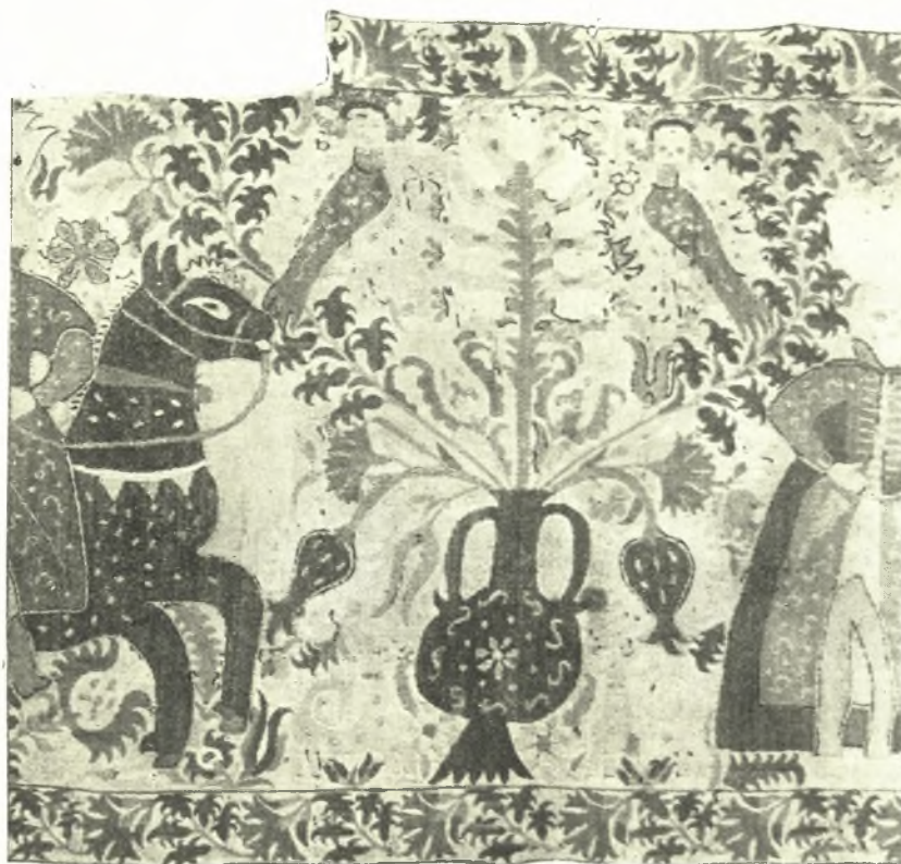
Εἰκ. 16. Ἡπειρωτικὸν κέντημα μετ' ἀνθρωποκεφάλων πτηνῶν (λεπτομέρεια τῆς εἰκ. 15).

ἐλαφρῶς πρὸς τὰ ἔσω καὶ ἐπὶ τῶν σχηματιζομένων ἐκ τούτων καὶ τοῦ κατακορύφου κεντρικοῦ ἄνθους κενῶν εἰκονίζεται ἀνὰ ἓν ἀνθρωποκέφαλον πτηνὸν μὲ τὴν κεφαλὴν κατ' ἐνώπιον (εἰκ. 16).