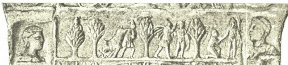
Εἰκ. 6. Ὁ Μίθρας ἀναδύμενος κατὰ τὸ ἄνω ἥμισυ ἐκ δένδρου.

ἔχοντος τὸν αὐτὸν περίπου σχηματισμὸν πρὸς τὴν περικλείουσαν τὸν Διόνυσον κληματίδα (εἰκ. 6). Ὁ Μίθρας δὲ ἐλατρεύετο μὲν ὡς θεὸς Ἥλιος, ἀλλ' εἶχε καὶ πολλὰς ἄλλας