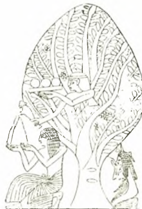
Εἰκ. 9. Ἡ Αἰγυπτιακὴ θεὰ Hathor, ἀναδυομένη ἐκ τοῦ ἱεροῦ δένδρου αὐτῆς.

Μὲ τὴν πάροδον τοῦ χρόνου τὰ ἀποτελοῦντα τὴν σύνθεσιν στοιχεῖα ἀπώλεσαν τὴν σημασίαν τῶν ἀρχαίων δοξασιῶν, αἵτινες προεκάλεσαν τὴν παράστασιν, ὡς ἐκ τούτου δὲ καὶ αἱ πολλαπλαῖ παραλλαγαί του. Ἡ σύνθεσις συναντᾶται ἐπὶ πλείστων μνημείων ὑπὸ διαφόρους τύπους 6 .