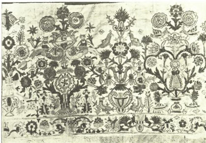
Εἰκ. 12. Κέντημα Κρητικὸν μετὰ μυθικῶν παραστάσεων.

β') Ὁ ἐκ τοῦ δευτέρου ἀγγείου κατακόρυφος βλαστὸς σχηματίζεται εἰς—ἐπιστεγαζόμενον ὑπὸ τριῶν ἀνθέων—κύκλον περικλείοντα κατὰ μέτωπον ἀνδρικήν μορφήν ὀλίγον ἀνωτέρω τῆς ὀσφύος καὶ ἐκτείνουσιν τὰς χεῖρας πρὸς τὸν κυκλικὸν σχήματος