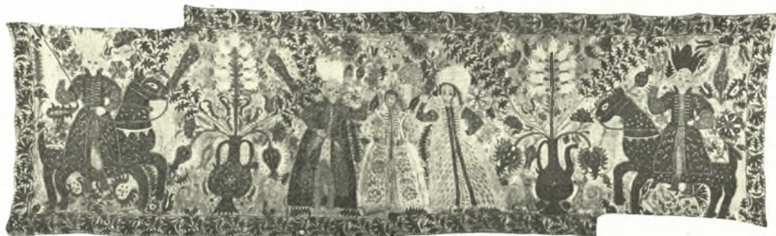
Εἰκ. 15 Γάμος ἐπὶ Ἡπειρωτικοῦ κεντήματος.

Τὸ ἀπὸ τῆς ἡμετέρας ἀπόψεως ἐνδιαφέρον σημεῖον εἶναι τὸ πρὸς ἀριστερὰ ἀνθοφόρον ἄγγειον, τοῦ ὁποῦ οἱ δύο μεγαλύτεροι ἐξωτερικοὶ μετ' ἀνθέων βλαστοὶ κυρτοῦνται