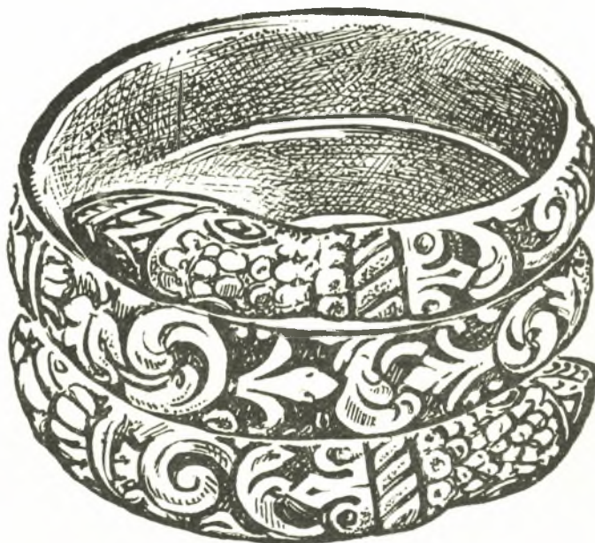
Εἰκ. 13. Δικέφαλος ὄφις Κρητικοῦ δακτυλίου, (δμ. 0.022: ὕψ. 0.016).

Κατὰ πᾶσαν πιθανότητα σχέσιν πρὸς τὰ στοιχειωμένα δένδρα ἔχει καὶ τὸ θέμα τοῦ δευτέρου ἀγγείου μὲ τὴν εἰκονιζομένην ὡς ἐνοικοῦσαν τρόπον τινὰ ἐντὸς τοῦ κύκλου μορφήν καὶ τοὺς ἐκατέρωθεν περρωτοὺς δράκοντας μὲ τὰς ἐπιβαινούσας κερα-