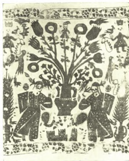
Εἰκ. 14. Ἡπειρωτικὸν κέντημα μετὰ μορφῆς δενδρίτιδος.