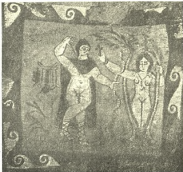
Εἰκ. 4. Δάφνη ἀναδυομένη ἐκ φυτοῦ καὶ παρ' αὐτὴν ὁ Ἀπόλλων.

2) Ὁ Μίθρας 2 , θεὸς ἱρανικός, τοῦ ὁποίου ἡ λατρεία ἐξηπλώθη καταπληκτικῶς εἰς τὴν Εὐρώπην, παρίσταται κατὰ τὸ ἄνω ἥμισυ ὡσαύτως ἐξερχόμενος ἐκ τινος δένδρου, ἐκφυομένου ἐπίσης ἐκ τοῦ ἐδάφους μετὰ ὑψηλοῦ κορμοῦ, τοῦ φυλλώματός του