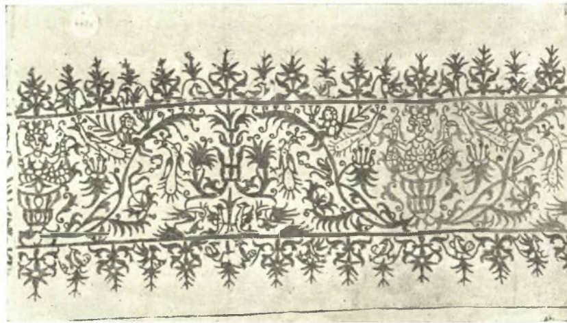
Εἰκ. 11. Κρητικὸν κέντημα μετὰ Γοργόνας.

Ἐπὶ τῆς Γοργόνας τῶν Κρητικῶν κεντημάτων ἔχομεν ἀσφαλῶς ἀπήχησιν ἀρχαίου, ἐκ τῶν περὶ τὸν Μ. Ἀλέξανδρον παραδόσεων, μύθου 3 , λίαν διαδεδομένου ἐν Κρήτῃ