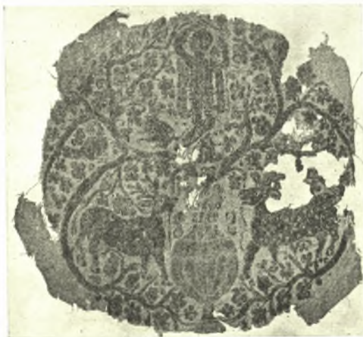
Εἰκ. 2. Ὁ Διόνυσος καὶ παρ' αὐτὸν θύρσος ἐντὸς κληματίδος ἐκφυομένης ἐξ ἀμφορέως.

"Αν διὰ τὸν τύπον τοῦ Διονύσου φαίνεται ἐκ πρώτης ὄψεως παράδοξος ἢ ἀποδι-