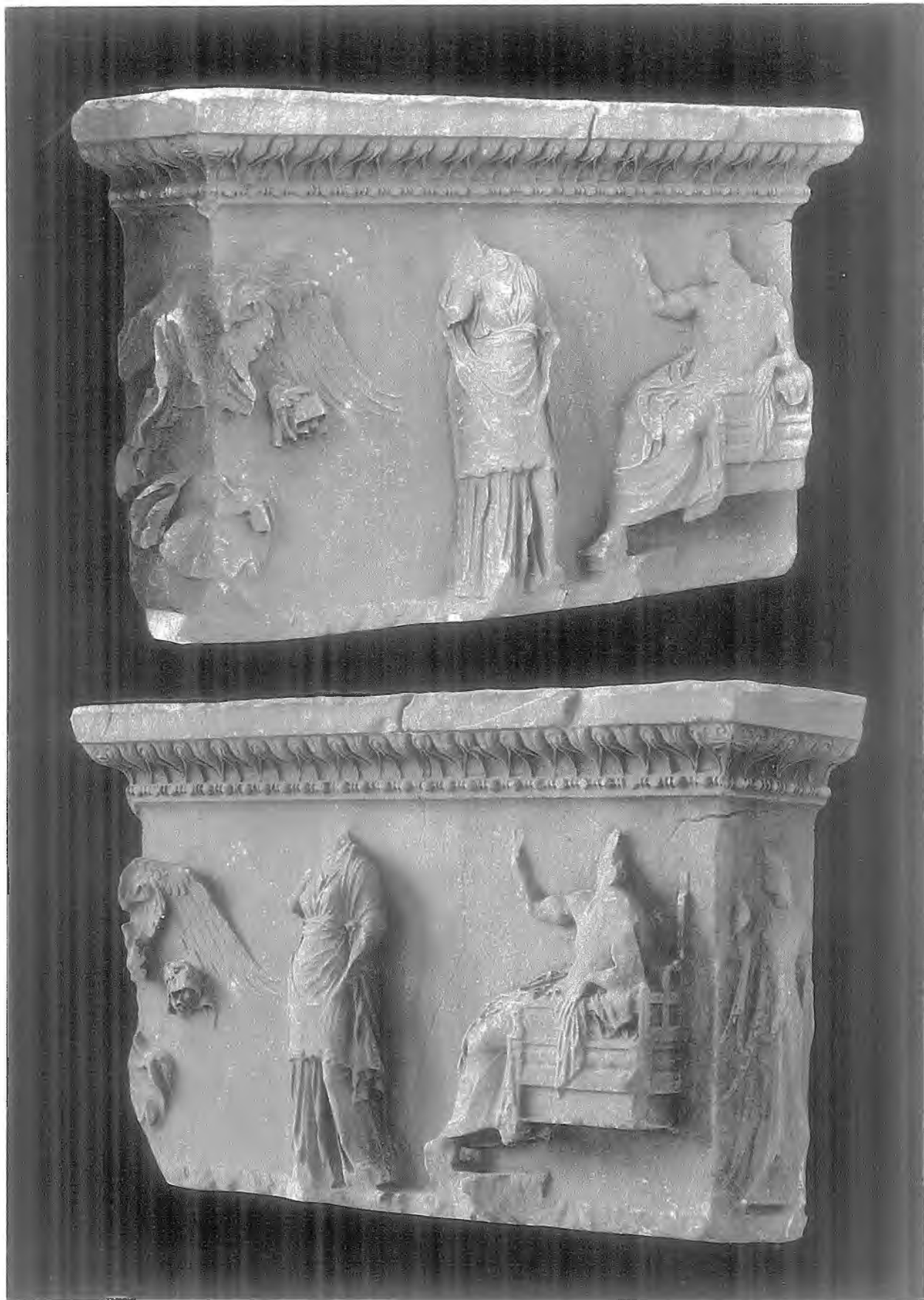
ΑΝΑΓΛΥΦΟΝ ΕΞ ΕΠΙΔΑΥΡΟΥ