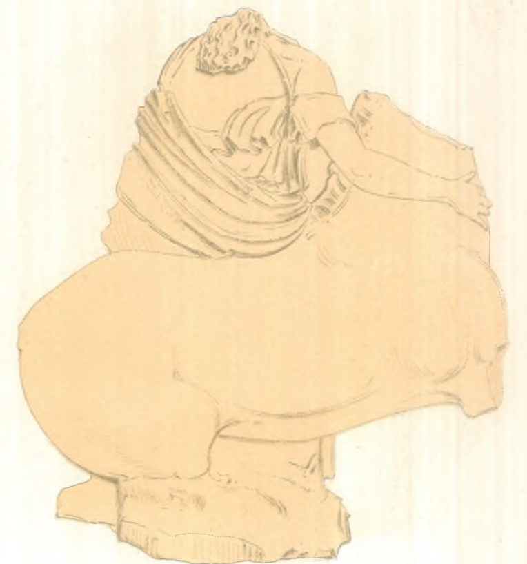
3 a .