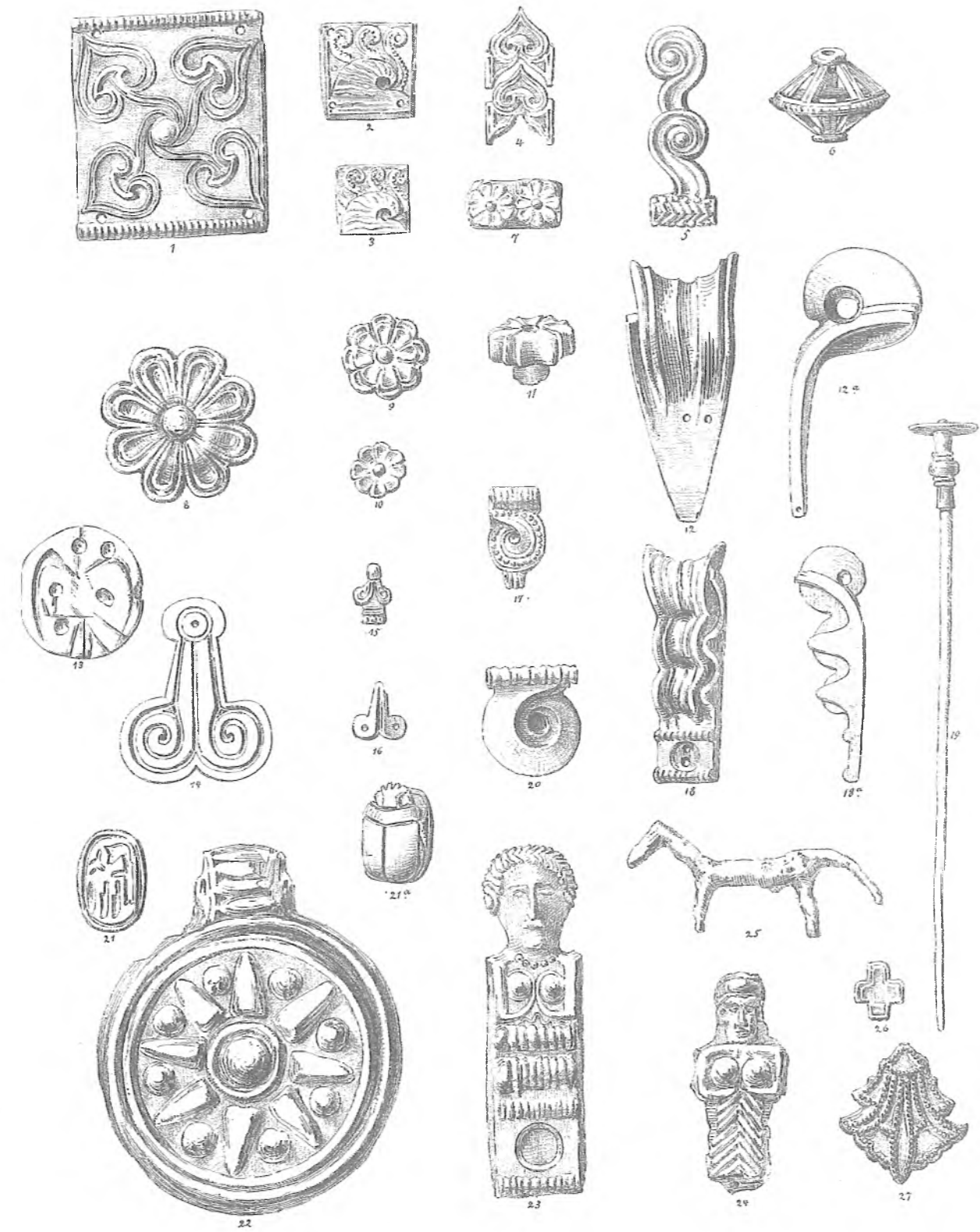
ΑΡΧΑΙΟΤΗΤΕΣ ΕΚ ΜΥΚΗΝΩΝ