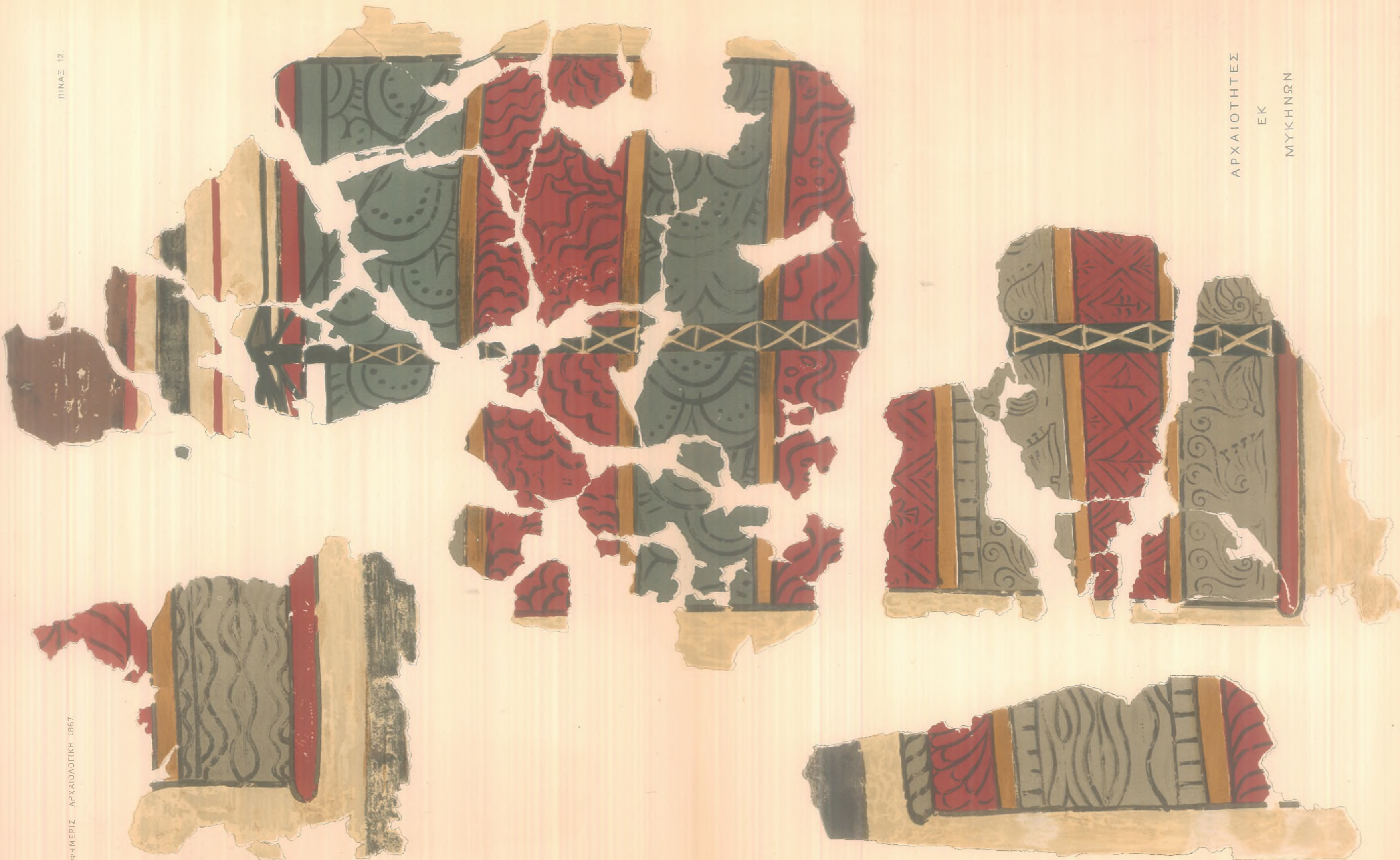
ΑΡΧΑΙΟΤΗΤΕΣ ΕΚ ΜΥΚΗΝΩΝ