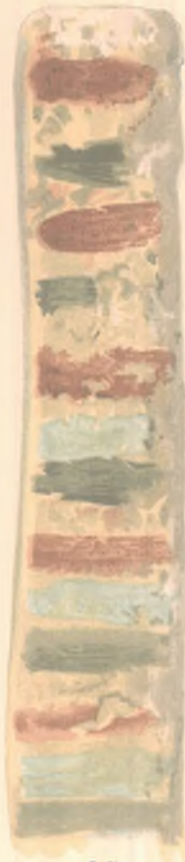
2 α .