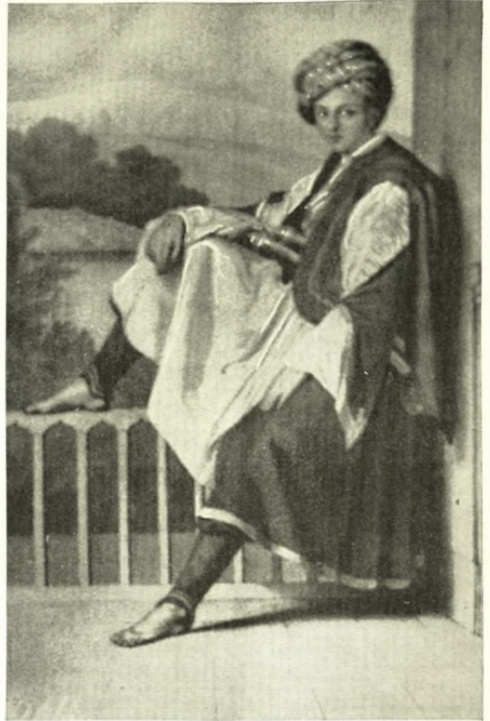
Θεσσαλοί της Τουρκοκρατίας (Εικόνες ξένων περιηγητών)