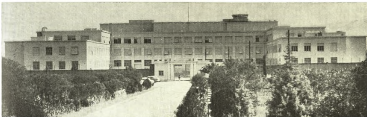
Τεχνικὲς ἐγκαταστάσεις Χολαργοῦ.

μέ ταχὺ καὶ ἐπαρκῆ ἐφοδιασμόν εἰς χρυσὰς λίρας. Διὰ τὸν ἐφοδιασμόν αὐτὸν διέθεσε πολῦτιμον συνάλλαγμα. Τὴν ἐποχὴ αὕτη τὸ Ἑλληνικὸν κοινὸν εἶχε ἐπενδύσει 560.000.000.000 δραχμὰς ἤτοι τὸ 1)3 περίπου τῆς νομισματικῆς κυκλοφορίας σὲ χρυσὰς λίρας. Ἡ ἐπένδυσις αὕτη στεροῦσε τὴν οἰκονομίαν ἀπὸ ἀντίστοιχα μέσα πληρωμῆς, χρήσιμα διὰ τὴν ἀγορὰν ἄλλων ἀπαραιτῶν ἀγαθῶν. Ἐνας ἀπὸ τοὺς σοβαροὺς λόγους τῆς χαλαρώσεως τῆς οἰκονομικῆς δραστηριότητος τῆς χώρας ἦτο ἡ δέσμευσις κεφαλαίων στὸν ἀποθησαυρισμὸν χρυσῶν λιρῶν. Ὁ θησαυρισμὸς χρυσῶν λιρῶν ἀπὸ τοὺς Ἑλληνας πολῖτες εἶναι καταστρεπτικὸς διὰ τὴν Ἑλληνικὴν οἰκονομίαν. Συνάμα εἶναι καὶ πολὺ βλαβερὸς διὰ τοὺς ἀποθησαυριστὰς τῶν λιρῶν, διότι με τὰς κυμάνσεις τῆς τιμῆς τῆς χρυσῆς λίρας, ὑφίστανται ζημίαν ἢ ὁποῖα μειώνει τὸ χρηματικὸ των κεφάλαιον. Αἱ χρυσαὶ λίραι εἰς οὐδὲν χρησιμεύουσι παρά μόνον ὡς κάλυμμα τῆς Τραπεζῆς τῆς Ἑλλάδος, διὰ τὴν χαρτίνην χρηματικὴν κυκλοφορίαν. Τὸ κάλυμμα αὐτὸ τῶν χρυσῶν λιρῶν εἶναι ἡ ἐγγύησις τῆς διατηρήσεως τῆς σταθερῆς ἀγοραστικῆς ἰκανότητος καὶ τῆς ἐξωτερικῆς ἀξίας τῆς δραχ-