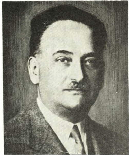
ΕΜΜΑΝΟΥΗΛ ΤΣΟΥΔΕΡΟΣ Διοικητής ( 1931 - 1939 )