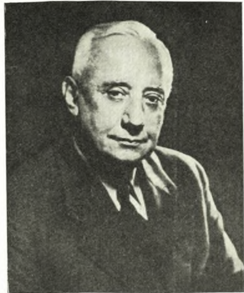
ΚΥΡΙΑΚΟΣ ΒΑΡΒΑΡΕΣΟΣ Διοικητῆς (1939 - 1946)

Βάσει νόμου τῆς 29)7)1932 αἱ καταθέσεις αἱ ὁποῖαι ὑπῆρχαν εἰς