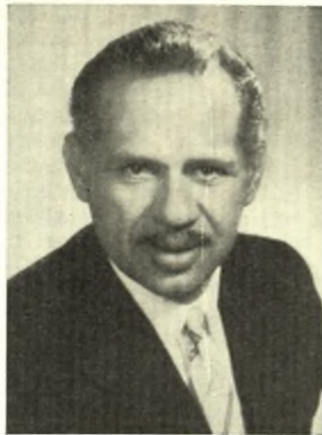
ΤΑΚΗΣ Ι. ΚΑΡΔΑΡΑΣ

Έγεννήθη εν Λαρίση. Έλαβε μέρος εις τόν Έλληνοϊταλικόν πόλεμον του 1940. Κατά τήν άπελευθέρωσιν ύπηρέτησεν ώς Έφεδρος Άξιωματικός. Έχει διατελέσει Νομάρχης Ζακύνθου, ώς και Υπουργός Γενικός Διοικητής Ήπειρου. Κατά τās έκλογάς του Φεβρουαρίου του έτους 1964 εξελέγη βουλευτής του Νομού Λαρίσης.