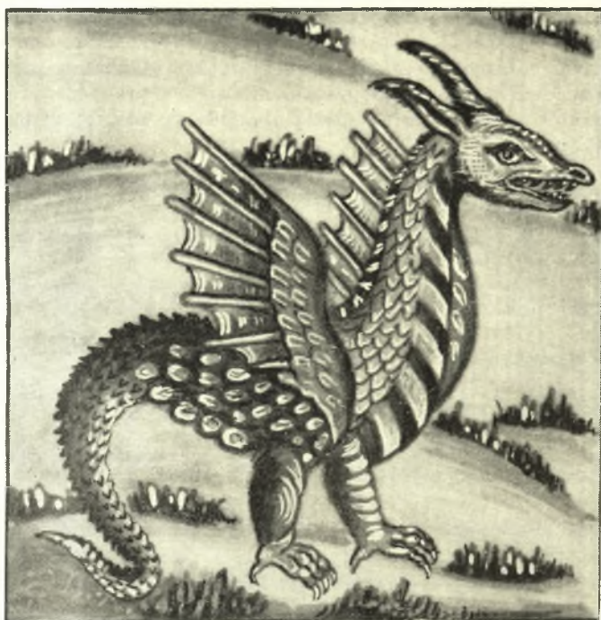
Εικ. 2. Δράκων. Έκ τοιχογραφίας της Μ. Βαρλαάμ Μετεώρων (Αντιγραφή: Βαγγέλη Σκουβαρά)

Τῆς ἀνωτέρω παραδόσεως ὑπάρχουν εἰς τὸ Λ.Α. δύο εἰσέτι παραλλαγὰι ἐξ Ἀσπροποτάμου Πίνδου 11 εἰς τὰς ὁποίας ἀναφέρεται δράκων μὲ κεφαλὴν ἀνθρώπου καὶ σῶμα ὄφεως. Ἐπίσης ὁ Ν. Γ. Πολίτης ἀναφέρει ὅτι «εἰς Σαράντα Ἐκκλησιᾶς τῆς Θράκης 12 τόπακας (πληθ. τοπακάδες) εἶναι τὸ ὄνομα τοῦ στοιχείου, τοῦ φυλάσσοντος θησαυρόν, ὅπερ φαντάζονται κατὰ τὸ ἥμισυ ἄνθρωπον καὶ κατὰ τὸ ἥμισυ ὄφιν» 13 .