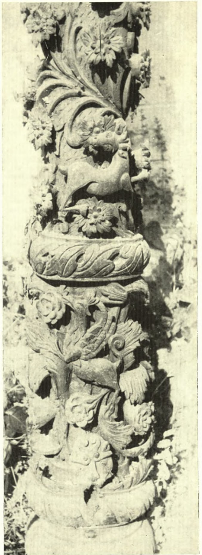
Συλόγλυπτος κιονίσκος ἀπὸ τὸ τέμπλο τῆς Παναγίτζας Ζαγορᾶς (Ἀπὸ τῆ συλλογῆ Βαγγέλη Σκουβαρᾶ)