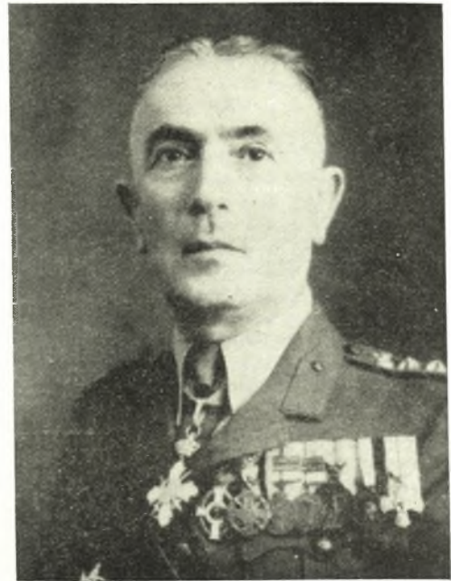
ΤΑΣΣΟΣ Β. ΚΟΝΤΑΞΗΣ ὑποστράτηγος ἐ.ἀ.

Διὰ τὴν ὑπάρχουσαν τότε ἀντίληψιν τῆς ἀναγκαιότητος καὶ τῆς σημασίας, ἡ ὁποία ἀπεδίδετο εἰς τὴν κοινωνικὴν τροφοδοσίαν τοῦ στρατοῦ ἀναφέρεται χαρακτηριστικῶς ὅτι ὁ στρατάρχης τῆς Πελοποννήσου Θεοδ. Κολοκοτρώνης ἐν ὄψει τῆς προελάσεως τοῦ Δράμαλι διὰ τῶν Δερβενάκιων διέταξε τὸν ἐμπρησμόν τῶν σιτηρῶν καὶ τροφίμων τῶν κατοικῶν διὰ νὰ δυσχεράνη τὴν τροφοδοσίαν τοῦ τουρκικοῦ στρατοῦ καὶ ἐπιτύχῃ τὴν κατανίκησιν του καὶ