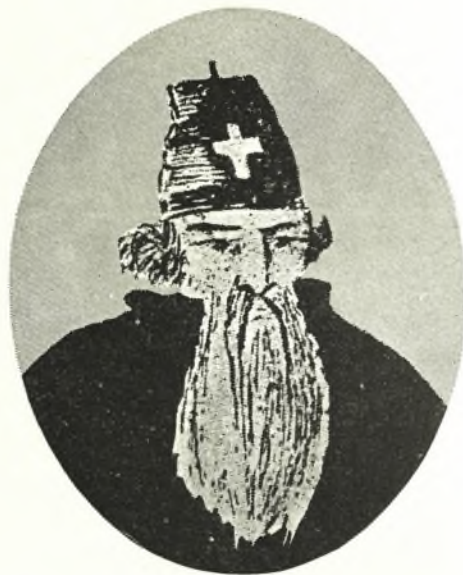
Ο ΤΡΙΚΚΗΣ ΔΙΟΝΥΣΙΟΣ

ριγραφή διαφόρων μερών της Ελλάδας και της Δημητριάδος και της Ζαγοράς (έπίσης σε άλλο χειρόγραφο: Ίστορία Δημητριάδος και Ζαγοράς) κλπ. Άπ' αυτή την πλευρά, όπως και ο Καισάριος Δαπόντες, μπορεί να θεωρηθή ένας πρόδρομος των νεοελληνικών σπουδών. Ξεχωριστό όμως ενδιαφέρον, άσχετα με την γλώσσα τους, πρέπει να έχουν, καθώς συνάγουμε άπ' τους τίτλους τους, τά λογοτεχνικά του έργα. Και πρώτα-πρώτα ή συμπλήρωση και διασκευή της Βοσπορομαχίας του Μομάρς. Ήπειτα διάφοροι διάλογοι: Διάλεξις άνδρογύνου, Διάλεξις σοφού και ιδιώτου, Διάλογος κατ' έρωταπόκρισιν πλατάνου τινός, διήγησις των όσων ήκουσε και άκούει παρά των έκείσε καθεζομένων γερόντων και άλλων, Μονωδία προς διδάσκαλον Κριτίαν, Δωρόθεον και άλλους, Διήγησις όράματός τινος ή μύθος νυκτερινοχειμερινός, Περί νεωτερισμών και συστήματος τούτων, Κωμωδία κατ' Αύξεντιανών, Σπλαγχνοσπαράκτης, Μυσελέγκτης, Όνειρος ή άλήθεια. Ό πολυγραφώτατος αυτός πατριάρχης χρειάζεται μελέτη και άποκατάσταση.