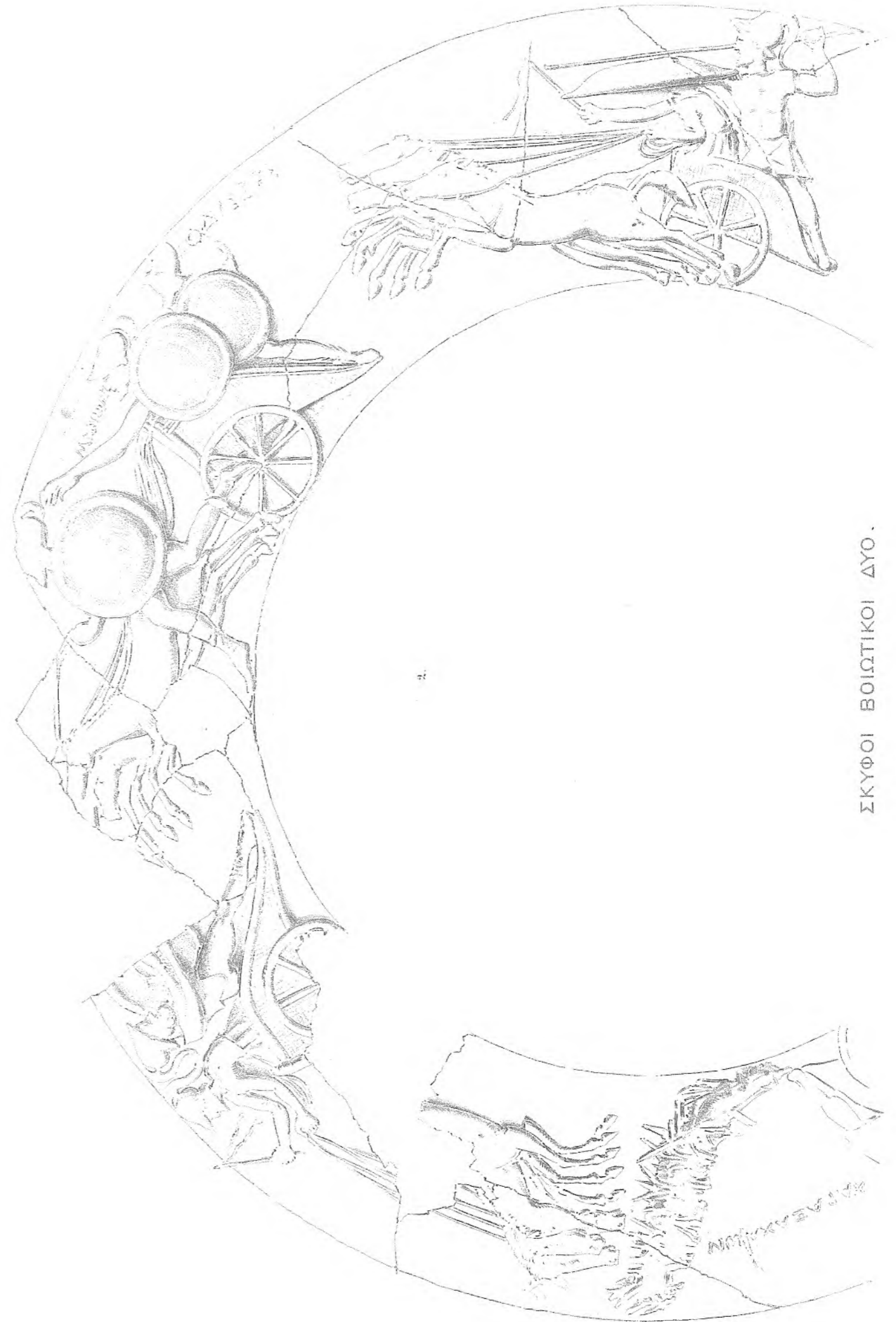
ΣΚΥΦΟΙ ΒΟΙΩΤΙΚΟΙ ΔΥΟ.