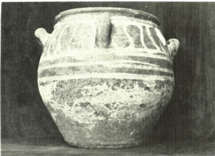
Δ. Κρήτη. Χανιά : α. Ειδώλιον και ληκύθια Δ' π. Χ. αι. εκ Μαζαλή. β. Ύέλινον άγγειον εκ Σκλαβοπούλας, γ. ΥΜ Η άγγειον εκ τοῦ σπηλαιου τοῦ Μελιδονίου