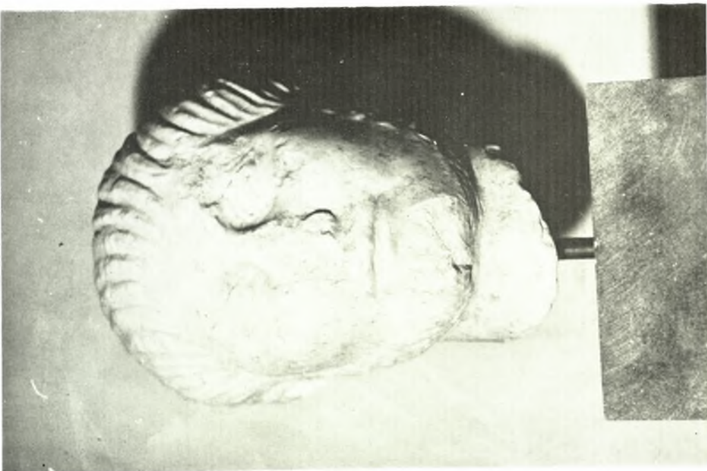
Χανιά: α. Εικονιστική κεφαλή άνδρός, ρωμαϊκών χρόνων, εκ Κυδωνίας. β. Ύψιλον άγγειον εκ Σκλαβοπούλας