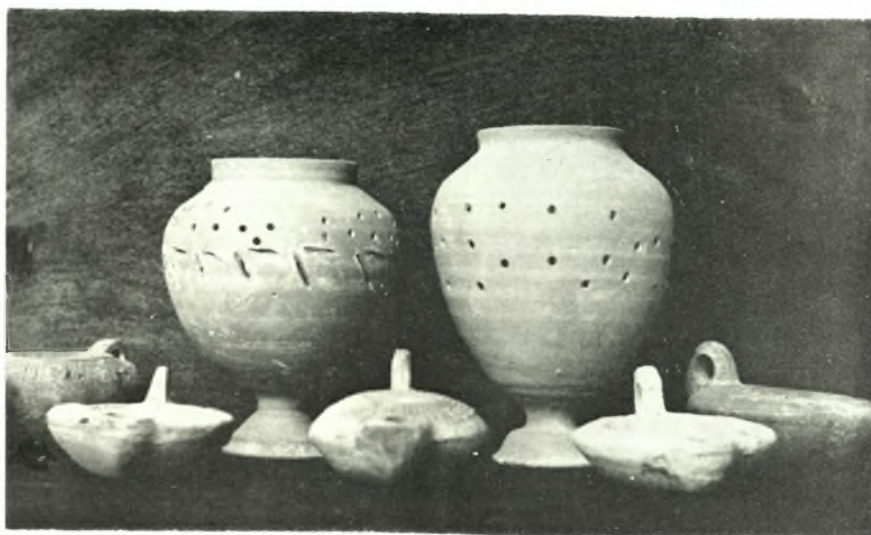
Δ. Κρήτη. α. Κεραμική ἐκ τῶν ρωμαϊκῶν τάφων Σκλαβοπούλας, β. ΥΜ ΙΙΙ ἀγγεῖα ἐξ Ἀκρωτηρίου, Νέων Ρουμάνων καὶ Χαλέπας Χανίων. γ. Ἀγγεῖα καὶ λύχνοι ἐκ τοῦ ρωμαϊκοῦ λαξευτοῦ τάφου Ἀπτέρας