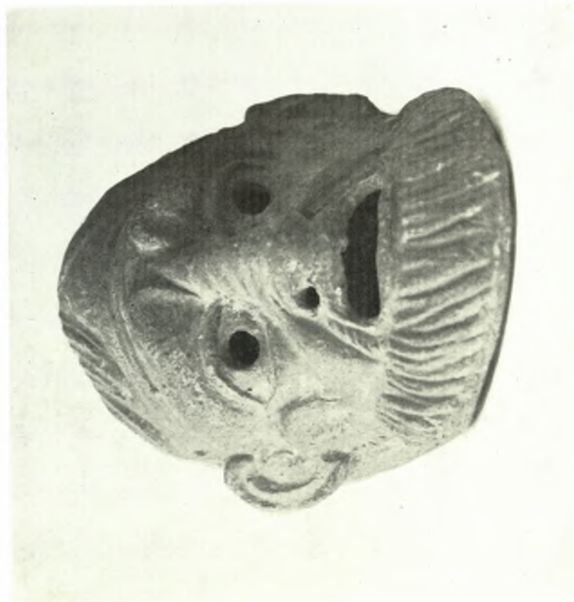
Κρήτη. Συλλογή Μεταξά: α. Τραγικόν προσωπεύον. β. Αγγείον barbotine μοναδικού σχήματος