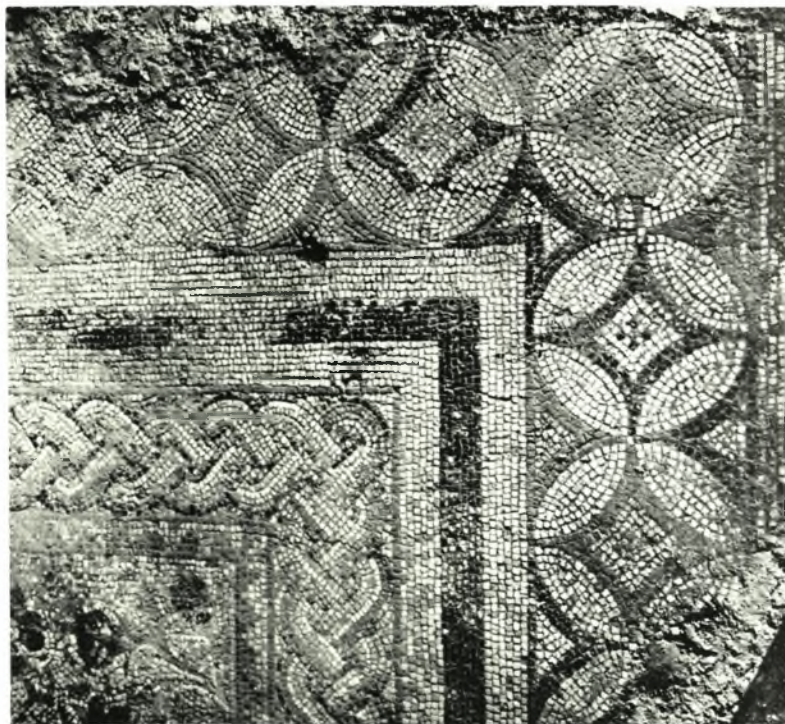
Γόρτυς: α. Τμήμα του ψηφιδωτού του παλαιохριστιανικού κτηρίου, β. Βωμός παρά τὸ ρωμαϊκὸν νεκροταφεῖον