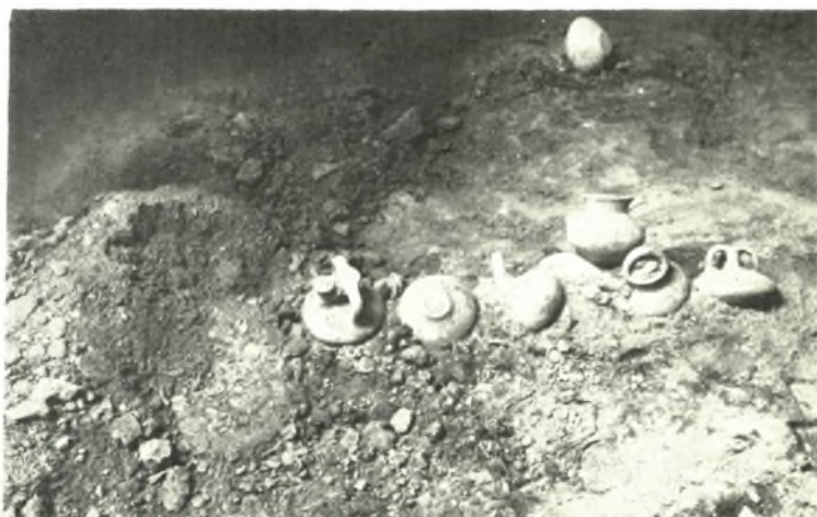
Κρήτη. Γόρτυς: α. Άπομεις τής καταστροφής του ρωμαϊκού κτηρίου υπό τής MOMA παρά τον Άγ. Τίτον, β. Ή θήκη α του τάφου Z του ρωμαϊκού νεκροταφείου, γ. Ό μυκηναϊκός τάφος εις Καλοχωραφίτην κατά τήν άνασκαφήν