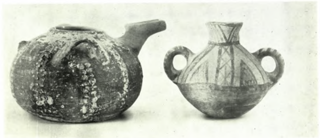
Κρήτη. Συλλογή Μεταξά: α. Σφραγίς μεθ' ἱερογλυφικῶν (ἄνω), σταθμίον μετ' ἀμφορέως (κάτω ἀριστερὰ) καὶ μήτρα χρυσοῦ ἑνωτίου (κάτω δεξιὰ), β. Ἄγγειον Barbotine (ἀριστ.) καὶ Ἄγ. Ὀνουφρίου (δεξιὰ)