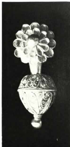
Όμόλιον: α-β. Τάφος Α. Χρυσούν ένώτιον (μέγεθος 2:1) και χρυσούν μετάλλιον, γ. Τάφος Β. Δακτύλιος (μέγεθος 2:1 περίπου), δ. Τάφος Α. Όρμος χρυσού περιδεραιού (ύψ. 0,0265 μ.)