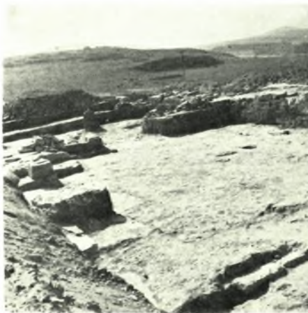
Δημητριάς: α. Τὰ λείψανα τοῦ ναοῦ τῆς Ἀρτέμιδος Ἰωλκίας (ἀπὸ ἀνατολῶν), β. Μακεδονικὸν ἀνάκτορον: Νότιος ἐξωτερικὸς τοῖχος, γ. Δωμάτια τῆς ΒΔ. πλευρῆς τοῦ ἀνακτόρου